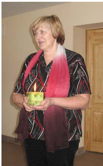
2010. gada 2. marts.