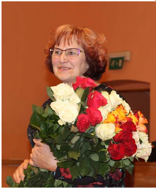
2019. gada 2. februāris.