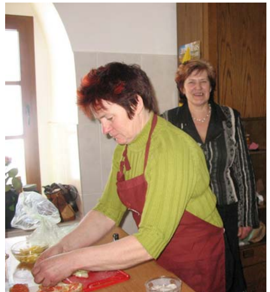
2011. gada 9. marts – nodarbības „Apiņu kalts” virtuvē.