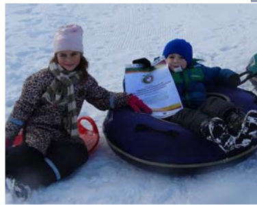
Paldies Ventam Ikauniekam par dāvāto iespēju piedalīties projektā.