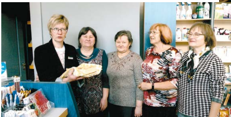
Kopā ar „Ābeles” meitenēm.