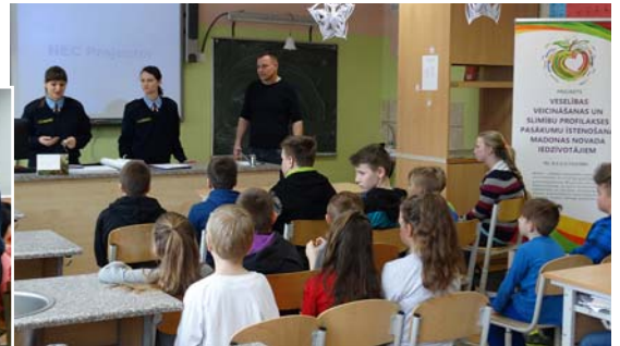
Policijas dienas skolā.