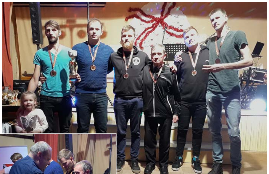
Mētrienas vīriešu volejbola komanda.