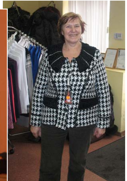
2011. gada 5. februāris – stila pārvērtības veikalā „Rēzija”.