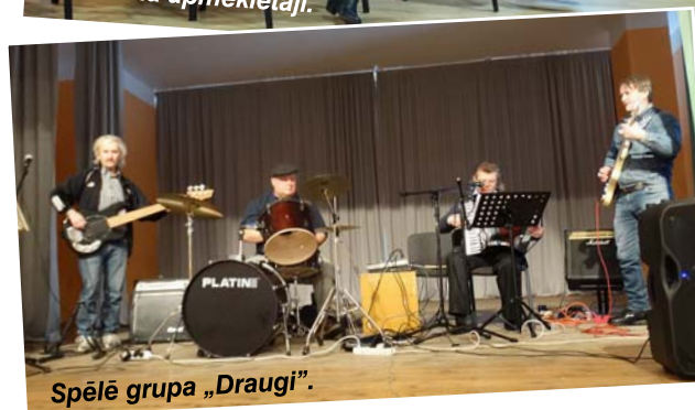
Spēlēja grupa „Draugi”.