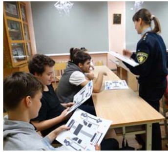
Būs pašiem sava policijas mašīna.

Savukārt 14. februārī bija „Sniega diena”. Viešūra kalna apmeklējums.