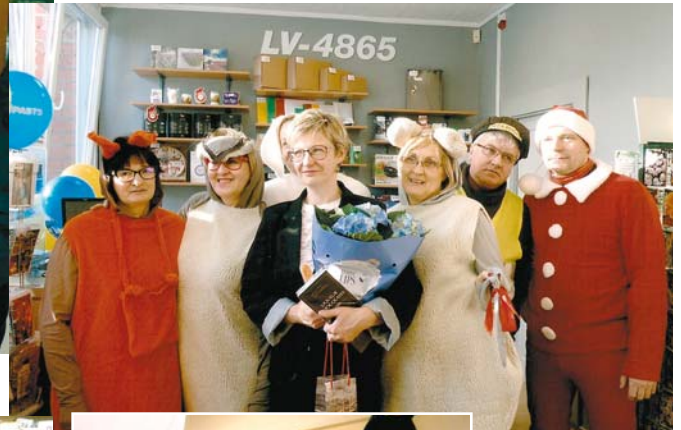
Leldi sveic viņas kolēģi no teātra kolektīva.