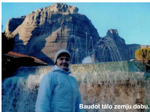
Baudot tālo zemju dabu.