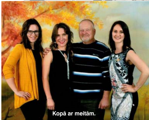
Kopā ar meitām.