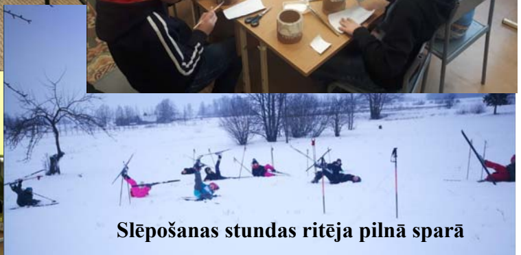
Slēpošanas stundas ritēja pilnā sparā