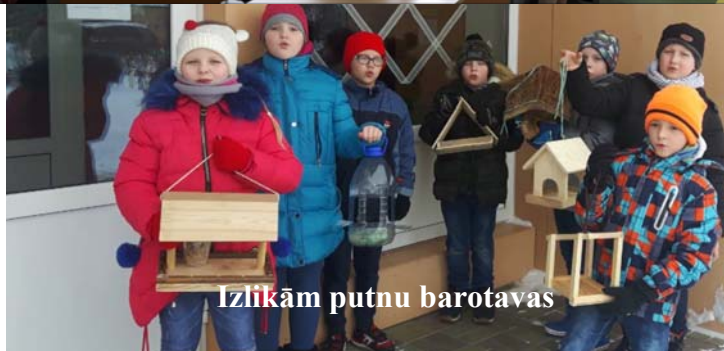
Izlikām putnu barotavas