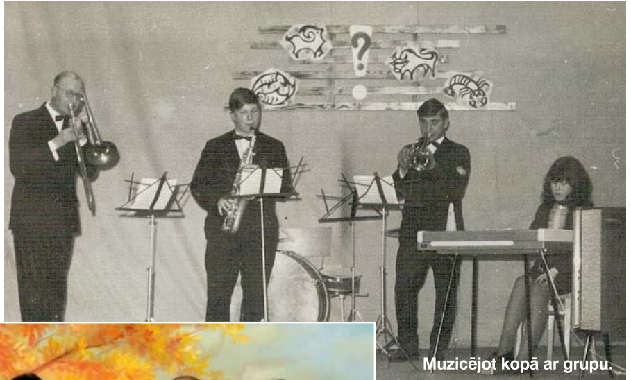
Muzicējot kopā ar grupu.