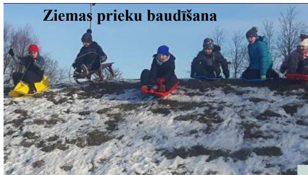
Ziemas prieku baudīšana