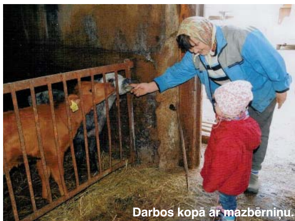
Darbos kopā ar mazbērniņu.

Esmu īsta lauku sieviete. Lauku darbos jūtu sevi, sakārtoju savas domas, savu iekšējo pasauli. Mani nebauda grūtības, agrā celšanās vai vēlās vakara stundas. Savu dzīvi bez laukiem nevaru iedomāties. Darba ir daudz, faktiski, tie nav padarāmi. Tomēr, ja neesi slinks, tad var ļoti daudz ko padarīt. Katru dienu aprūpēju savus lopiņus. Skaita ziņā 13 gotiņas, tāpat teliņi, rukši. Vēl piemājas dārziņš, kurš nebūt nav mazs, bet toties savs audzēts.