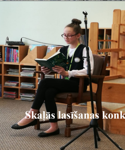
Skalās lasīšanas konkurss Madonā