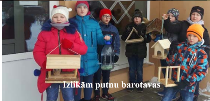
Izlikām putnu barotavas