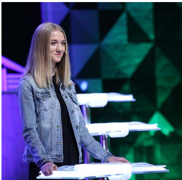
Kadrs no spēles.

Īsti nebija tādi visgrūtākie jautājumi, pārsvarā visi jautājumi bija zināmi, bet liekais uztraukums un stress dažkārt darīja savu.