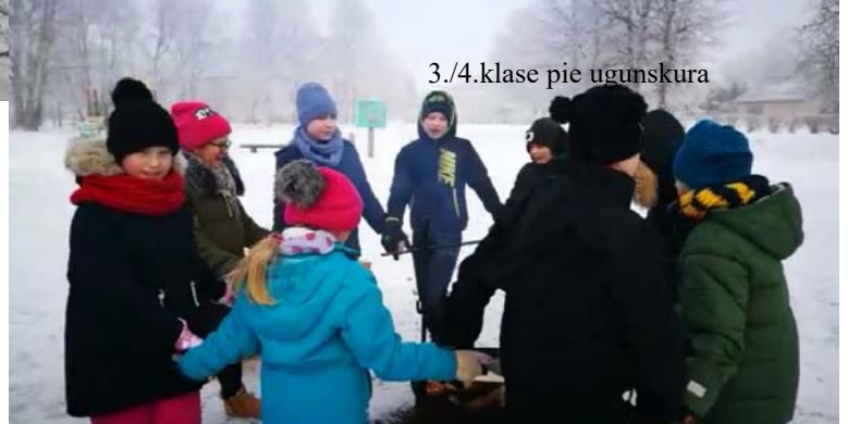
3./4.klase pie ugunsroku

Jāpiebilst, ka tā bija interesanta sporta, sociālo zinību un Latvijas vēstures stunda. Par notikušo stāsta mazie video un fotogalerija skolas mājas lapā.