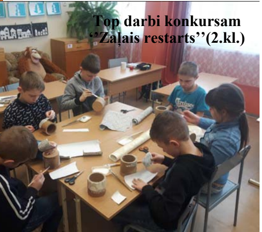
Top darbi konkursam "Zaļais restarts"(2.kl.)