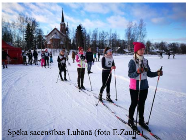
Spēka sacensības Lubānā

Pulkveža Oskara Kalpaka piemiņas fonda valdes locekle, direktora vietnieces audzināšanas jomā un skolotāja Edīte Zaube