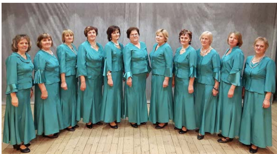
Kopā ar „Orhidejām”.

Tikai tas, ka mans savs darbs „jānes mājās”. Es nevaru pēc nodarbības aiztaisīt aiz sevis kultūras nama durvis un neko