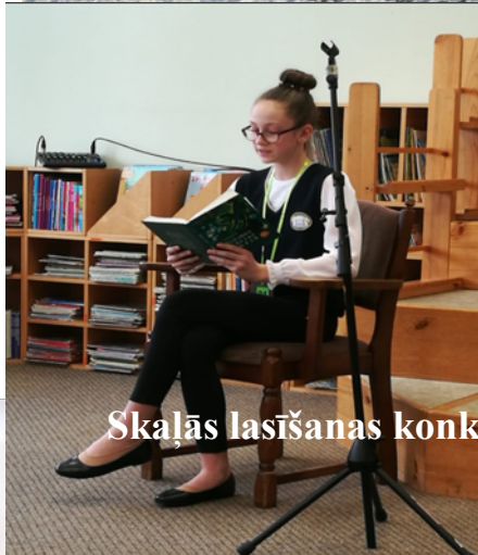
Skalās lasīšanas konkurss Madonā