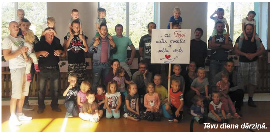
Tēvu diena dārziņā.

Visa pusgada garumā vecākās grupas „Taureniņi” bērni apguva Džimbās drošības programmu un piedalās arī LVM ekoprogrammā „Cūkmena detektīvi”. Bija arī dalībnieki nodarbībā „Man ir tīri zobi!”