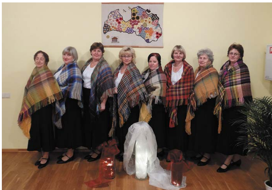
Dāmu deju grupa „Saulgriezes”.