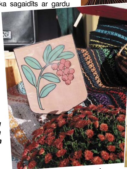
Lepni stāv Mētrienas pagasta ģerboņa attēls.

Solvīta Stulpiņa Foto no kolektīvu personīgajiem arhīviem