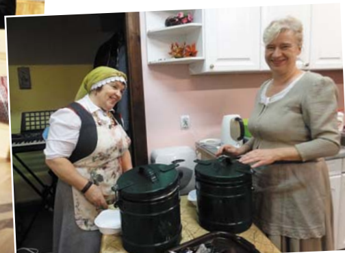
Saimnieces mūs sagaida ar gardu putru.