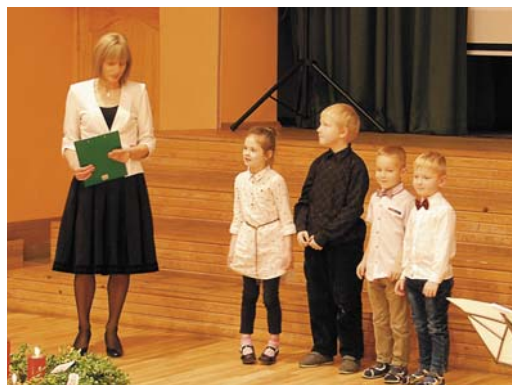
Pasākumā uzstājas ciemiņi no dārziņa.