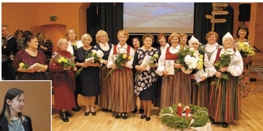
Grāmatas tapšanas procesā iesaistītās mētrienietes.