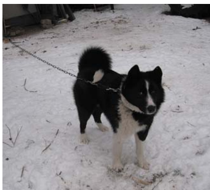
Keris jau liels.