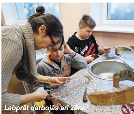
Labprāt darbojās arī zēni.