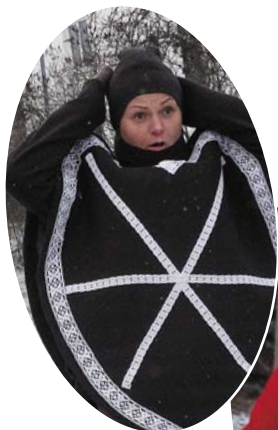
Piparkūka Sirsniņa un rūķis Brīnums.