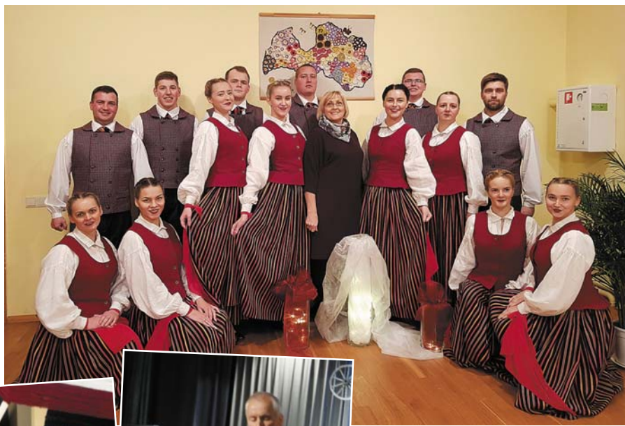
VPDK „Meteņi +” Lauterē.