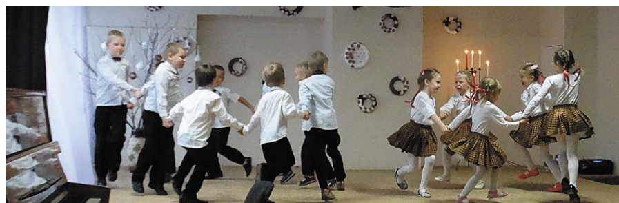
Dejo pirmsskolas bērni.