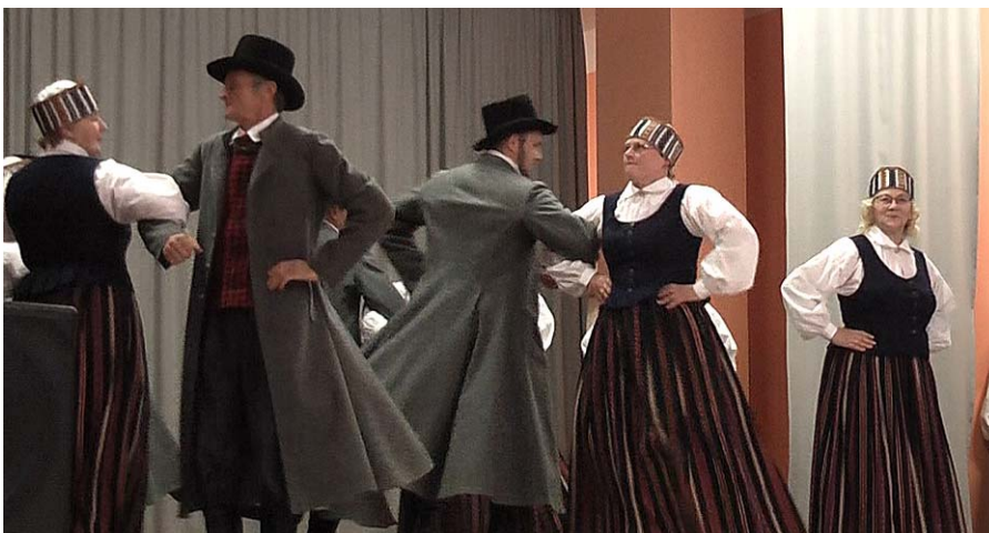
Dejo senioru deju kolektīvs „Mētra”.