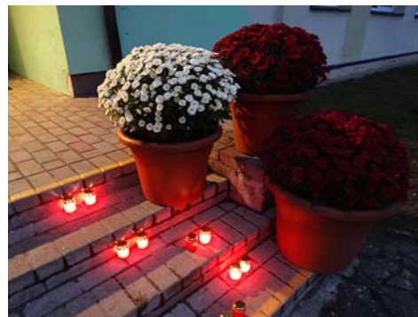
Svētku noformējums pie Mētrienas pamatskolas.