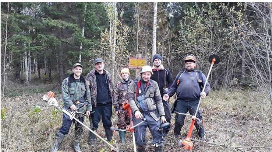
Medību vietas vārnu kājas sagatvošana.