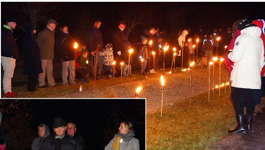
Lāpu gājiens dalībnieki.