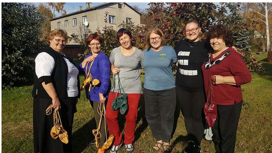
Kopā ar pastalu gatavošanas meistarēm.