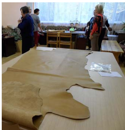
Ādiņas darbam sagatvotas.

Meistarēm līdzī viss nepieciešamais prāvam mācāmo pulkam – naži, šķēres,