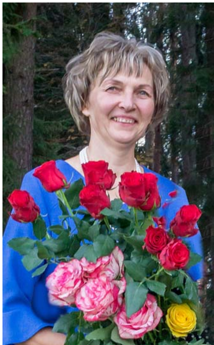
Foto no jubilāres personīgā arhīva