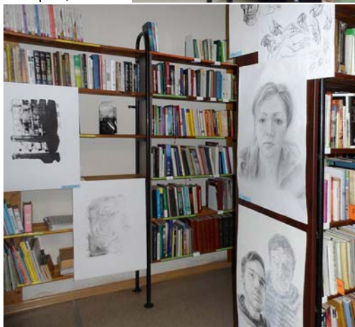
Grāmatu plauktus rotā autoru darbi.