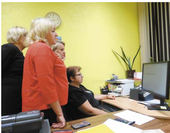
Datorā rūpīgi tiek pārbaudītas balsošanas zīmes.