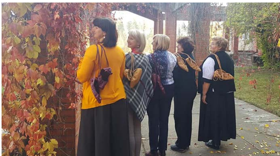
Labs darbs, kas padarīts.

kalti, āmuri, knaibles. Un pats galvenais – dažādu krāsu pastalādas un piegrieztnes vajadzīgo izmēru pēdiņām.