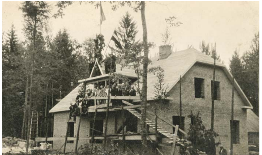
Jaunceltie „Medeņi” Aiviekstes krastā zem jumta.

1944. gada augusta pirmajās dienās vācu karaspēks Saikavas pagastā nopostīja visas Aiviekstes kreisā krasta ēkas, jo tika raktas tranšejas gar upi – tuvojās Sarkanā armija. Uzspridzināja arī nesen uzceltos Medeņus , kuri dega vēl 4. augustā, kad Jāņa Medeņa ģimenei pavēlēja atstāt Praulienas pagasta Trākšus – dzejnieka sievas Almas dzimtās mājas. Visa pamale zvēroja vienās ugunīs, un dzejnieka sirds sažņaudzas – viņš redz Medeņus sagrūstam, un līdz ar māju aiziet bojā arī dzejnieka plašā, ilgi un rūpīgi vāktā bibliotēka.