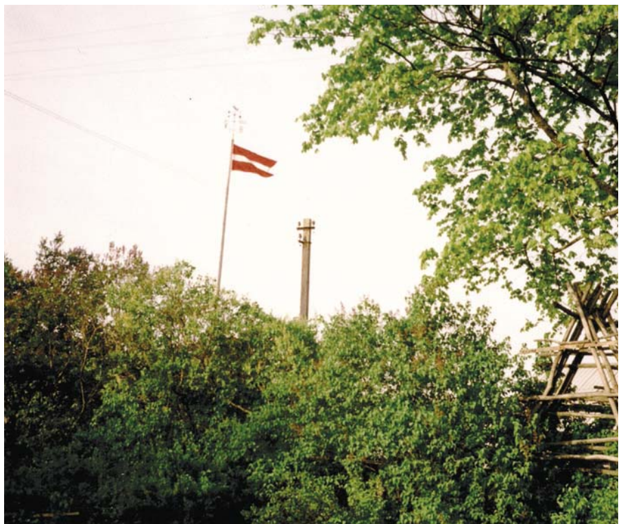
Latvijas karogs lepni plīvo Dreimaņu mājas pagalmā.

„Dreimaņu” Astrīda