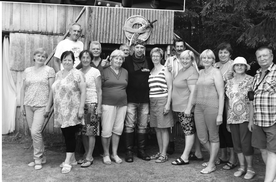
Kopbilde ar pirātiem.