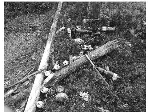
Tādu kāds atstāj mežu.