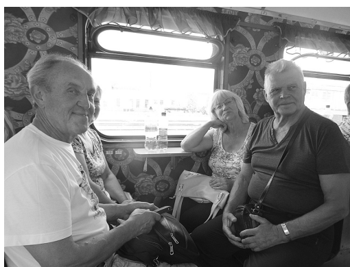
Brauciens var sākties.