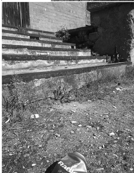
Tā izskatās pie kafējnīcas ēkas.