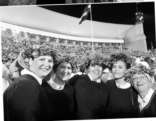
Otrie sporāni pēc noslēguma koncerta.

Sieviešu koris „Jūsma” šogad piekto reizi piedalījās XXVI Vispārējos latviešu Dziesmu svētkos. Mums visām tie bija īpaši, jo tie bija Latvijas 100-gades Dziesmu svētki un man īpaši ar to, ka pirmo reizi piedalījās kā diriģente. Katros dziesmu svētkos noslēguma koncerts Mežaparka estrādē ir savijņojošs, šajā reizē tas bija emociju sprādziens, jo līdz pēdējam brīdim mēs neviens nezinājām visu noslēguma koncerta „Zvaigžņu ceļā” gaitu un bija pārsteigumi, emocijas, savijņojuma brīži arī pašiem dziedātājiem koncerta