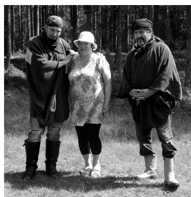
Esam jau nolaupīti.