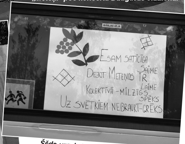
Ššds uzraksts rotāju „Meteņu” autobusu.