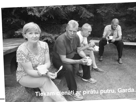
Tiekam cienāti ar pirātu putru. Garda.

oligarhu (viņš ir viens no turīgākajiem apkārtnes saimniekiem), viesiem izstāsta mežabrāļu kustības vēsturi un izrādīta atjaunoto bunkuru, kurā vairāk nekā pirms 60 gadiem mitinājušies vairāki desmiti cilvēku. Tas nu ir skaidrs – mūsu ziemeļu kaimiņi no savas vēstures neslēpjas! Īpaši būtisks šis fakts šķiet tādēļ, ka mežabrāļu kustība aktīva bijusi arī