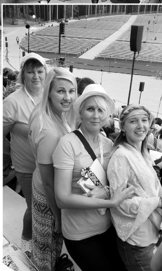
Pirmo altu meitenes.