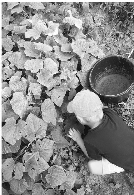
Mihaels novāc gurķus.