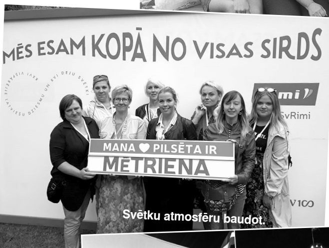
Svētku atmosfēru baudot.