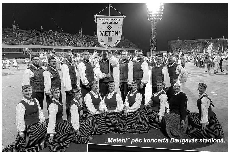
„Meteņi” pēc koncerta Daugavas stadionā.

Gājieni norisinājās 1. jūlijā, kuru ceru, ka daudzi vēroja arī TV ekrānos. Prieks, ka dažiem mūsu pašdarbniekiem līdzjutēji, radnieki un draugi bija ieradusies Rīgā, lai gājieni vērotu arī klātienē, neskatoties uz auksto laiku un stipro vēju, pacietīgi gaidīja gājiena dalībniekus ielu