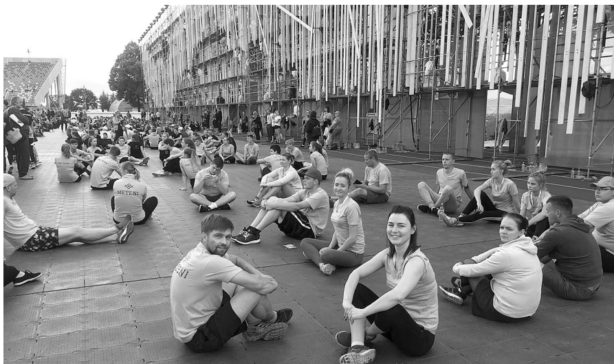
„Meteņi” mēģinājumā Daugavas stadionā.