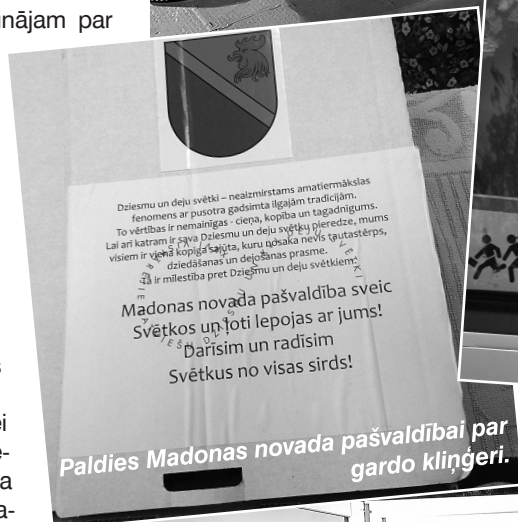
Paldies Madonas novada pašvaldībai par gardo kliņģeri.