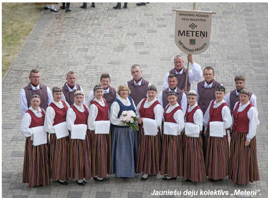
Jauniešu deju kolektīvs „Meteņi”.