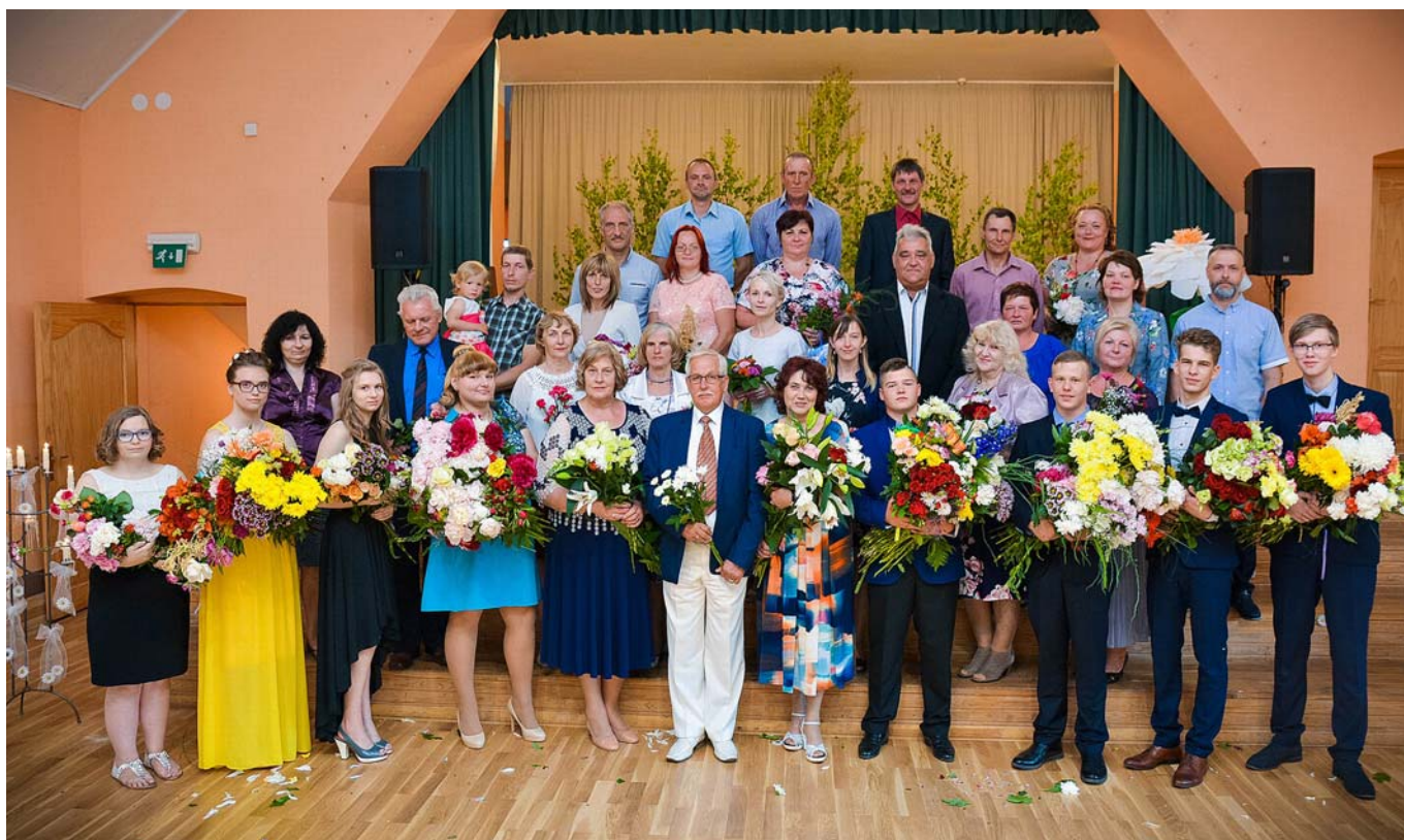
Visi kopā – absolventi, skolotāji, vecāki.