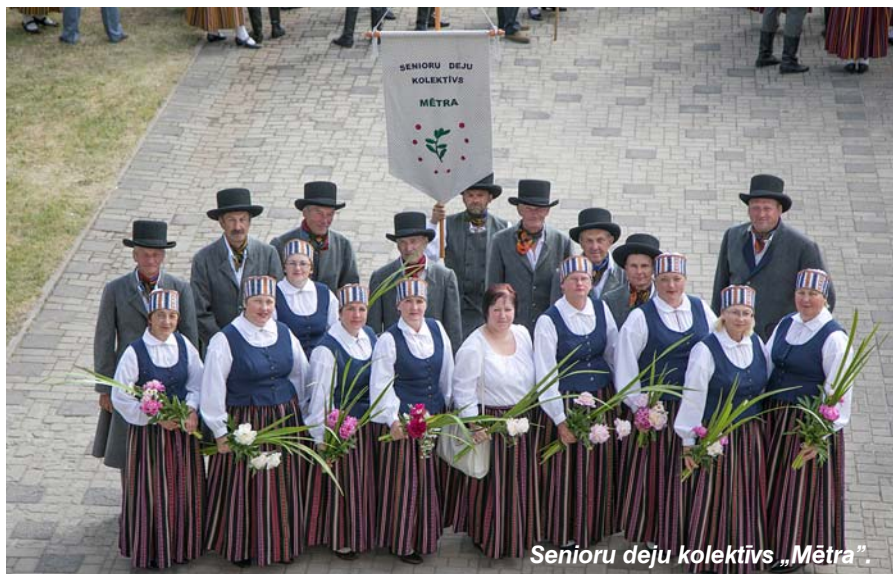
Senioru deju kolektīvs „Mētra”.