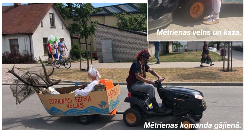
Mētrienas komanda gājienā.