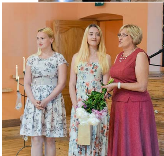
Sveic jauniešu deju kolektīvs „Meteņi”.

pasaulē, aizverot Mētrienas pamatskolas durvis, meklēt savu sapņu zemi, meklēt savu vietu plašajā pasaulē devās astoņi „putnēni”... Lai veiksmīgs lidojums!