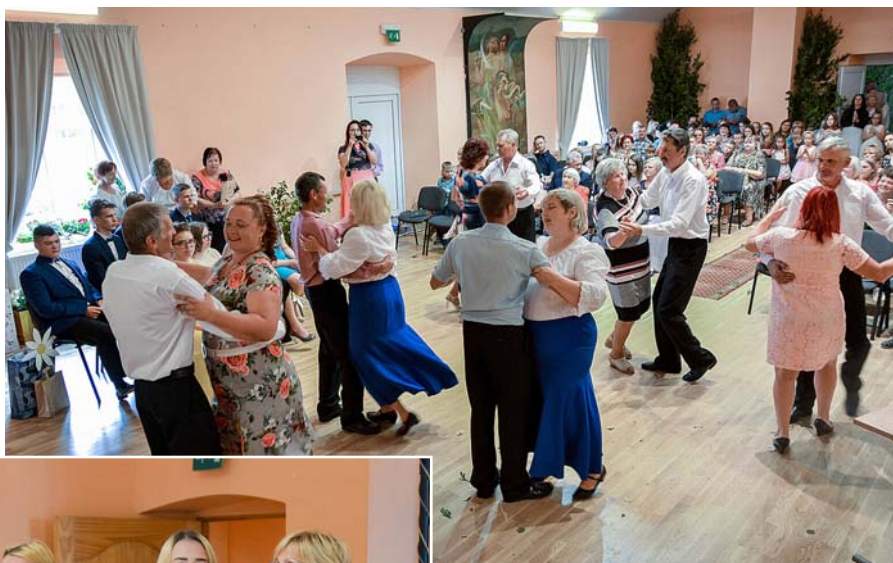
Vecākus dancina SDK „Mētra”.

Vasara zied un reibina ar savām smaržām. Ir Jāņu dienas priekšnojautas... Pasaule ir pilna ar krāsām, smaržām un skaņām. Šogad plašajā