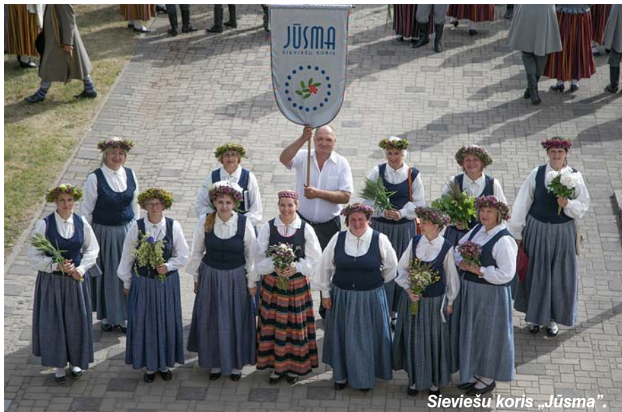
Sieviešu koris „Jūsma”.