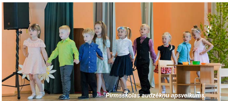
Pirmsskolas audzēkņu apsveikums.