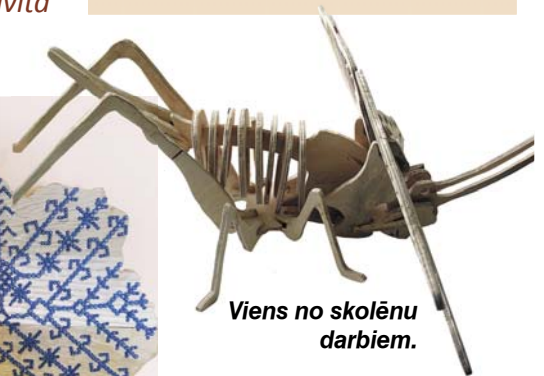
Viens no skolēnu darbiem.

Līdztekus mācību darbam, skolēni aktīvi iesaistījās dažādās aktivitātēs – interešu izglītības pulciņos, konkursos, skatēs, olimpiādēs, sporta sacensībās. turpinājums 2. lpp.