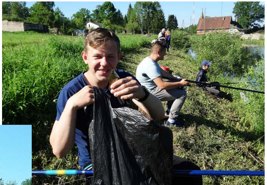
Par lomu priecājas Ričards Srogovs.