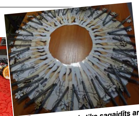
Katrs viesis tika sagaidīts ar pašdarinātu grāmatzīmi un pildspalvu.