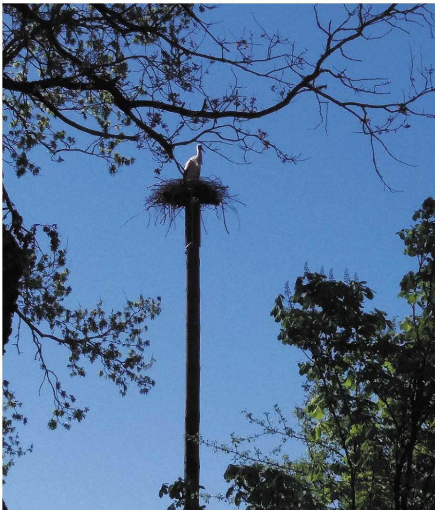
Lauras Bīķernieces teksts un foto

Par jauno mitekli sākās īsta stārķu gaisa kauja, kurās iesaistījās deviņi putni. Tāds skats līdz šim Mētrienā nebija novērots. Tā pēc divu dienu cīņām, rezultātā mājvietu ieņēma uzvarētāj pāris, kurš pašreiz perē mazuļus.