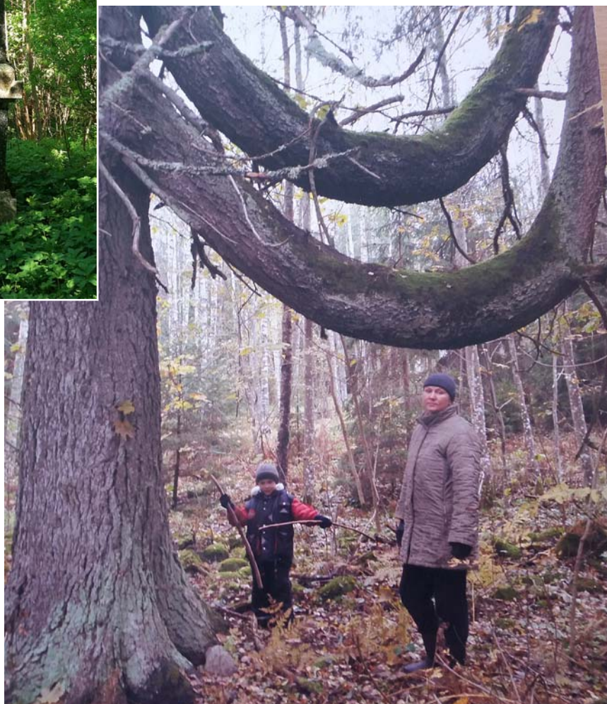
Geidas meita un mazdēls. Deviņdesmitie gadi.