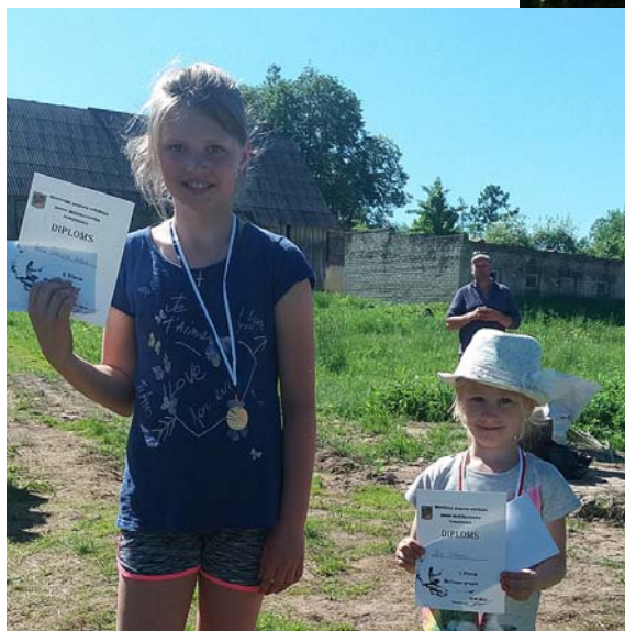
Uzvarētājas meiteņu grupā.