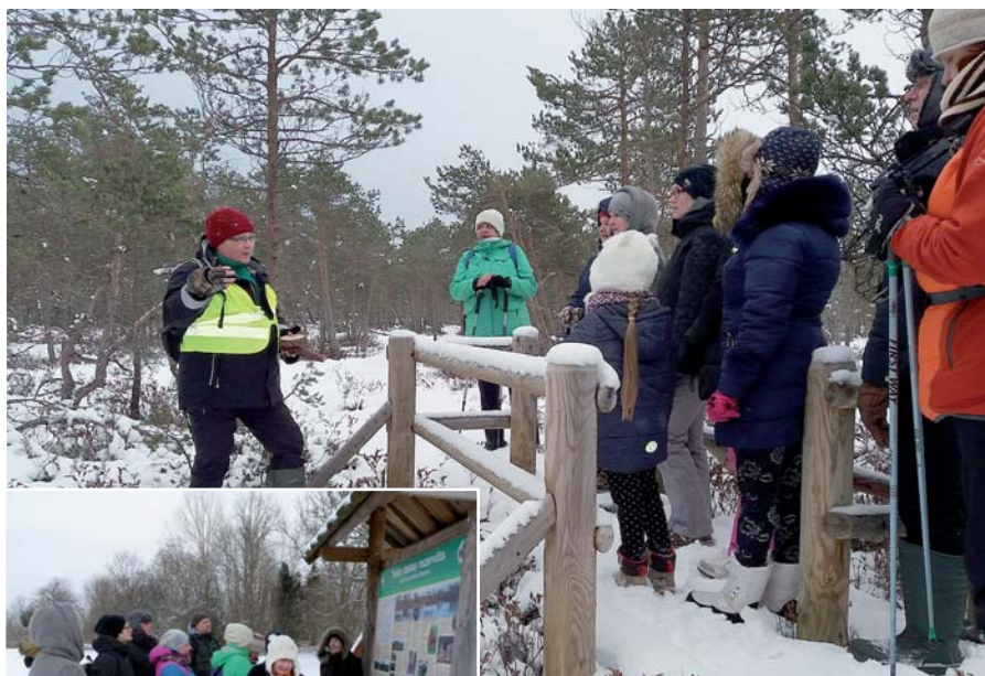
Stāsta R. Indriķe.