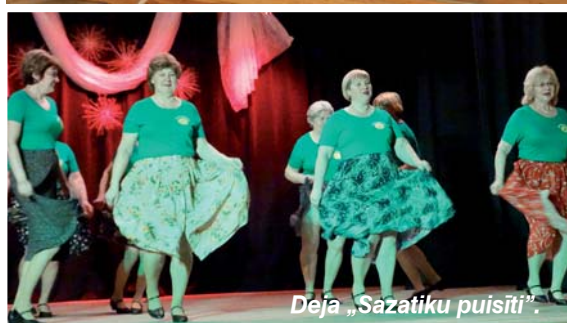
Deja „Sazatiku puisīti”.