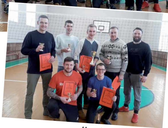
Uzvarētāji – Ramatas vīri.