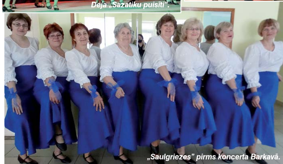
„Saulgriezes” pirms koncerta Barkavā.