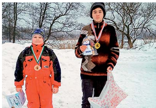
Jauniešu grupas uzvarētāji.