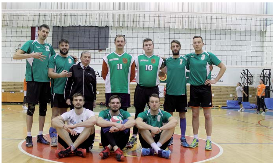
Mētrienas vīriešu volejbola komanda pēc čempionāta fināla.

Finālspēlē starp MADNO un „Logu maiņas” komandām pārāki bija MADNO