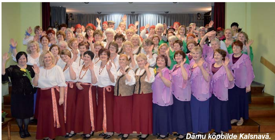
Dāmu kopilde Kalsnavā.

Solvīta Stulpiņa Foto no kolektīvu personīgajiem arhīviem