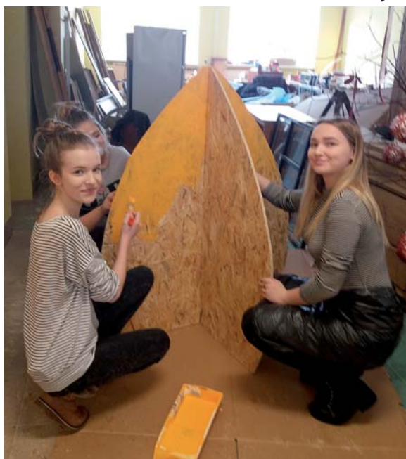
Top Lieldienu dekors.

Tā kā tuvojas Lieldienas, veicām sagatavoto pagasta dekorāciju krāsošanu. Šogad Lieldienu zaķiem pievienosies arī krāšņas olas gan pie pagastmājas, gan