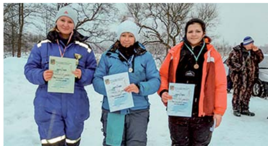
Uzvarētājas dāmu grupā.