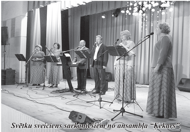
Svētku sveiciens sarkanlešiem no ansambļa “Ķekars”.

29. decembrī uz tradicionālo gadumijas pasākumu pulcējās pagasta seniori. Atpūtas brīdī viņus priecēja tradīciju ansamblis “Ķekars” no Aronas pagasta. Īpašs sveiciens senioriem bija no mazajiem dejotājiem. Sarīkojumu deju priekšnesumi “Andra deju skolas” audzēkņu izpildījumā vienaldzīgu neatstāja