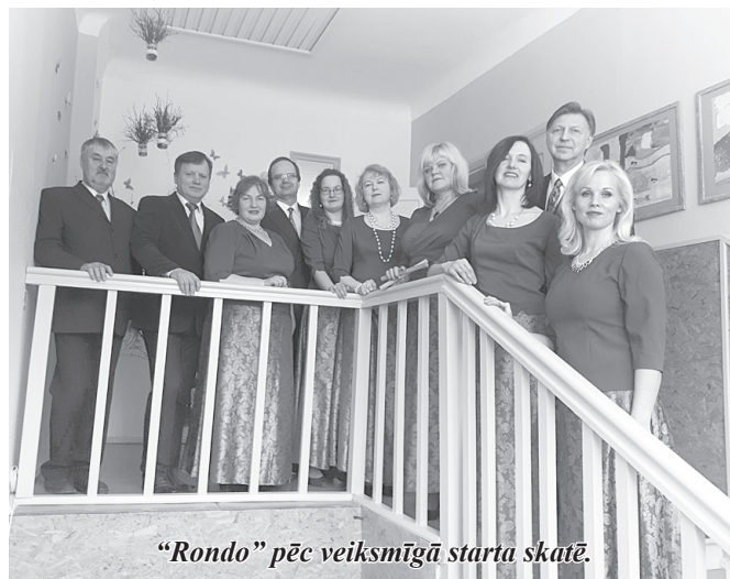
“Rondo” pēc veiksmīgā starta skatē.

18. martā jauktais vokālais ansamblis “Rondo” piedalījās Latvijas vokālo ansambļu 2018. gada konkursa II kārtā, kas notika Mazsalacā. Mūsu dziedātāju sniegums bija ļoti skaņīgs, ko profesionālā žūrija novērtēja ļoti labi, veltot atzinīgus vār- dus, par ko liecina iegūtais I pakāpes diploms ar 40,50 punk- tiem.