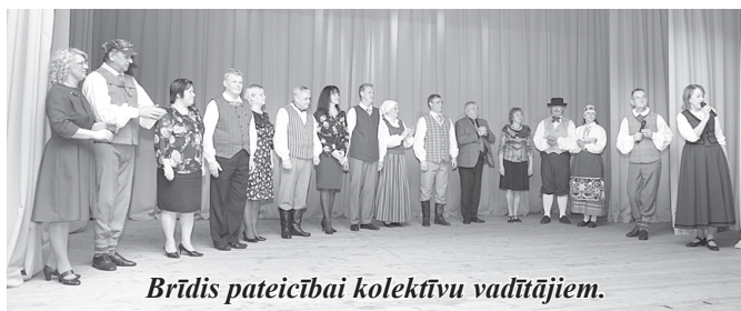
Brīdis pateicībai kolektīvu vadītājiem.

nes, deju kolektīvs “Kūmas” no Viļāniem un deju kolektīvs no Igaunijas.