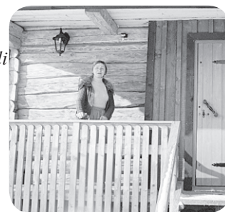
Sirsnīgs sveiciens skaistajā dzīves jubilejā!

Pieskaries zilajam Debesu jumam Ar domām, ar dvēseli Tā, lai to jūti. Lai katru dienu, Nodzīvot nebūtu Ne viegli, ne grūti- Lai sirdī laimi gūsti. Lai katrs mirklis Gaismas piepildīts, Mīlestībā ieskauts Un sasildīts!