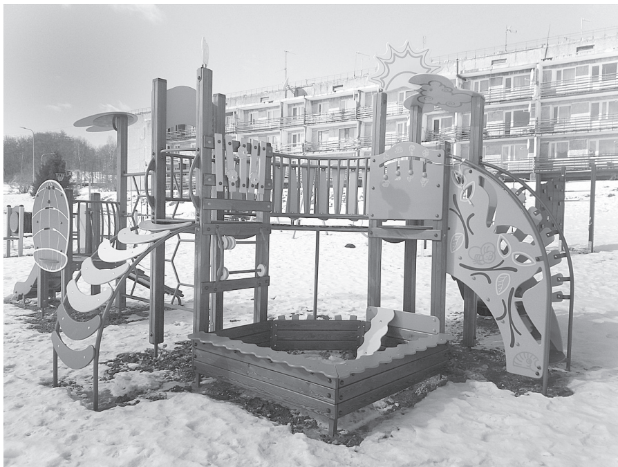
Nobeiguma darbiem piemērotus laika apstākļus gaida rotaļu laukums Biksērē.