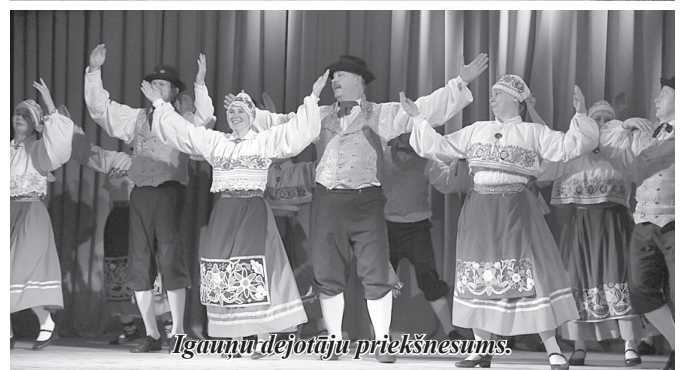
Igaunijā dejotāju priekšnesums.