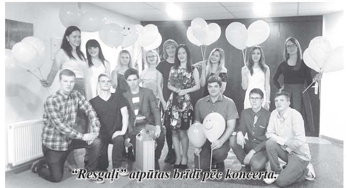
“Resgaļi” atpūtas brīdī pēc koncerta.