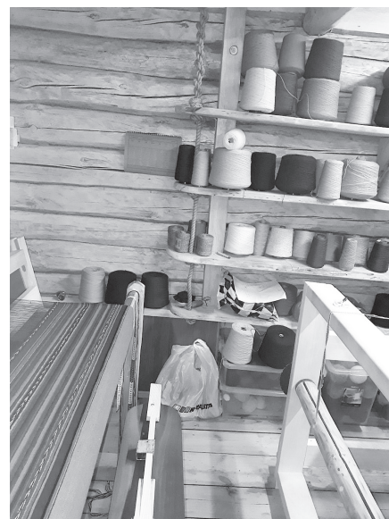
Krāsaino dzīparu pasaule.

Dzīvojam brīnišķīgā un dabas veidotā gleznainā vietā, kur līdzenumi mijas ar kalnaino apvidu. Jau šobrīd Biksērē iegriežas tuvāki un tālāki ceļotāji. Muižas parks ar skulptūrām, senlietu muzejs, skatu laukums, muzejs “Jaundilmaņi”, avotiņš – tas viss mums ir. To atliek tikai papildināt ar piedāvājumu, kas būtu saistošs interesentiem, un visu popularizēt. Sarkaņu vecās skolas ēkas un