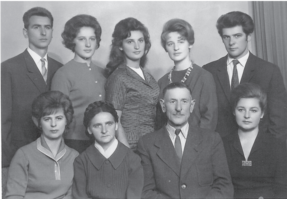
Pētera un Genovefas septiņi bērni beiguši Sarkanu pamatskolu.