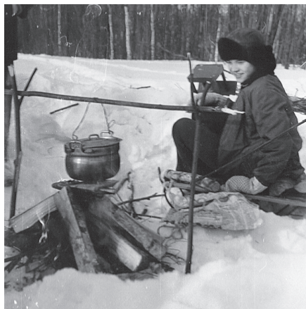
Tēja drīz būs gatava.

Pie ugunsкура Laimonis uzaicina vispirms ēst vecmāmiņas cepto maizi – viņa līdzī iedevusi veselu kukuli un sviestu burciņā arī.