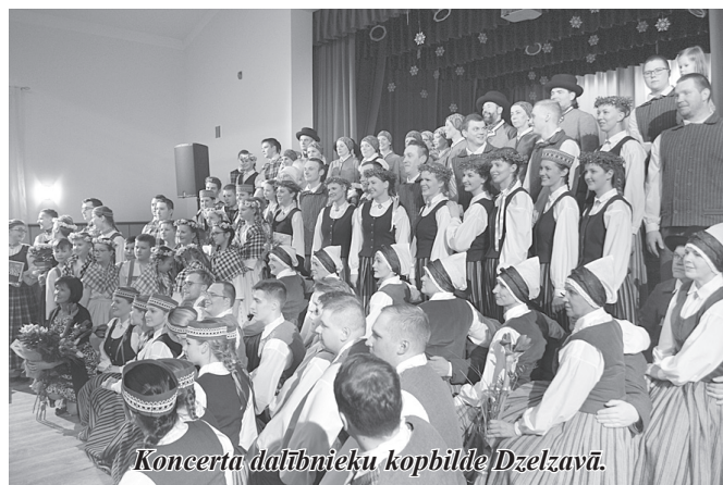
Koncerta dalībnieku kopbilde Dzelzavā.

kolektīvu sadancī kopā ar deju kolektīviem no Madonas un Gulbenes novada.