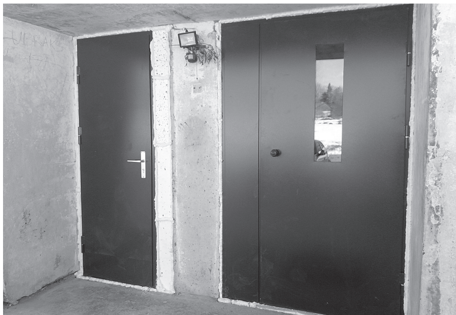
J. Ramaņa ielā 13 kāpņu telpās ārdurvis nomainītas par mājas iedzīvotāju uzkrātajiem līdzekļiem apsaimniekošanas periodā, kas uzsākta kas uzsākta 2015. gadā