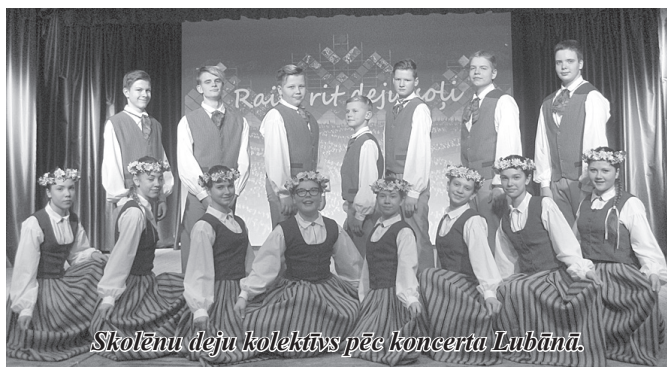
Skolēnu deju kolektīvs pēc koncerta Lubānā.

23. februārī skolēnu deju kolektīvs piedalījās deju kolektīvu sadancī Lubānā.