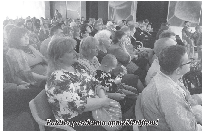
Paldies pasākuma apmeklētājiem!