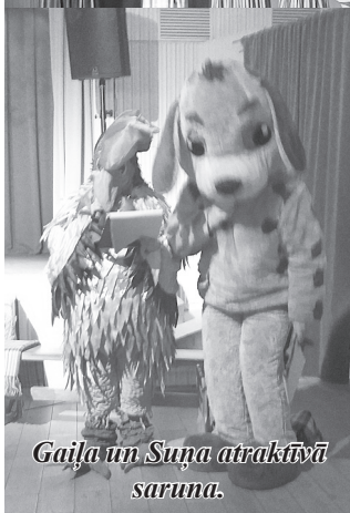
Gailis un Sunis atraktīvā saruna.