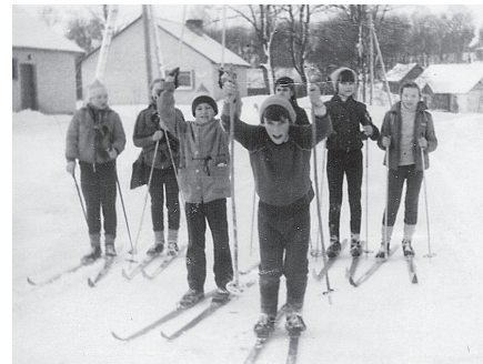
Ceļa pirmais posms veikts godam.