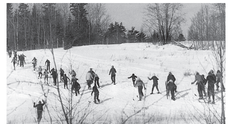
Komandas dodas uz starta vietu.