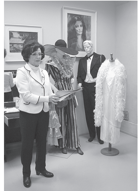
Aktrise ar muzejam dāvināto lugas eksemplāru novadnieku ekspozīcijā Sarkanos.

"To svētsvinīgo plašumu un lauku atmosfēru ar milzu sapņiem. Ganos ejot, manas bērna ilgās milza un milza. Mežā uzrunāju katru koku. Dziedāju un deklamēju. Tie bija mana klusā, bet gudrā publika. Re, kā tas aktrises aizsāknis laikam uzradies jau tais laikos! Kaut kas pie lielām mākslām tomēr vilka. Tēvs visu mūžu klarneti nospēlēja, tecīņus vien gājām uz kora sadziedāšanu savā Sarkanu pagastā." (No O. Dreģes monologa pirms 50. jubilejas "Dievs ieliek to sev kabatā".)