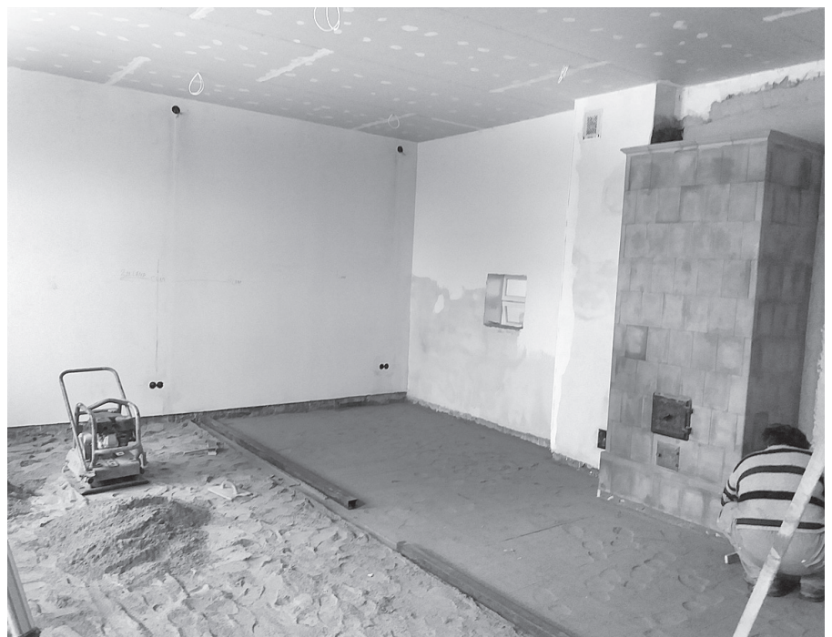
Remontdarbi bijušajā Sarkaņu skolas ēdamzālē.

Šķeldas šķūnī novietotais lentzāģis pieder man un tika darbināts, lai sazāģētu baļķus, ko ieguvām, tīrot parka teritoriju no izgāztajiem un nokaltušajiem kokiem. Sazāģēti apmēram 12 m 3 baļķu un kā zāģmateriālu iznākums 5,77 m 3 par aptuveno vērtību 800,00 eiro. Patē-