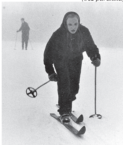
Sacensībās 1960. gada 27. janvārī.

Ieraksts vienības hronikā (bez paraksta)