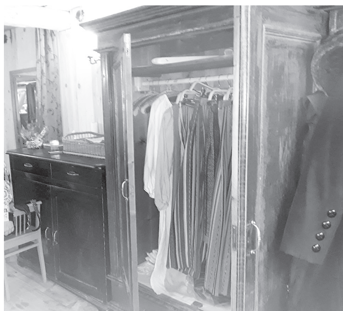
Mājīgā un noslēpumainā atmosfēra klētiņā.

Pieskaries zilajam Debesu jumam Ar domām, ar dvēseli Tā, lai to jūti. Lai katru dienu, Nodzīvot nebūtu Ne viegli, ne grūti- Lai sirdī laimi gūsti. Lai katrs mirklis Gaismas piepildīts, Mīlestībā ieskauts Un sasildīts!