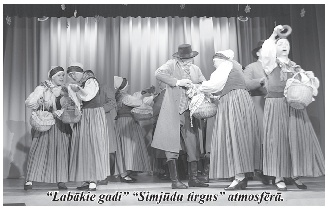
“Labākie gadi” “Simjūdu tirgus” atmosfērā.