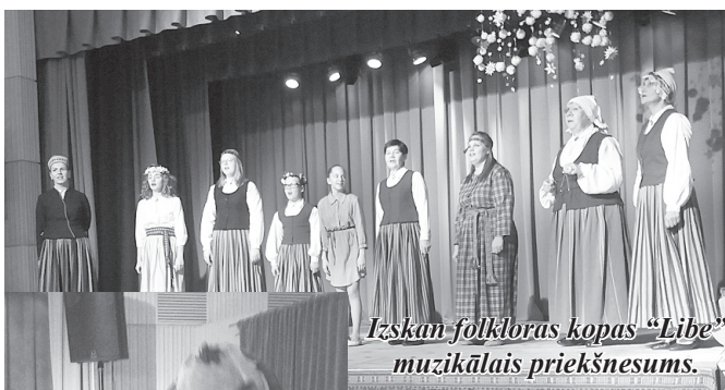
Izskan folkloras kopas “Libe” muzikālais priekšnesums.

6. janvārī uz gadumijas pasākumu pulcējās pagasta amatiermākslas kolektīvi, kas vienojās kopējā koncertā “Uz ga-