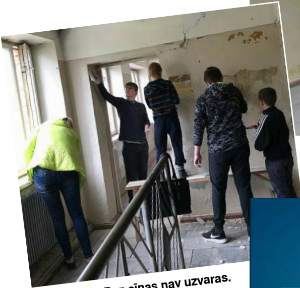
Bez ciņas nav uzvaras.

lamies redzēt un, protams, arī strādājām. Tika noņemta vecā krāsa, kas dažviet pati krita nost, bet citviet bija jāpacinās. Kad visas čaklās rokas bija ķērušās pie darba, tas ļoti raiti gāja uz priekšu. Putekļus sacelām ne pa jokam, tāda sajūta, ka sākam modināt aizsnaudušos telpu, kas agrāk bija apmeklēts un darbīgs dispičeru kabinets, bet uz brīdi sastindzis. Tagad tas pārdzimst.