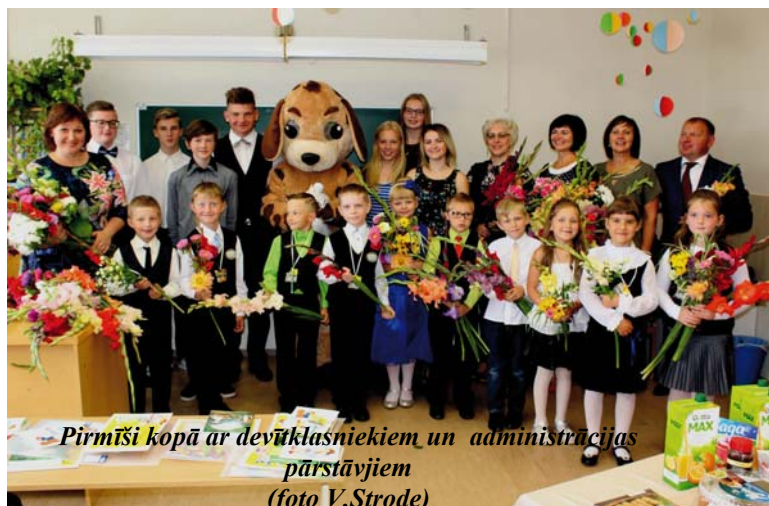
Pirmīši kopā ar devītklasniekiem un administrācijas pārstāvjiem