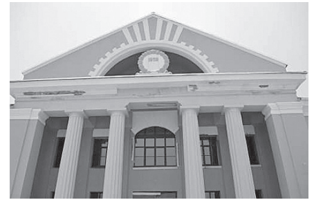
Sedas kultūras nams.

Lugaži bijusi ordeņa vasaļa pils. Pirmo reizi tā dokumentos minēta 1431. gadā, kad