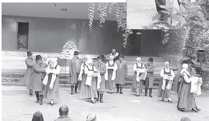
Dejo “Labākie gadi”.