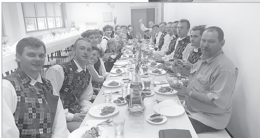
Mirkļi no brīnišķīgās kopā būšanas koncertos un atpūtas brīžos.