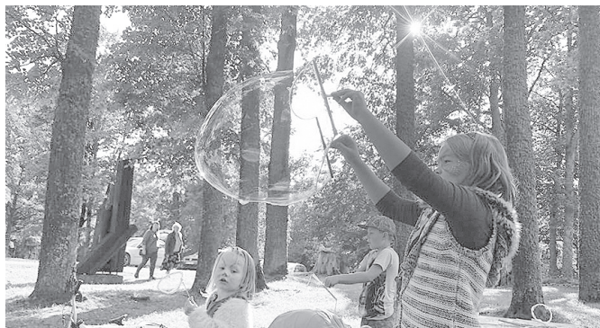
Ar burbuļiem rotaļājoties.