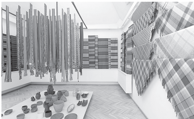
Skaistie un daudzveidīgie darinājumi.

Dziesmu un deju svētku starplaika pasākums.