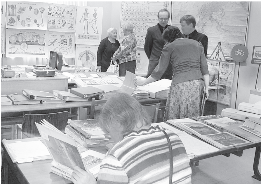
Izstādē “No Sarkaņu skolas vēstures”.