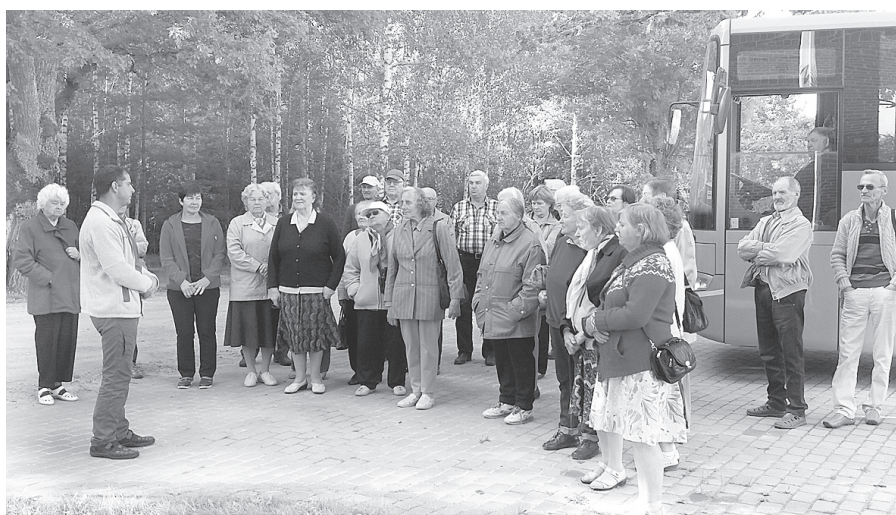
Ekskursanti pie Vijiema čiekurkaltes.