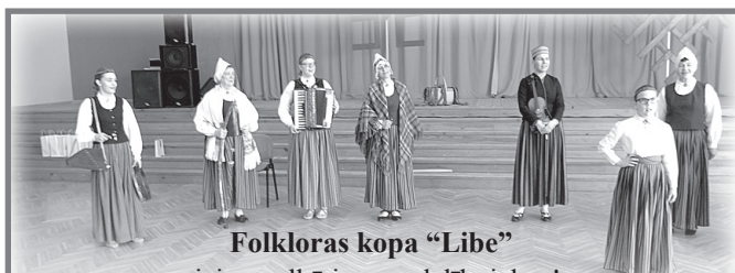
Folkloras kopa “Libe”

Valdas K. teksts