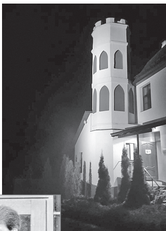
“Gaismu nakts” Biksēres muižā.

26. augustā Biksēres muižas parkā notika pasākums “Atvadas vasarai Biksēres muižā”. Apmeklētājiem atvērta bija senlietu muzejs “Biksēres klēts”. Klēts pagrabos bija apskatāmi pagasta čaklo rokdarbnieču dažādās tehnikās darinātie lakati un interesenti varēja iepazīties ar vēstures materiāliem par pagasta mājām. Aktīvākie savus spēkus varēja izmēģināt labirintorientēšanās laukumā