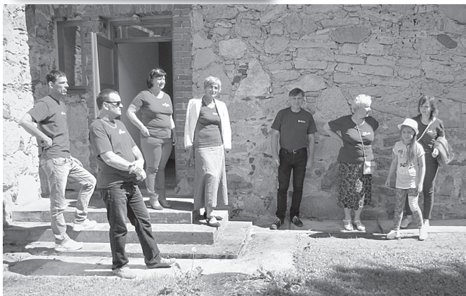
"Piņģerots" pirms un pēc izrādes.