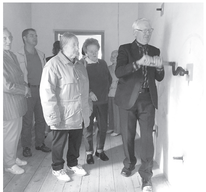
Darbu čiekurkaltē iemēģinot.