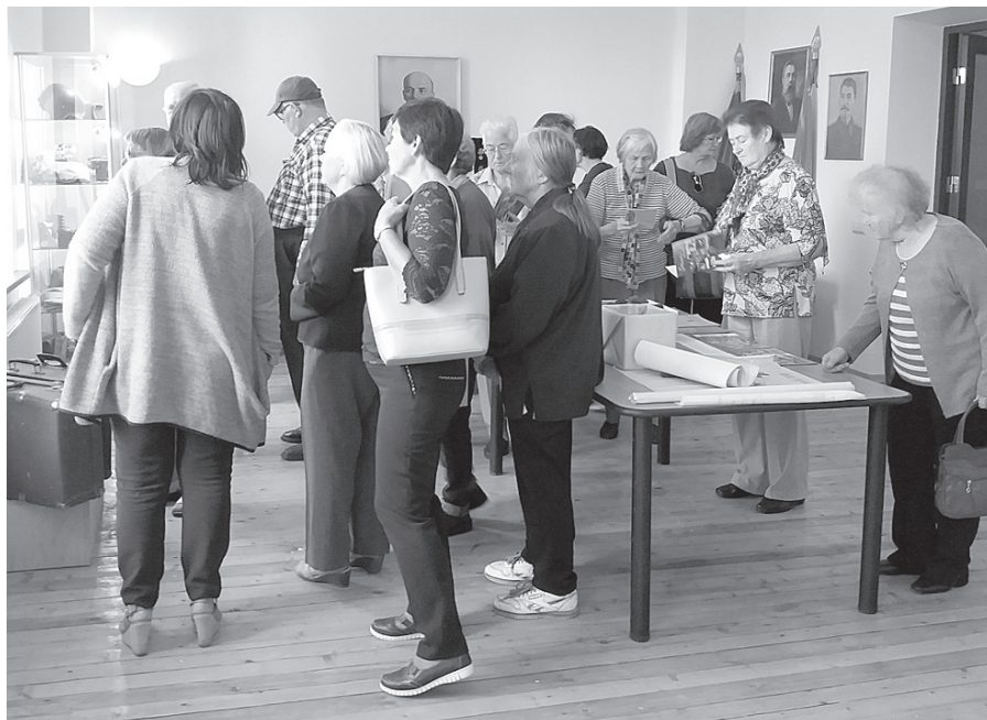
Sedas vēsturi iepazīstot.