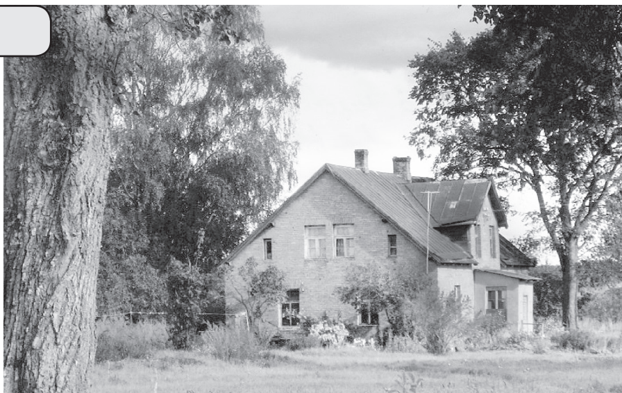
Saulaines pamatskolas ēka 2015. gadā.