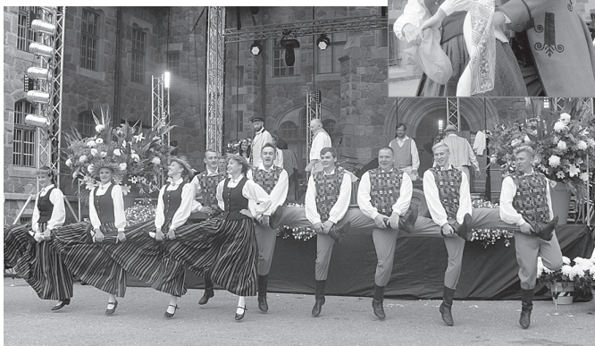
"Kalnagravu" deju kolektīva sniegums Cesvaines pils pagalmā – pārliecinošs un teatrāls.

29. jūlijā , Cesvainas novada svētkos, muzikālo dziesmu spēli "Īsa pamācība mīlēšanā" ar saviem priekšnesumiem kuplināja deju kolektīvs "Kalnagravas".