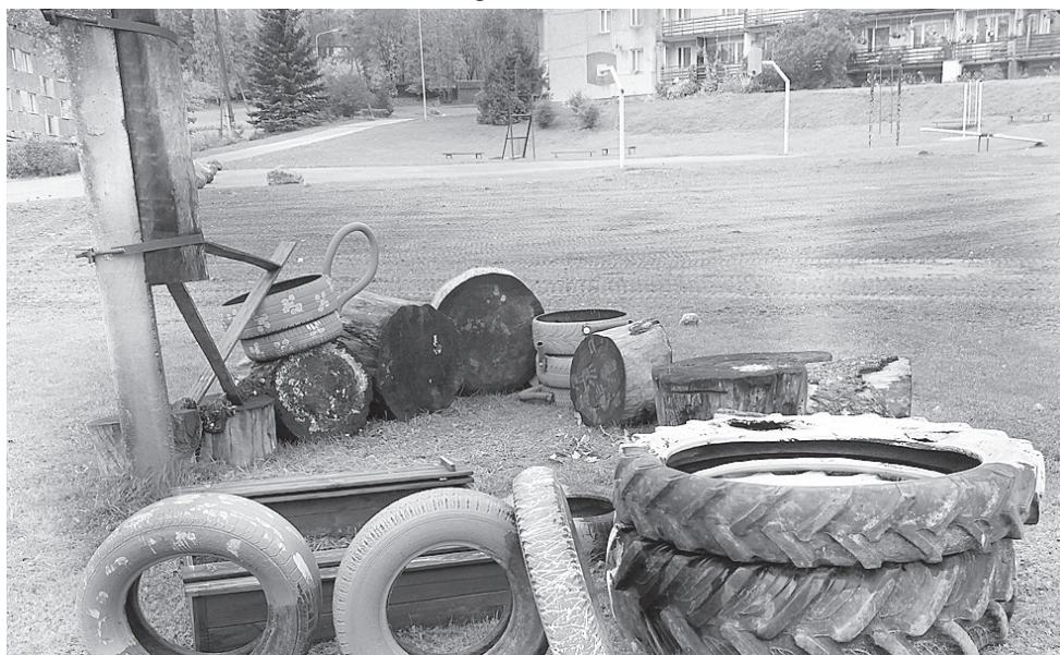
Pavisam drīz šeit izskatīsies savādāk.