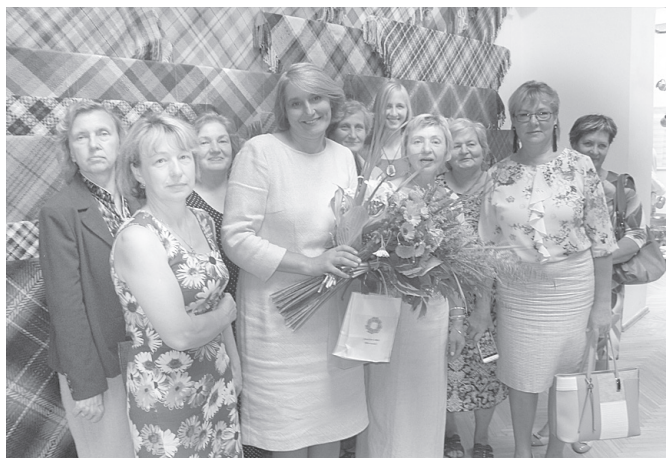
Sarkaņu audējas pie Dairas austā lakata.

Latvijas novadu tautas lietišķās mākslas izstāde ir Vispārējo