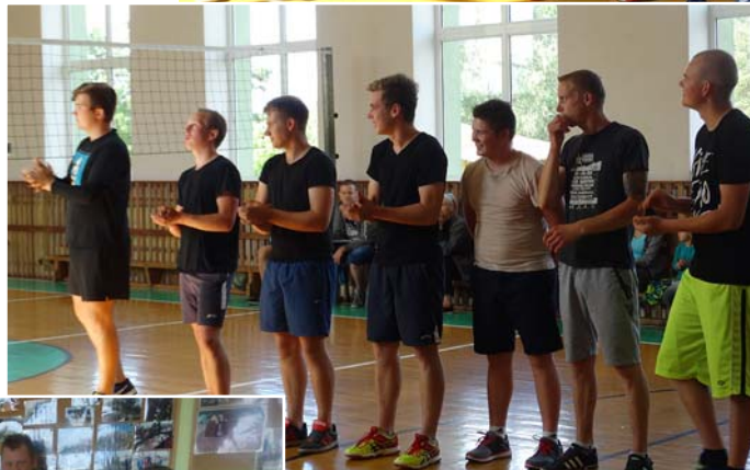
Varenī cīnījās arī jaunie Mētrienas volejbolisti.