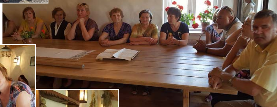
Mētrienieši un draugi maizes muzejā.