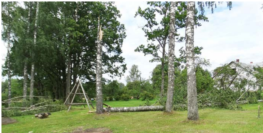
Vairāki bērzi tika izgāzti centra birzītē.

daudz. Tikko šādi nospriežam, tā uzreiz tik briesmīgs spēriens... Man pa roku tīrības līdz plecām, uguns noplaiksniņa pa galdu, kontaktiem, lampiņas plīsa, elektrības korķi izsisti... Leduskapis atslēgts. Palika man pašai tik slikti, ka neko rokā saņemt. Likās, ka tūkstoš adatiņas bada. Līdz diviem pēcpusdienā novārtījos pa gultu, dzēru sirds zāles, roku rīvēju ar gēlu. Ieslēdzu elektrības korķus atpakaļ, bet elektrības nav. Gāju ārā skatīties pie skaitītāja. Arī tur viss atslēdzies. Telefons klusē kā partizāns , nevaru dēlu sazvanīt, lai apsveiktu vārda dienā. Tad parādījās bērni raudzīt, kas noticis, jo neesot sazvānāma. Viņi telefonu dabūja pie dzīvības . Pēc divām dienām nolēmu padalīot apkārtni ar savu zāles plāvēju. Plāuji un brīnos, kurš piemētājis malkas pagales pa zāli?! Tad tikai ieraudzīju, ka sasperts lielais ozols, kuram cieši blakus iet elektrības kabelis... Bet rokai gan vainīgs te-