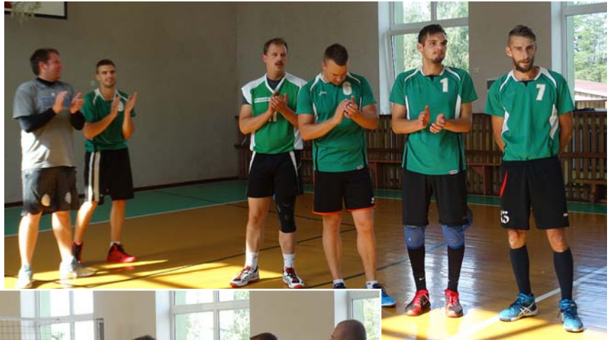
Mētrienas volejbola komanda izcīnīja 1. vietu.

Gandrīz vai visu vasaru turpinājās Madonas pilsētas atklātais čempionāts pludmales volejbolā. Izspēlēja piecas kārtas, kurās divi mētrieniešu pāri ieņēma no pirmās līdz deviņtajai vietai 17 komandu konkurencē. Finālspeles notika 10. augustā. Divpadsmit