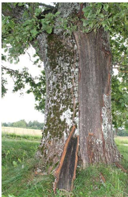
Ozolā pie Dreimaņu mājām iespēra zibens.