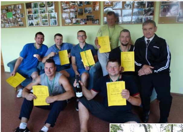
2. vietas ieguvēji – Atašienes volejbolisti.