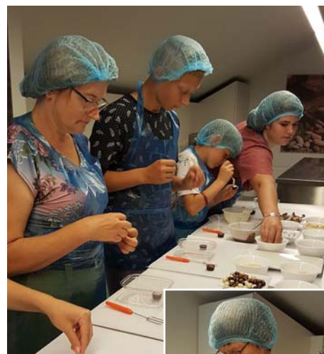
Gatavojam šokolādes našķus.