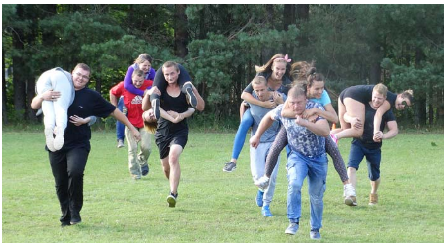
Dāmu nešanas sacensības.

valsts trīsdesmitajiem gadiem. Pirmo vietu komandām izcīnīja Mētrienas spēlētāji. Grūti bija pārējām komandām stāties pretī titulētajiem Mētrienas sportistiem, kuri pārstāv gan pirmo, gan otro Latvijas volejbola