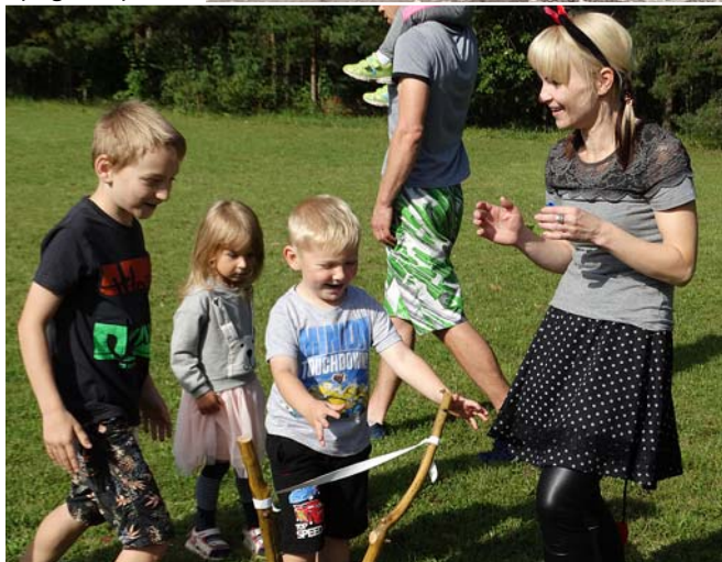
Sporta laukumā notika spēles mazajiem.