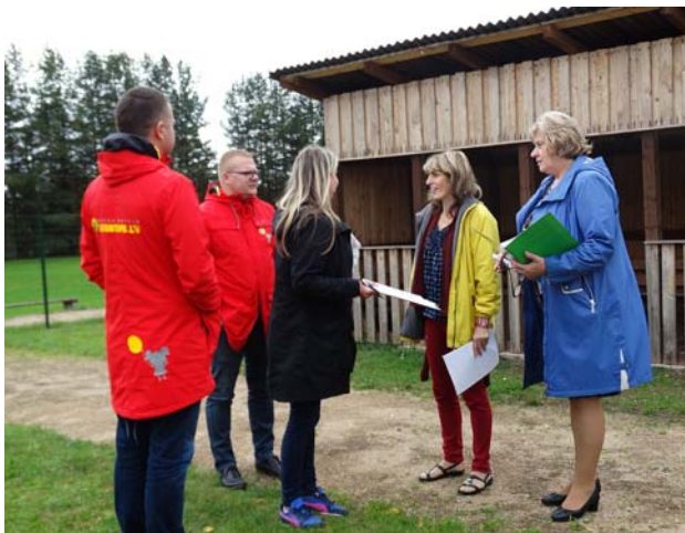
Jaunā rotaļu laukuma vietas apskate.