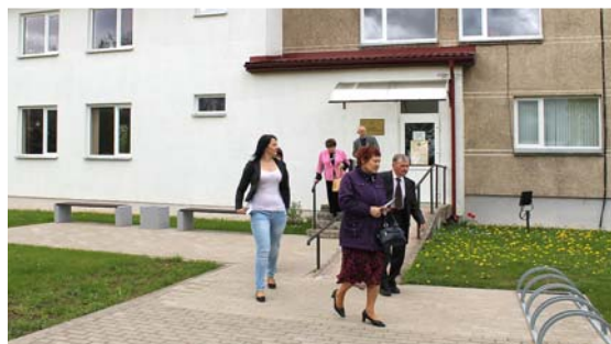
Apmeklējām Liezēres pašvaldību.