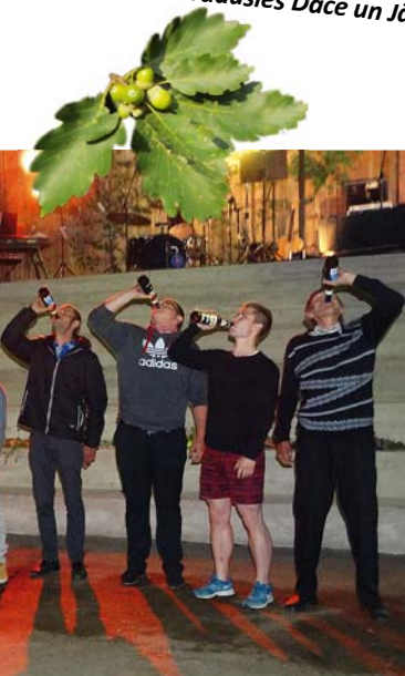
Alus dzeršanas sacensības.