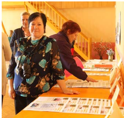
Iekārtojām pagastu avīžu izstādīti.