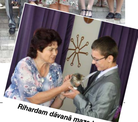
Rihardam dāvanā mazs kaķītis.