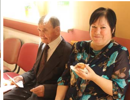
Ciemiņus laipni uzņēma ar gardu cienastu.