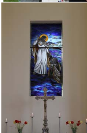
Skaistā altāra vitrāža, ko veidojusi Liezēres vietējā māksliniece.