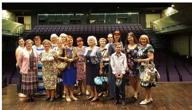
Uz Latgales vēstniecības GORS lielās skatuves.