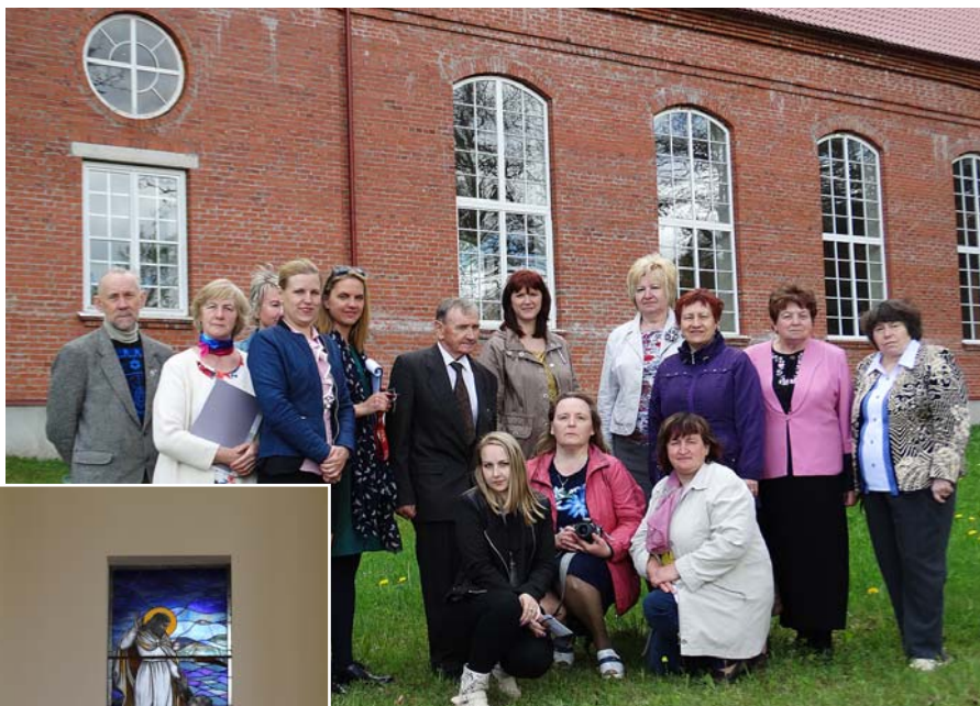
Avīžu veidotāju kopbilde pie Liezēres baznīcas.

Solvitas Stulpiņas teksts