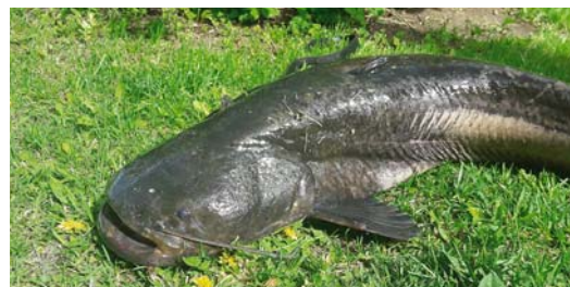
Ilgoņa Mālnieka sams.