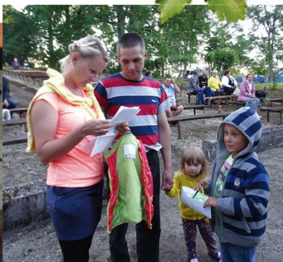
Orientēšanās sacensību uzdevumu saņēmusi Mutoru ģimene.