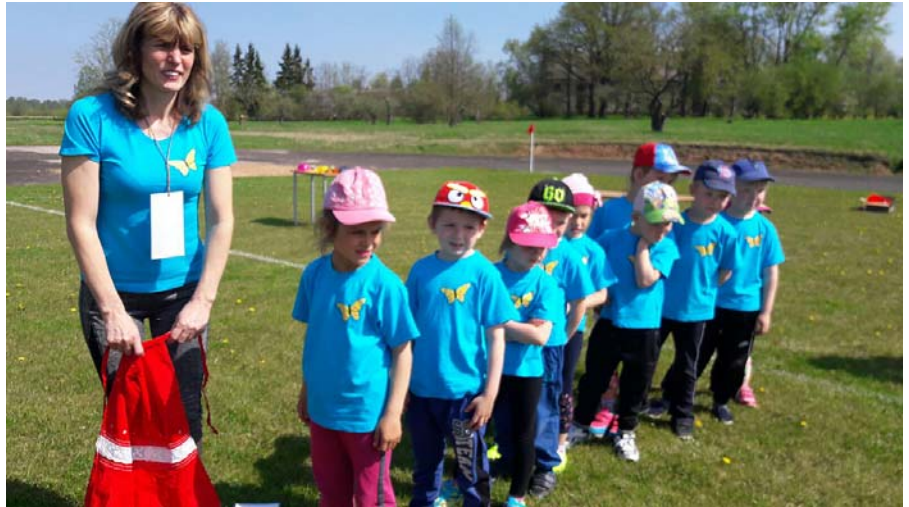
Mazie mētrieniņi startam gatavi!

Aktivitātes sporta pilsētās turpinājās skolas sporta laukumā. Pavāri pārliecinājās, vai bērni atpazīst dažādas lietas no virtuves. Celtniekiem mums nācās pierādīt, ka visi komandā spējam uzcelt sapņu pili. Stafetē izbaudījām, cik grūti reizēm var būt pastniekam.