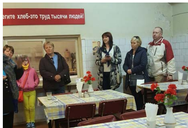
Ēdnīca, kurā joprojām ir iespēja paēst pusdienas (piesakot apmeklējumu) – pelmeņus, pankūkas, tēju.