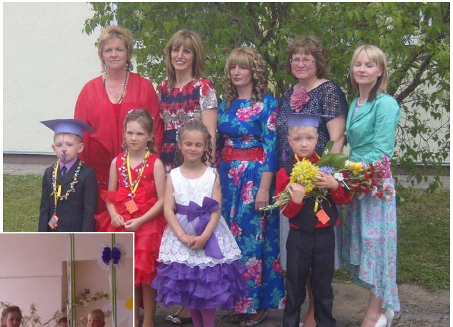
Nākošie pirmklasnieki kopā ar audzinātājām.