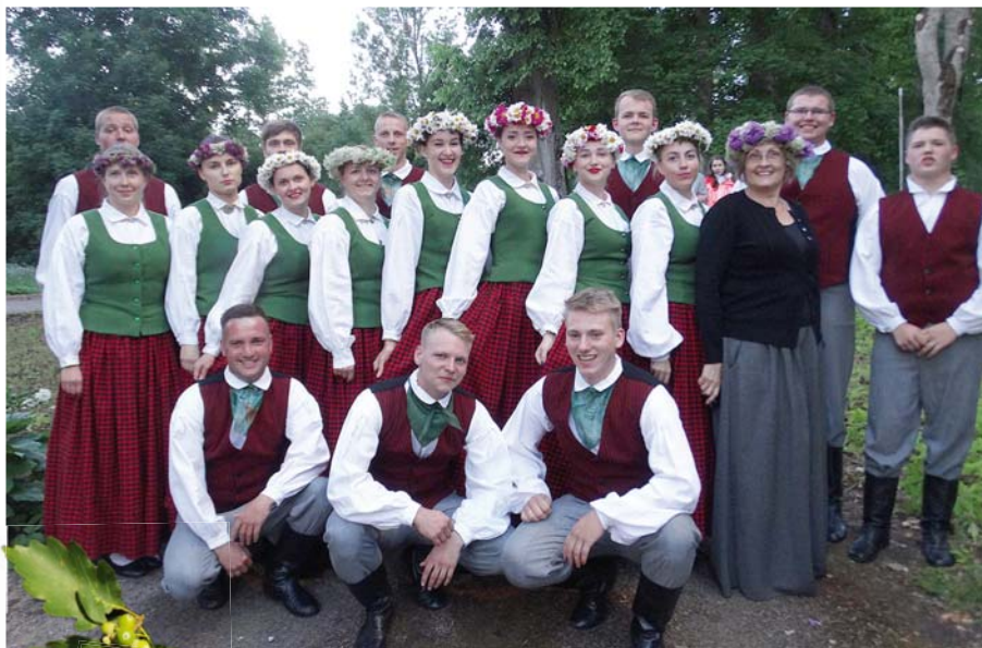
Deju kolektīvs „Meteņi +”.