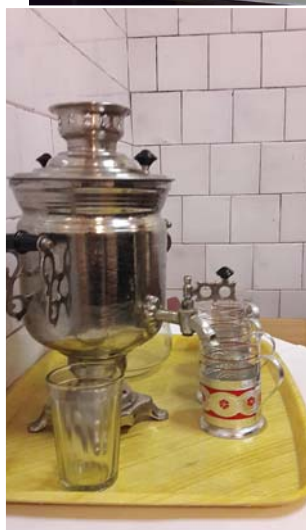
Tipisks Padomju laika patvāris.