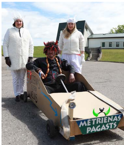
Odzianas velns ar savām kaziņām.