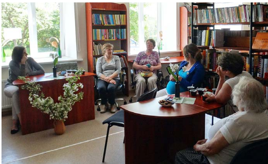
Un stāsti var sākties.

Pasākumā valdīja ļoti silta gaisotne. Visi klātesošie savstarpēji iepazīnās, un