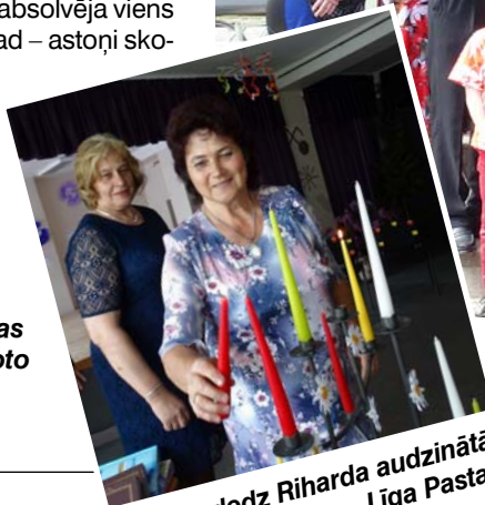
Skolotāju, draugu un ģimenes pulciņā.