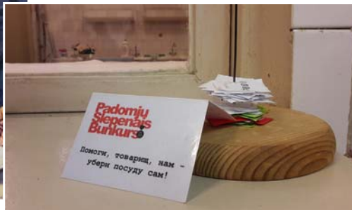
Labi, ka taloniņu laiki garām...