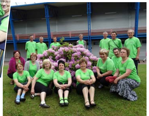
Skaisto rododendru iekļauti

Paldies dejotājiem par izturību un raito dejas soli. Paldies pagasta pārvaldei par finansiālu atbalstu. Paldies šoferītim