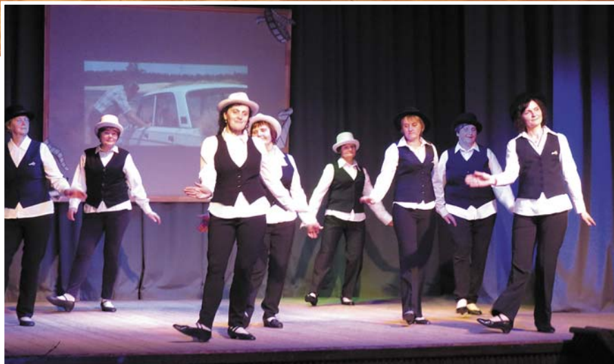
„Orhidejas” deju deju „Letkiss” no k/f „Ezera sonāte”.

Tu ēd savu zupu un nemuldi tik daudz! („Tās dullās Paulīnes dēļ”), Ērik, uznes mani kalnā, Še tev Mirttantel!, Kretīns