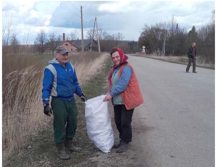
Ošupes iedzīvotāju apkārtnes sakopšanas darbi.