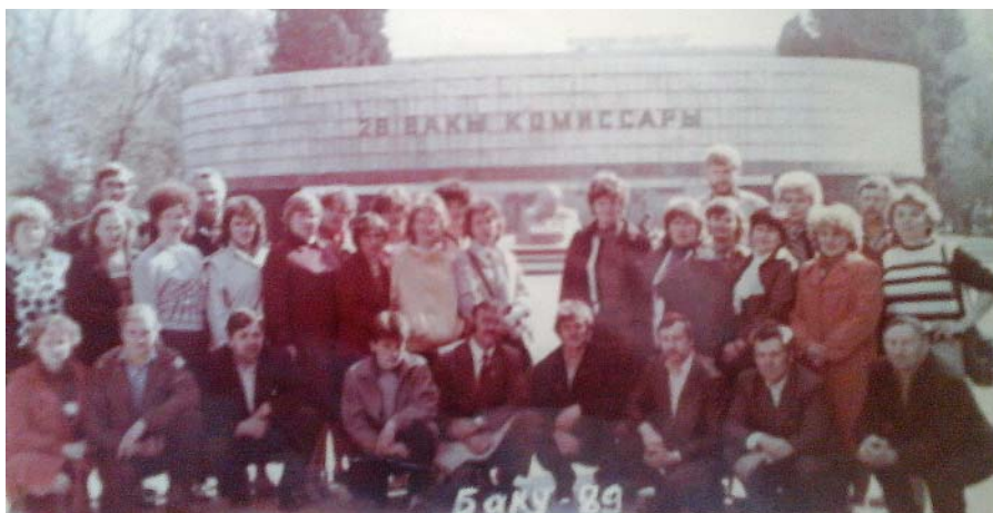
Mirklis no skaistās, tālās ekskursijas.