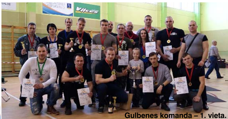
Gulbenes komanda – 1. vieta.

Jā, šis pasākums norisinājās pie mums pirmo reizi, ceram, ka tā būs tradīcija. Madonas novada Degumnieku čempionātu klasiskajā spiešanā guļus