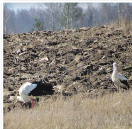
Švīti meklē pusdienas.