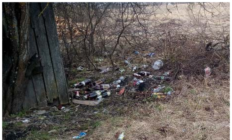
Darbs, kas vēl gaida savus darītājus Degumniekos, celtnieku ielā.

Tuvojas Lielās Talkas datums. Pagājis gandrīz gads, kā talkotāji čakli vāca ziemas laikā sakrājušos gružus pie savām mājām, čakli talkoja pie Lubāna ezera, skolēni vāca atkritumu pa Degumnieku ciemata attālākajām ceļmalām, Ošupes ciemata iedzīvotāji arī atbrīvoja savas ceļmalas no atkritumiem.