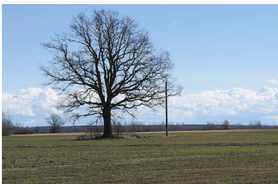
Ozols tīruma vidū, viena no Latvijas stipruma zīmēm.