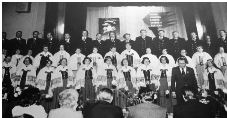
Dziesmai ir spēks.

Degumniekos bija ansamblis un pat koris. Piedalījāmies arī Dziesmusvētkos 1975. gadā kopā ar p/s „Sāviena” kori.