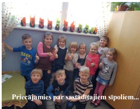
Priecājamies par sastādītajiem sīpoliem...

Ir iesācies jaunais ugunīgā gaiļa gads. Arī mūsu skolā ir 9 šīs zīmes pārstāvji: