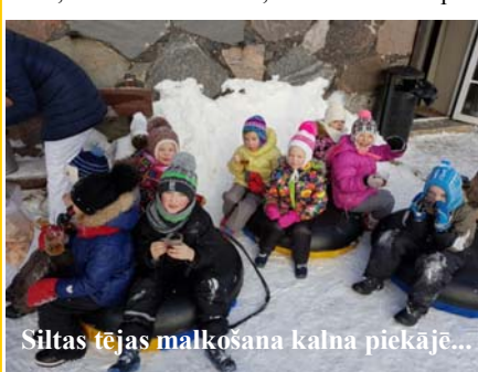
Siltas tējas malkošana kalna piekājē...

Sargā sevi pats un Dievs Tevi sargās! Lai kā negribas aptumšot balto ziemas skaistumu un daili, bet tā ,diemžēl, nes sev līdzī arī tumšo pusi-slimošanu, vīrusus. Mēs neesam ģēnīgi, kuri varētu izvairīties no uzbrūkošajiem vīrusiem, bet mēs esam bērni, kuri varam tiem pretoties. Tāpēc apvienojām divas svarīgas lietas