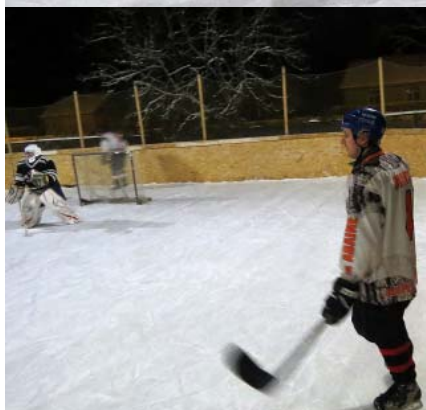
Mirkļi no spēlēm.

uzbraukt uz ezera. Iedzīvotāji vēlas, lai droša ledus gadījumā tiktu atļauts braukt pa ledu ar specializēto transportu – motokamanām.