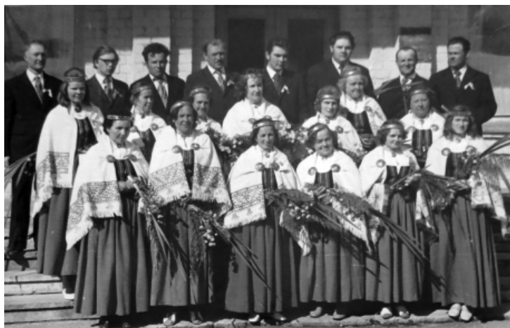
1975. g. dziesmusvētki paju saimniecības „Meirāni” jauktais koris.