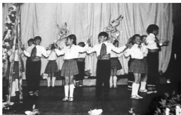
Iesaistīti arī bērni.

kādas balles un vakarus rīkojām! Visi bija sajūsmā. Mans māsas vīrs bija instruktors un bija padzirdējis, ka Dzelzavas kultūras namā vajadzīga vadītāja. Abi ar moci aizbraucām apskatīties un parunāt. Toreizējā