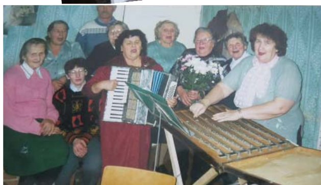
Ar savu cītaru.

padomju saimniecības „Meirāni” paspārnē, vēlāk to pārņēma p/s „Degumnieki” un tā līdz 1993. gada 1. jūlijam, kamēr likvidēja štata vienību. Žēl, ka četrus mēnešus līdz pelnītai atpūtai nevarēju nostrādāt.