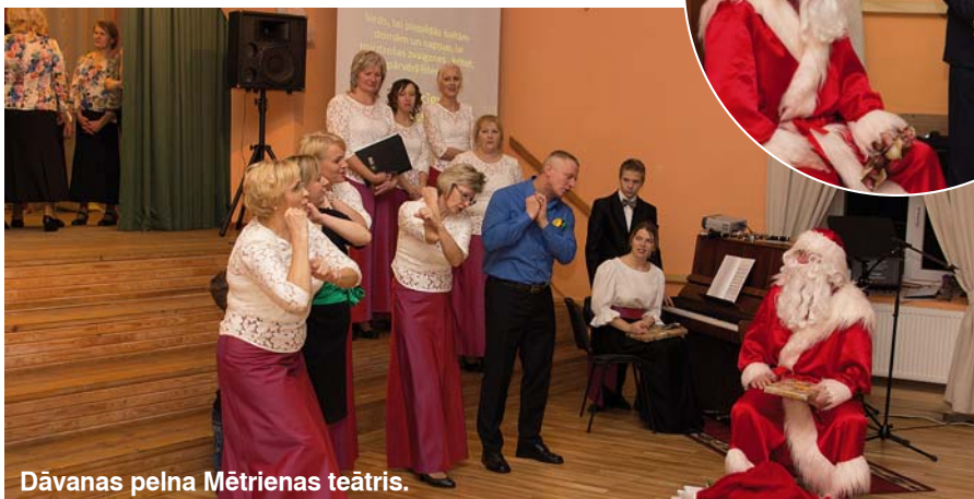
Dāvanas pelna Mētrienas teātris.