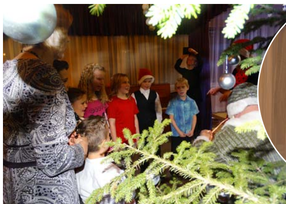
Dāvanu saņemšanas laiks.