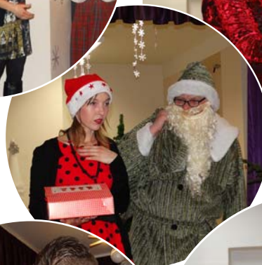
Salatētis un sniegbaltīte.