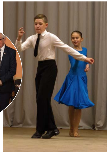
Dejojāji no Aizkraukles.