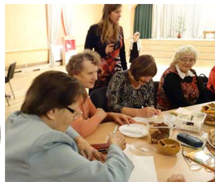
Dzejoļu radīšanas laiks.