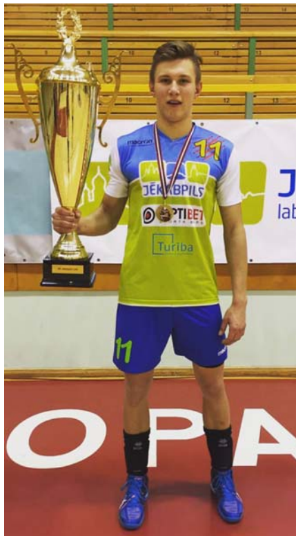
Ar uzvaras kausu.

10. decembrī Mētrienas vīriešu volejbola komanda sacentās Kokneses novada Iršu pagastā. Uzvarot četrās grūtās spēlēs, uz Mētrienas pārveda Iršu kausu. Toties nepietika spēka otrās dienas sacensībām. 11. decembrī Madonas novada čempionātā mētrienieši zaudēja Ērgļiem un komandai MADNO. Mūsu rindās dažādu iemeslu dēļ nespēlēja vairāki pamatsastāva spēlētāji.