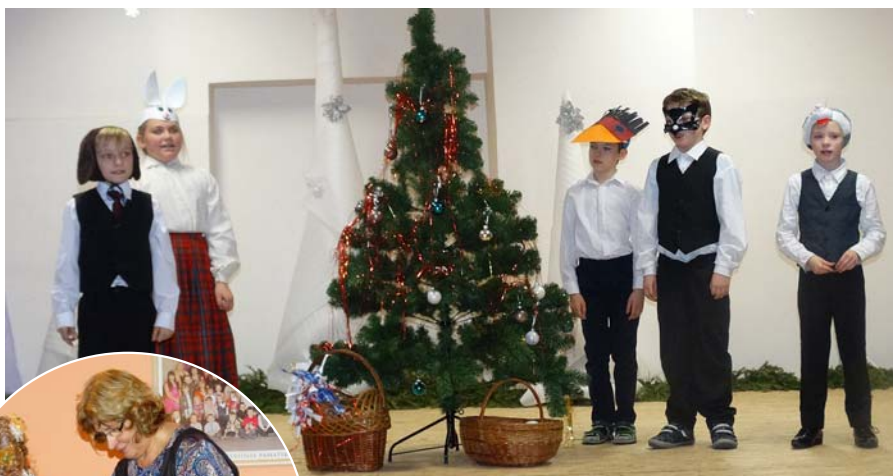
Sākumskolas audzēkņu priekšnesums.