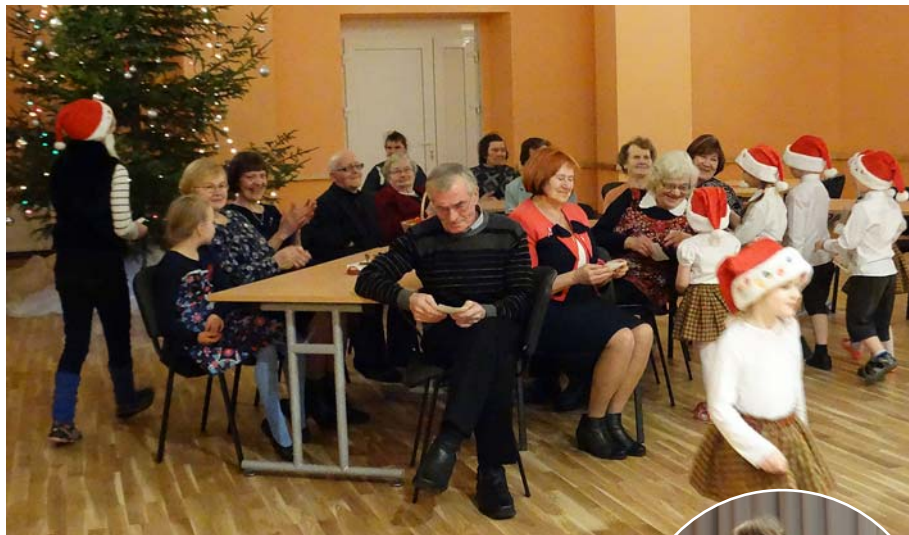
Mazie mētrieniēši visus sveica ar pašdarinātiem apsveikumiem.