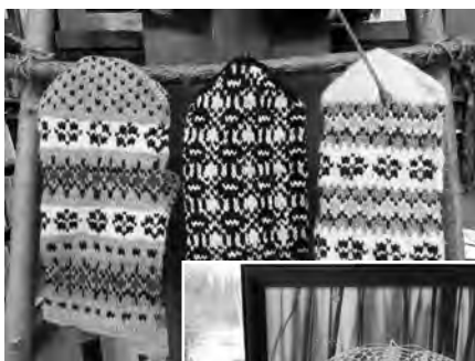
Cimdi tapuši kādus 20 gadus atpakaļ no pašu aitu vilnas.