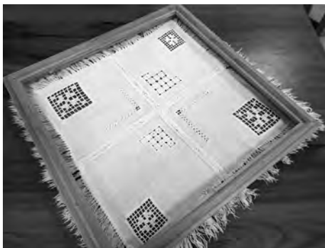
Senākais saglabātais darbs – Alises taupības sedziņai ir ap 80 gadu.