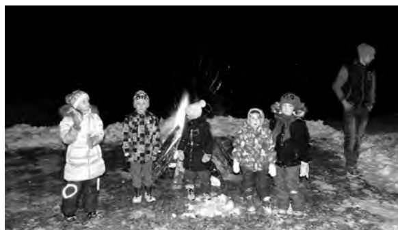
Bērniem bija iespēja sildīties pie ugunsкура.

pagastā amatnieka ģimenē. Latvijas armijā dienējis 1. Liepājas kājnieku pulkā, 11. Dobeles kājnieku pulka komandieris, Sarkanarmijas 24. teritoriālā korpusa, kuru izveidoja no Latvijas Tautas armijas 1940. gada rudenī – 183. Strēlnieku divīzijas 295. pulka komandieris. 1941. gada 14. jūnijā aizbrauca „kursos” uz Maskavu. Deportēts. Apglabāts Latvijā 1966. gada 31. jūlijā Baldonē. Ar Lāčplēša ordeni apbalvots par 1919. g. 14. novembra cīņām pie Liepājas.