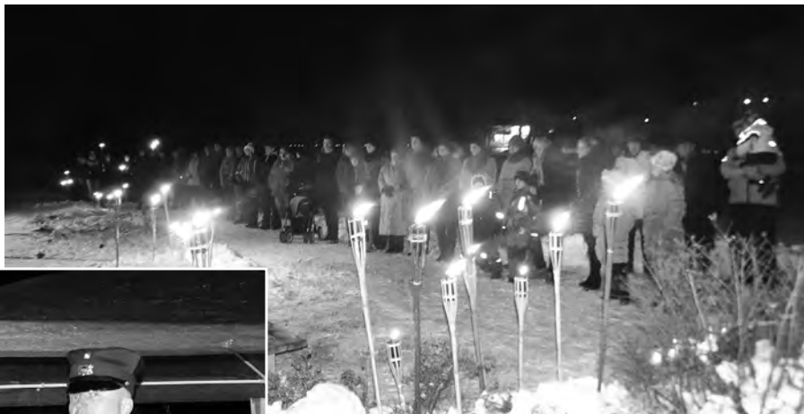
Lai top gaisma!

Pulkvedis Nikolajs Ābeltiņš dzimis 1897. gada 28. augustā Mētrienas