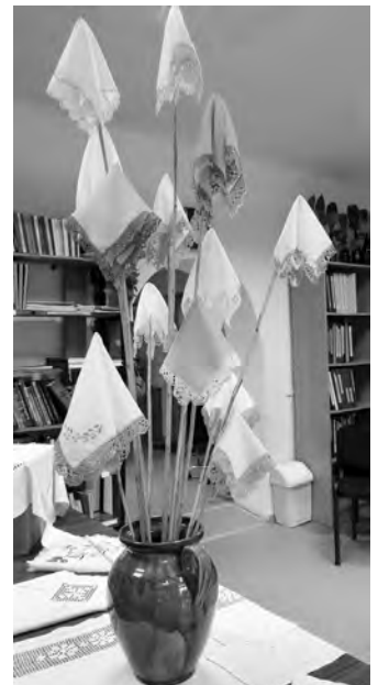
Aptaborēts mutautiņš bijis 1. pašrocīgais darinājums. Tagad to vesels pušķis.