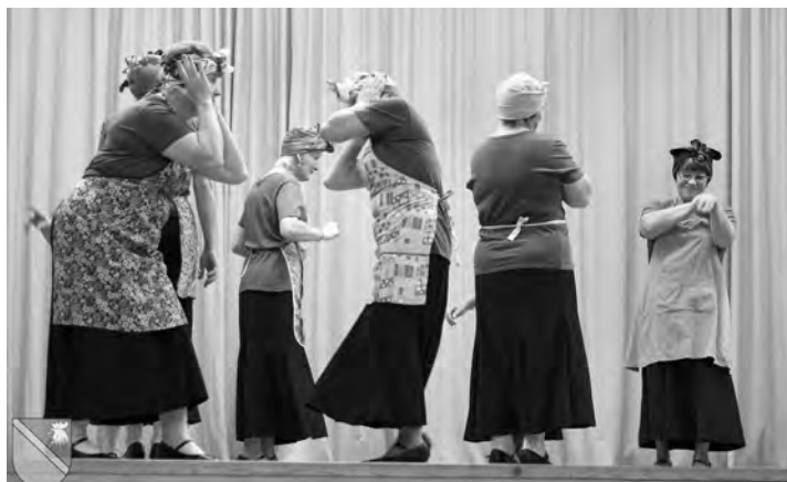
Dejo dāmu deju grupa „Saulgriezes”.