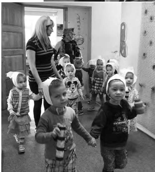
Ķekatu laiks sācies.