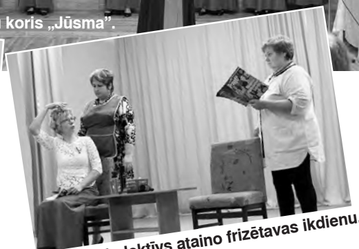
Dramatisks kolektīvs ataino frizētavas ikdienu.