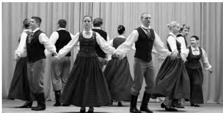
Jauniešu deju kolektīvs „Meteņi”.