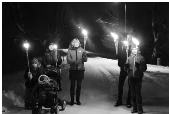
Uz pasākumu nāca ģimenēm.