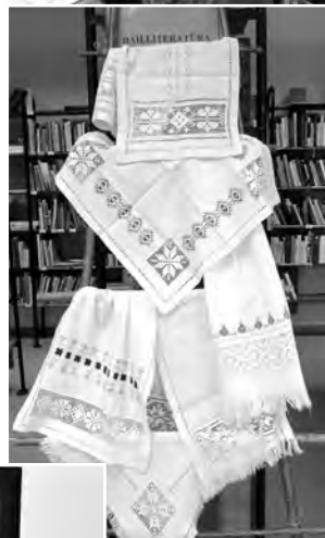
Alisei vislabāk patīk baltie izvilksimdarbi.