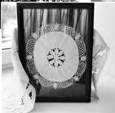
Mežgīnēm līdzīgie rišeljē.