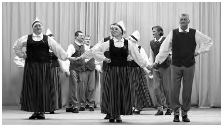
Senioru deju kolektīvs „Mētra”.