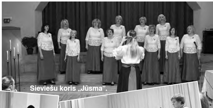
Sieviešu koris „Jūsma”.