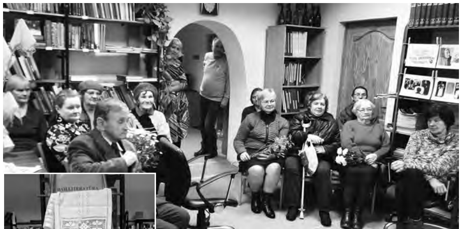
Alises talanta cienītāji.