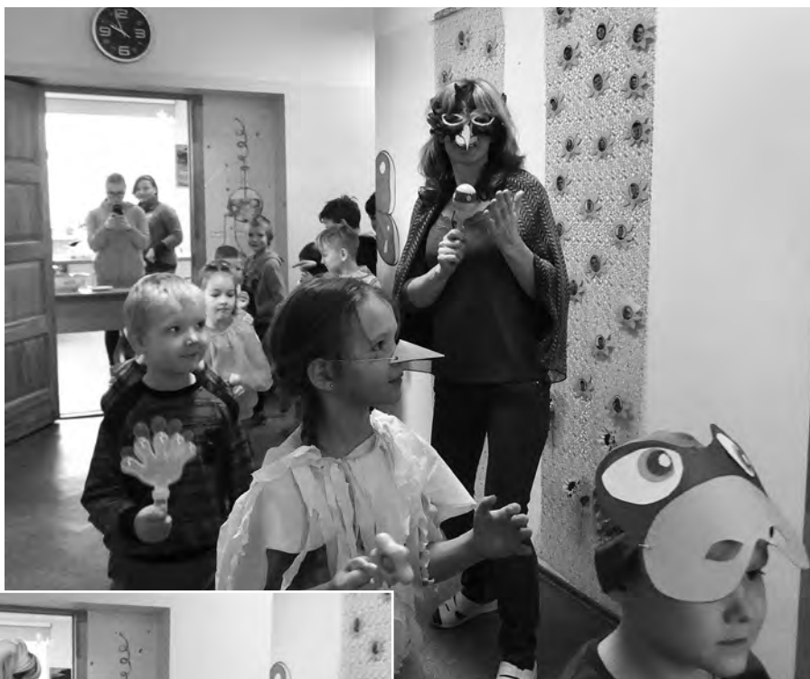
Mazie Mārtiņbērni skaļi devās gājienā.

Dainās Mārtiņu galdā minēti plāceņi, medus, alus, dažādi gaļas ēdieni