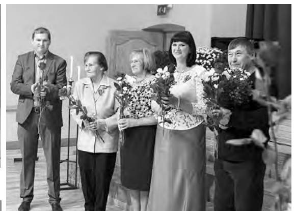
Par ieguldījumu pagasta dzīvē 2016. gadā sveikti daudzi pagasta aktīvisti.