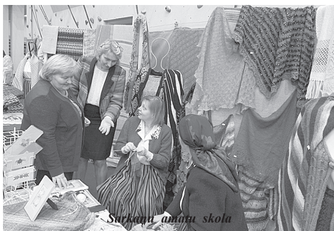
Sarkaņu amatu skola