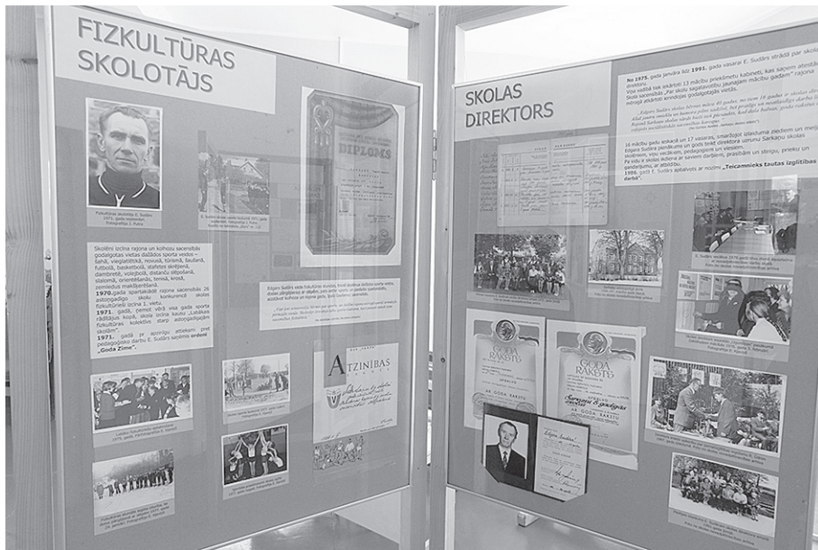
Izstādē fotografēja Inga Sudāre

rosina E. Sudāru, strādājot pirmos trīs darba gadus par pedagogu Grostonas 7-gadīgajā skolā, apgūt fiziskās kultūras skolotāja kvalifikāciju vispirms kursos un, kad Sarkaņos paskrējuši jau vairāki darba gadi, iegūt augstāko iz-