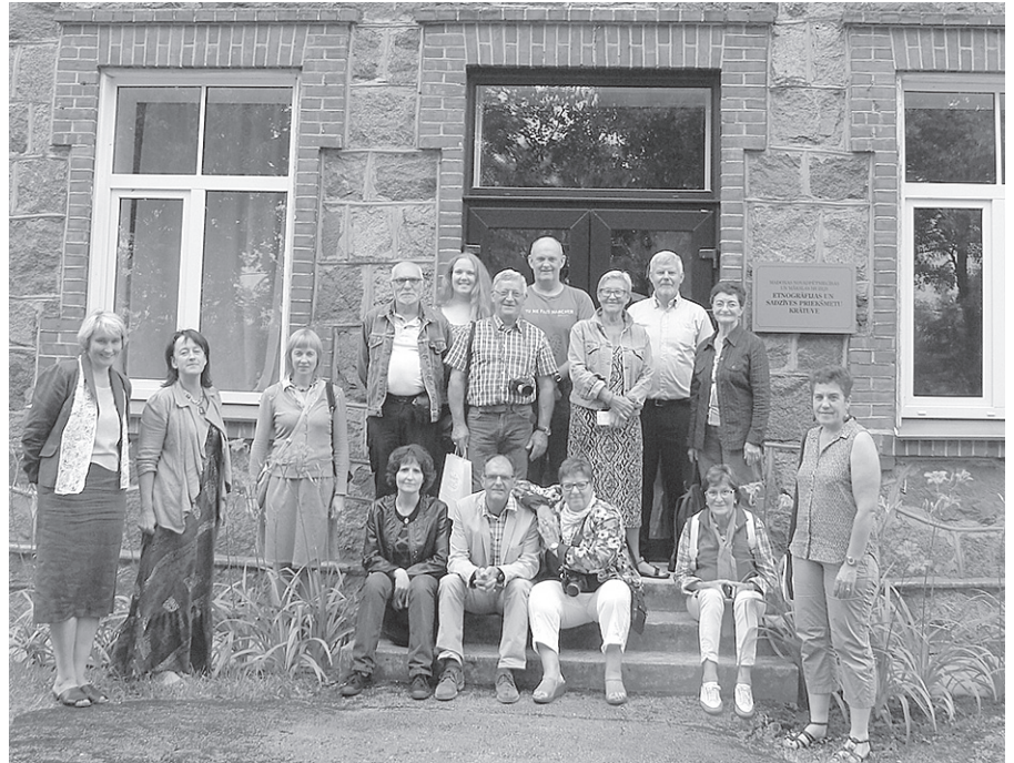
Ciemiņi no Kulēnas (Francija).