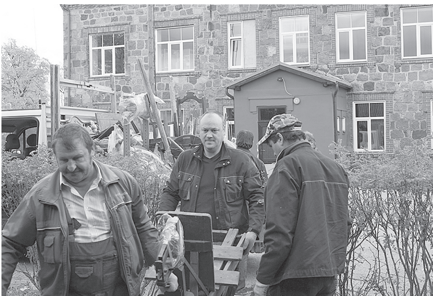
Atvesti muzeja priekšmeti no “Mengeļiem”.

Atklātā muzeja krājuma iekārtošana Sarkaņos turpinās. Vēl notiek darbs mēru un tvertņu kolekcijas priekšmetu sagatavošanā, lai pēc telpas remonta tos varētu izvietot plauktos un pavasarī