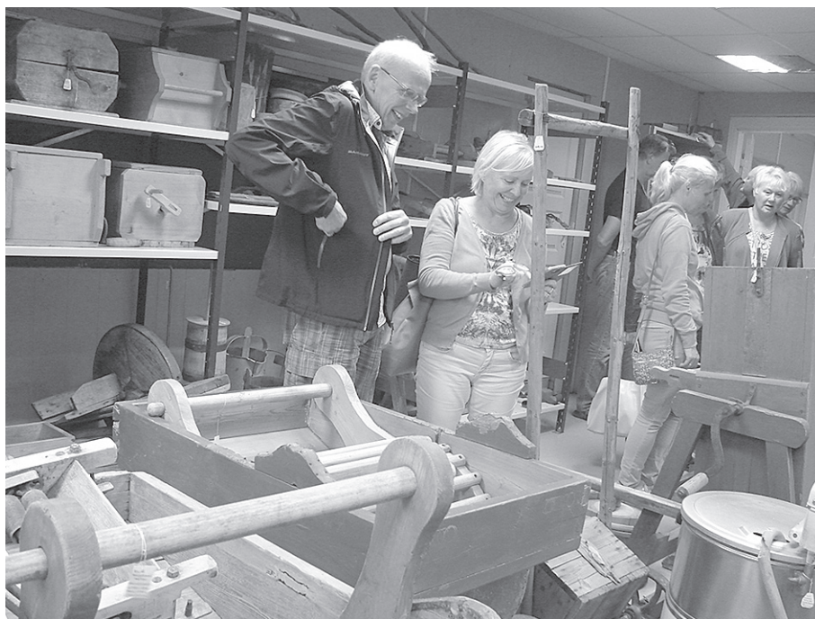
T. Reitera kora dalībnieki no Stokholmas.

Madonas novadpētniecības un mākslas muzeja krājuma glabātāja Sarkanos