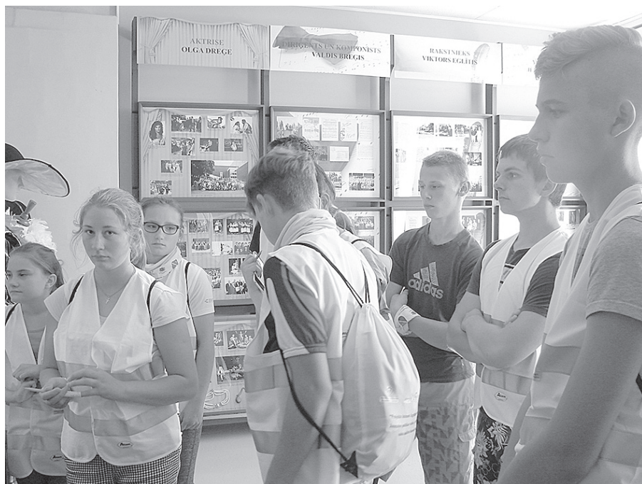
Velo ekspedīcijas Madonas novada jauniešiem "Desmit līdz 100" dalībnieki izciliem sarkaniešiem veltītajā izstādē.