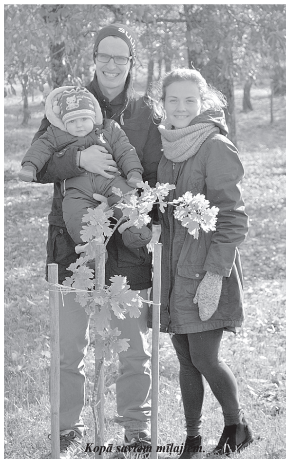
Kopā savtām mīļajiem.