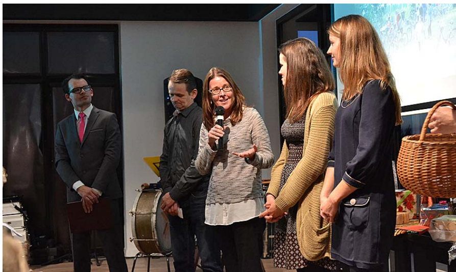
Ošupes pagasta pārstāvji (Alņi, Liepsalas, Mitrāja namiņš).