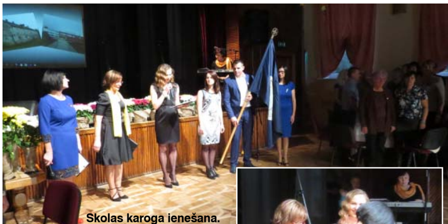
Skolas karoga ienešana.