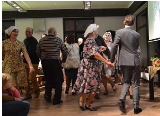
Izkustināti tiek arī klātesošie.

1) apmeklējām O. Kalpaka pieminekli Meirānu kapos (neiebraucām „Liepsalās” laika pēc, jo tajā dienā bijām „nobriedušas” ar velo nobraukt ap ezeru);