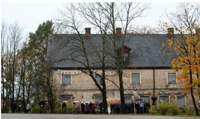
Svētsvinīgs mirklis pie vēsturiskās Gotlibskolas, Cesvaines pūtēju orķestra melodiju pavadībā (vadītājs Oļģerts Ozols).