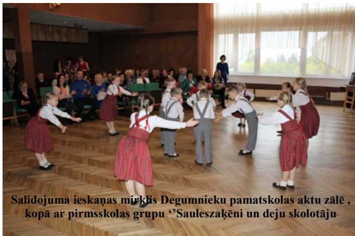
Salidojuma ieskaņas mirklis Degumnieku pamatskolas aktu zālē, kopā ar pirmsskolas grupu "Saulsazāķeni un deju skolotāju

Šogad jaunajai Degumnieku skolas ēkai 30. Aicinājām skolas absolventus un darbiniekus kavēties atmiņās, izdziedāt, izdejot, izrunāt bijušo.