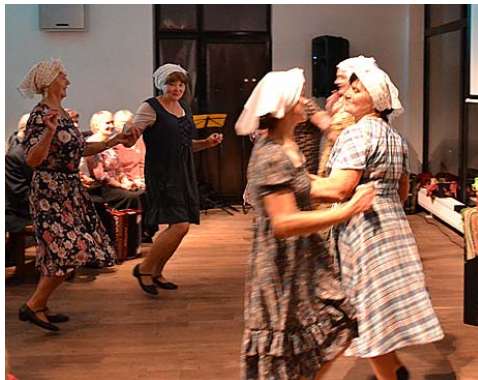
„Orhideju” jautrā deja.