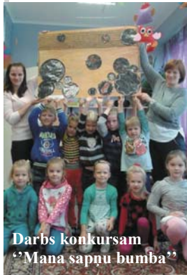
Darbs konkursam „Mana sapņu bumba”