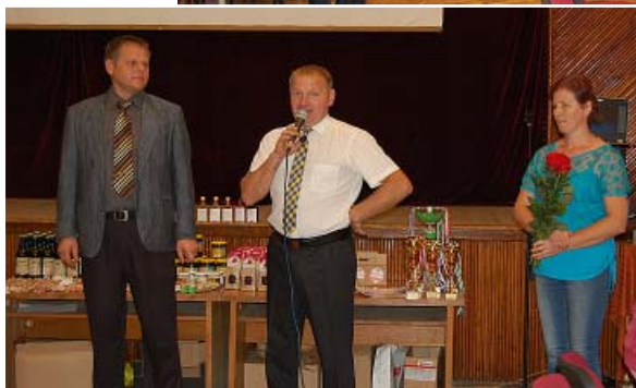
Aigara uzruna šoreiz divās valodās.