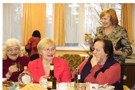
Dzejoļi, novēlējumi, dāvanu saņemšana.