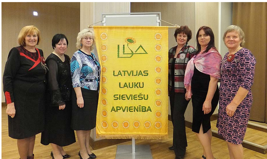
Pie LLSA karoga.