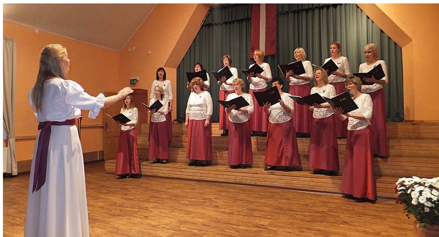
Svētkos sveic sieviešu koris „Jūsma”.