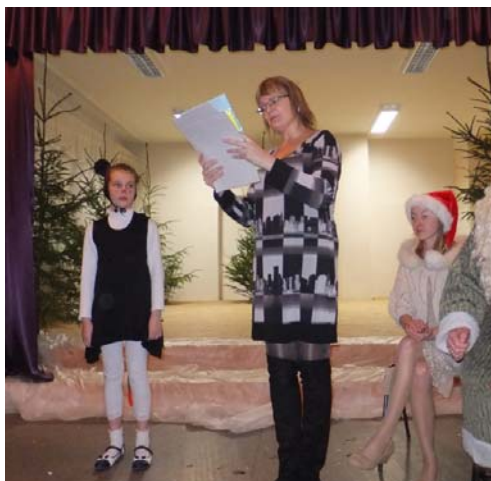
Annija saņem balvu.