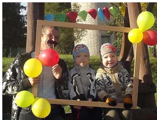
Kopā ar mazdēliņiem.