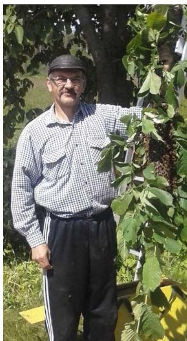
Jubilāra vaļasprieks bites.

Visu to labāko Tev, tēti, vēlam mēs, Tavi mīļie