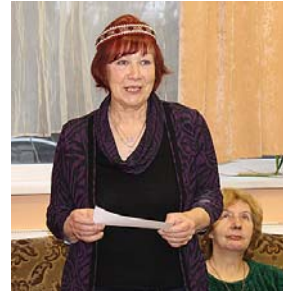
Arī Dainai meitas loma.