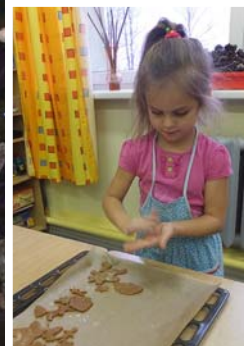
Pannā visas rindojas!