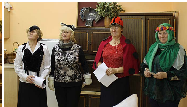
Pasākumā ieradušies viesi.