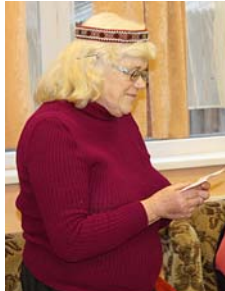
Ņina iejūtas meitas lomā.