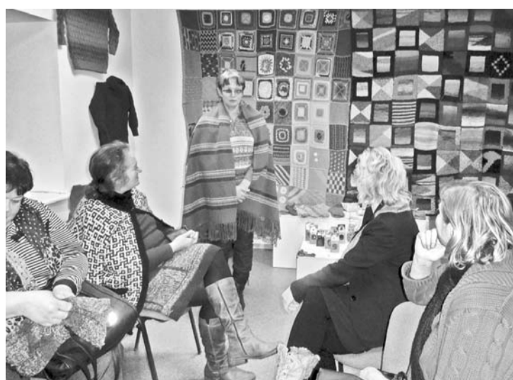
Baiba dalās pieredzē mustursegas adīšanā

kompleksu, kurā ir gan pagastmāja, gan senlietu muzejs „Bikšēres klēts”, gan parks ar kārtīgu mūra sētu, dažādām skulptūrām un vides objektiem, pastāvējām uz robežas, kur Vidzemes augstiene pāriet Lubānas līdzenumā, iegājām pagastmājas tradīciju