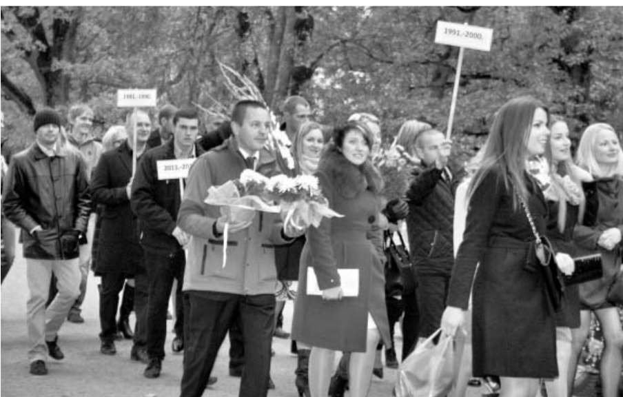
Gājiens uz Tautas namu.

saviem priekšnesumiem papildināja arī skolēni, kuri pašlaik mācās skolā.