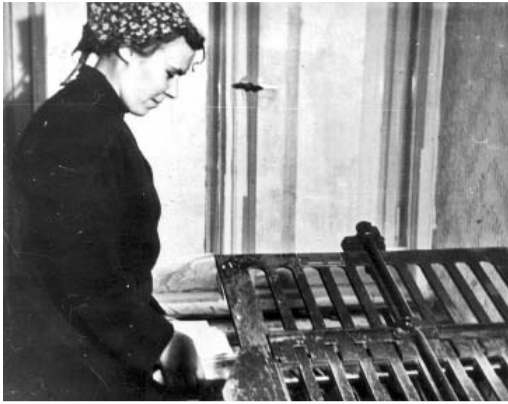
Vera tipogrāfijā.