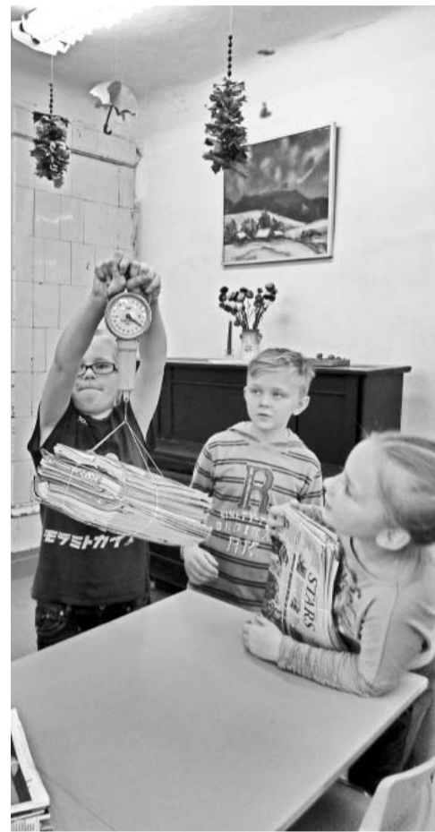
Makulatūras svēšana.

No 2. līdz 8. novembrim Ekoskolu Globālās Rīcības dienu ietvaros Vestienas pamatskolas skolēni aicināja visus pagasta iedzīvotājus uz klimatam draudzīgu rīcību.