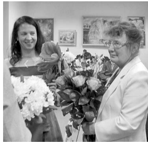
Izstādes atklāšanā.

Maija stāsta: "...Ar ģimeni 1980. gadā pārnācām dzīvot uz Dieva radīto, neaprakstāmi skaisto Vestieni. Staigājot ar mērinstrumentiem pa laukiem, mežiem, pakalniem, ziedošajiem debesu dārziem, paturēju atmiņā dabas stūrīšus, krāsu nianšes un gaismas rotaļas. Par to gavilēju Dievam līdz ar putniem. Saskatīju Dieva radības pārsteidzošo skaistumu, ko vēlējos uzgleznot, pagodinot Radītā-