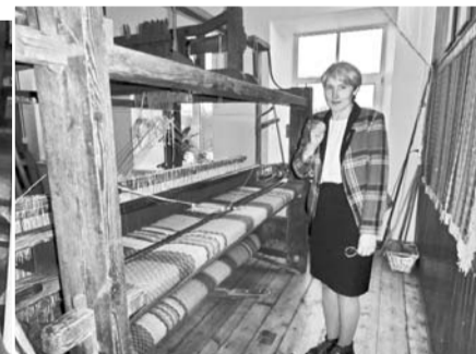
I. Mailīte pie lielajām stellēm