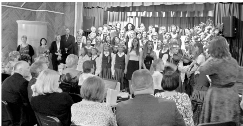
Dzied absolventu koris.

Laikiem cauri ejot, mūsu skola vairākkārt mainījusi gan savu nosaukumu, gan atrašanās vietu. Skolas ir bijušas Tolkas pils, Jāņlejās, no 1951. gada – Kāla kroga ēkā, bet no 1960. gada – Vestienas muižā. Tā kā šobrīd mācību process notiek muižas ēkā, tad skolas jubilejas svinības gadus skaitām, sākot ar 1960. gadu. Šogad atzīmējam skolas 55 gadu jubileju, kopš tā atrodas muižas ēkā.