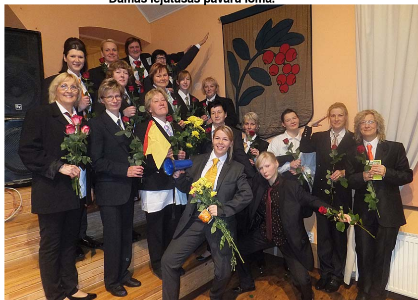
Sieviešu koris „Jūsma”.