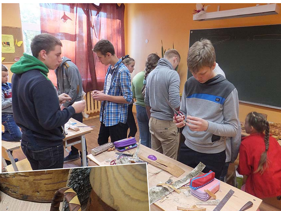
Arī zēni izrādīja interesi.