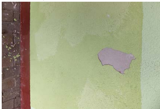
Tāda nu atkal ir skolas siena.