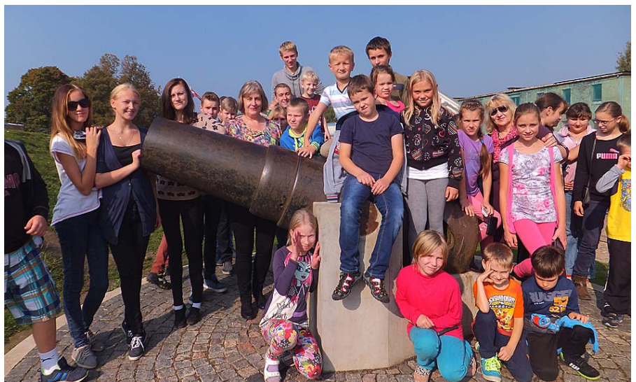
Mētrienas pamatskolas ekskursantu grupa pie vecā lielgabala.