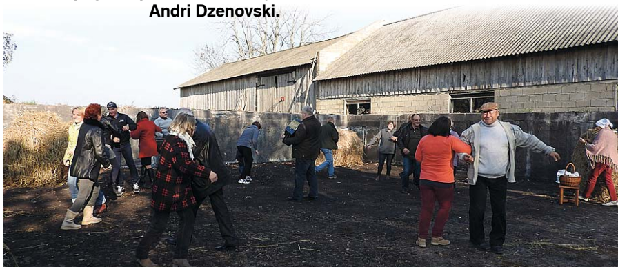
Iets jautrās rotaļās.