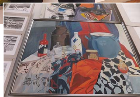
Lauras Lejiņas darbs. 2011. gads.