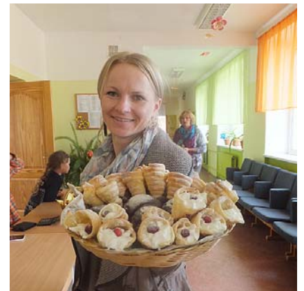
Riharda mamma Zinta atnesusi cienastu tirgum.