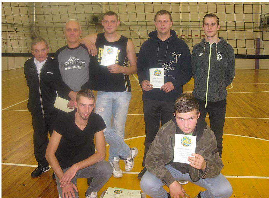
Mētrienas volejbola komanda.

Ja Mētrienas volejbolisti piedalījās visās 17 sacensībās, tad piedalīsies arī astoņpadsmitajā.