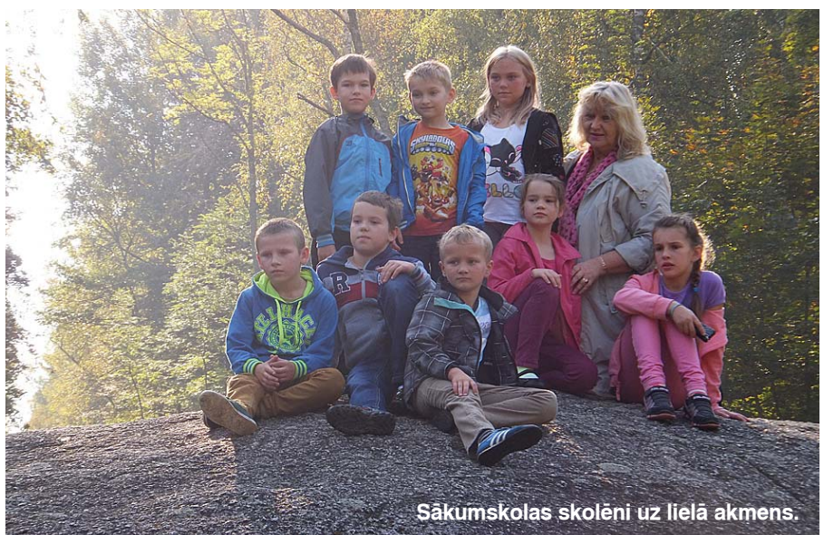
Sākumskolas skolēni uz lielā akmens.