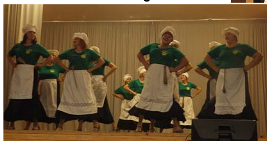
Dāmas iejūtās pavāru lomā.