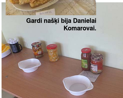
Mazā pagrabīņa gardumi.