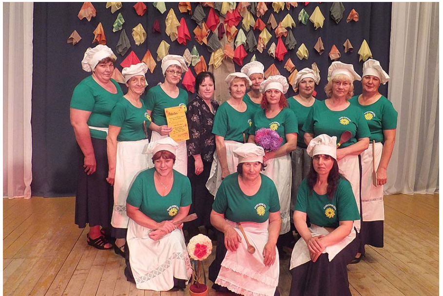
Pavāru kuplejas izdejojas.