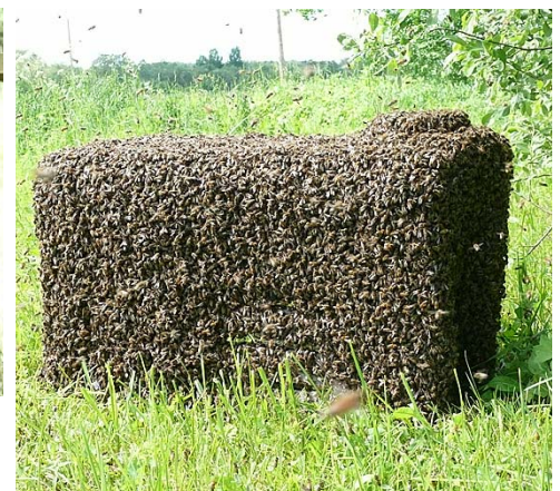
Spietošana. Bez komentāriem.