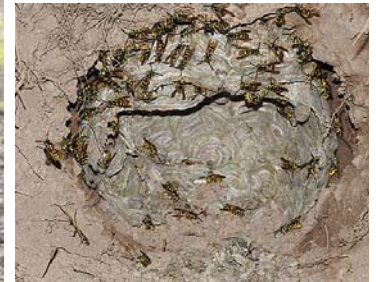
Lapsenes. Šīs ir zemes lapsenes. Laikam lapsa izpostījusi lapsēnu pūzni. Nu pašām „jāremontē”, ne tā, kā bitēm, kurām palīdz dravnieks.