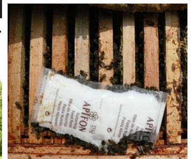
Bišu piebarošana, kas notiek pavasarī. Kandijs ir profilaktiska barība, kas veicina bišu saimes darbības attīstību.