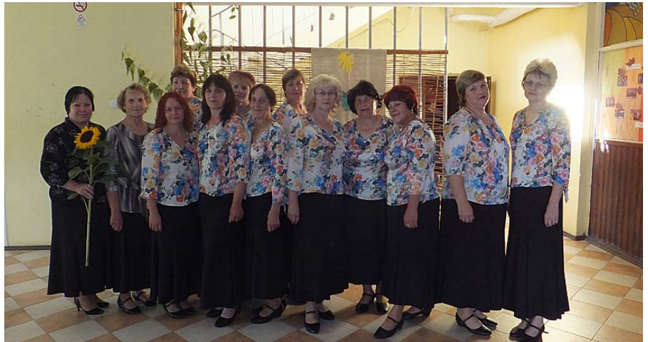
Saulgriezes pirms koncerta.