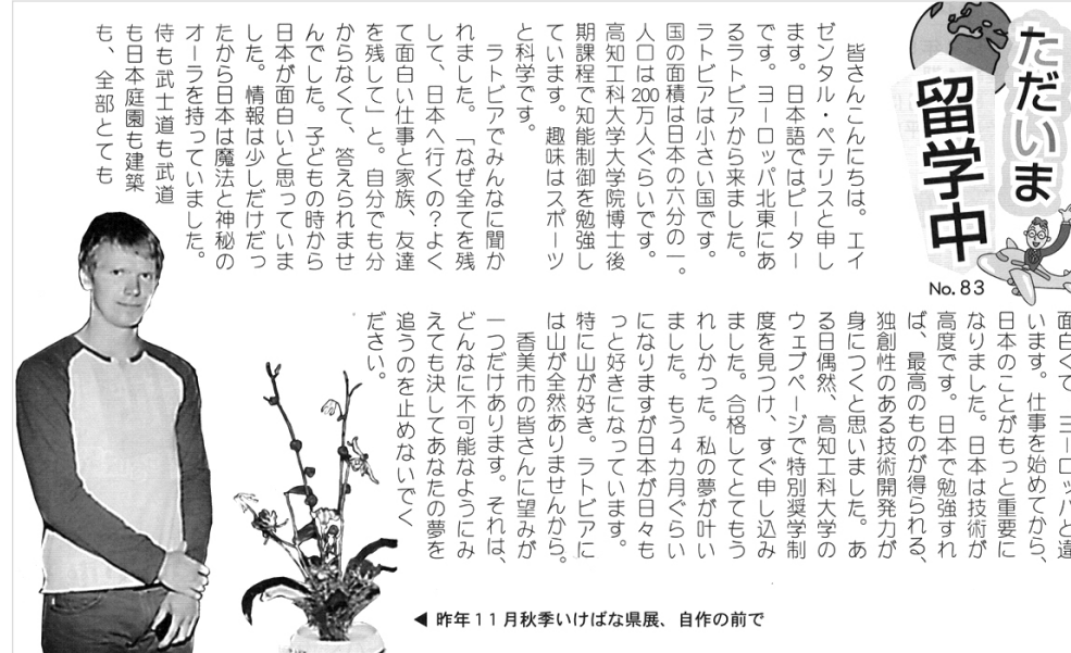
◀ 2011. gada 11. oktobrī iekārta izstāde, autoru darbi

Iegūtās zināšanas pamatskolā deva man iespēju iestāties Rīgas Valsts 3. ģimnāzijā. Mācības bija saspringtas, skolotāji visos priekšmetos gaidīja labākos rezultātus un centās mums iemācīt praktiski visu. Vienu gadu pat apguvām augstāko matemātiku. Jau no pamatskolas laikiem mans mīļākais priekšmets bija matemātika, tāpēc ar grūtībām šajā priekšmetā nesaskāros.