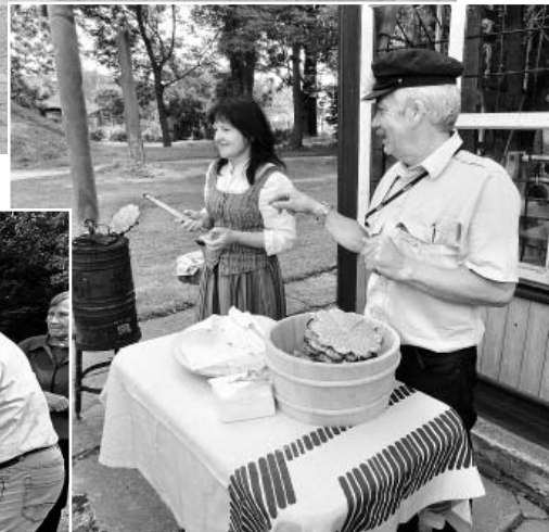
Amatu darbnīcas saimnieki sagaida ar tikko ceptām „bada” pankūkām