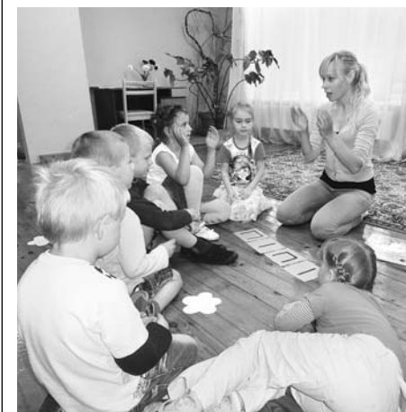
Daina vada muzikālo stundu

Ilgā Sabitova , redaktore