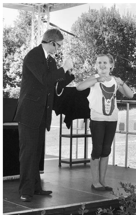
Koncerts ar burvju mākslinieka trikiem