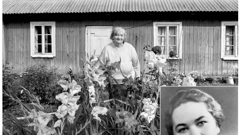
Jubilāre dārzā.