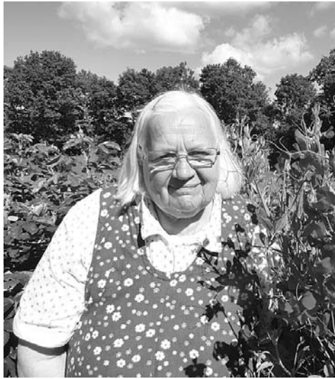
Vija puķezirņos

Kad bērni paaugās, Vija strādāja Vējāvas fermā par tējkopi, bet kad Vestienas sovhozs piešķīra Līvānu māju, Vija ar ģimeni atgriezās Vestienā. Andrejs strādāja