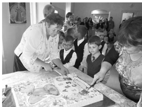
Indra un Daiga sāk dalīt skaisto torti

šī bija pirmā diena jaunā kolektīvā. Bērni pūta burbuļus, nosauca savu vārdu, saņē- ma piemiņas veltes, dziedāja un dejoja. Tad nāca pārsteigums. Skolas direktore ienesa