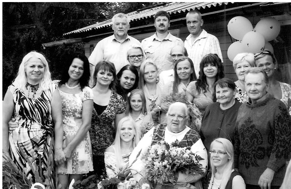
Vija kopā ar ģimeni