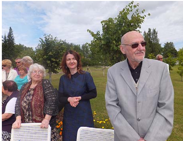
Mākslinieku Krolļu ģimene.