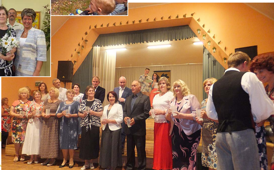
Bijušie un esošie skolotāji.