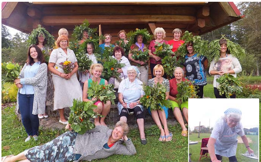
Visas dalībnieces pie „Cīrulišu” pirtīņas.

interesanti pavadīto dienu, par jaunām zināšanām un iemaņām, ko katrs dalībnieks ieguva. Nodarbības apmeklēja interesenti no Madonas, Kusas, Vestienas, Mārcienas, Saikavas un Mētrienas.