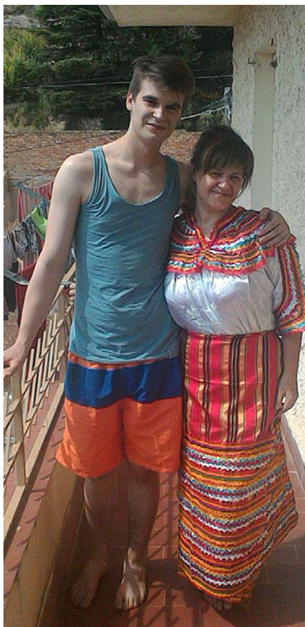
Inta kopā ar dēlu.

Kas man patīk Spānijā? Spāņiem labākie gadi sākas pēc sešdesmit. Viņi sēž bāros, vecās kundzītes iet uz frizētavām