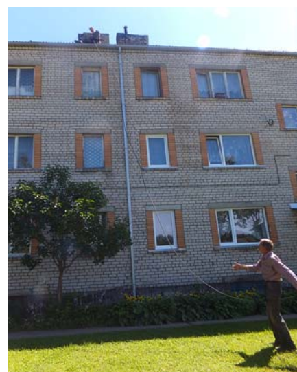
Notekcauruļu tīrīšana „Mežrozēs”.