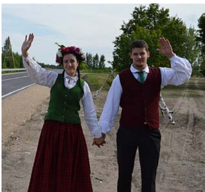
Tā tika sagaidīti ikviens ciemiņš.

Solvītas Stulpiņas foto no svētku dienas notikumiem Mētrienā