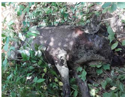
Āfrikas mēra beigtās cūkas.