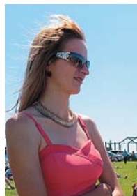
Jolanta no Daugavpils novada

Saruna ar brīvbiļešu laimētājām, kas piedalījās Latvijas Radio 2 konkursā un ieguva iespēju būt aviācijas svētkos. Atbraukušas bija divas (vismaz atsaucās uz aicinājumu atnākt uz informācijas telti)