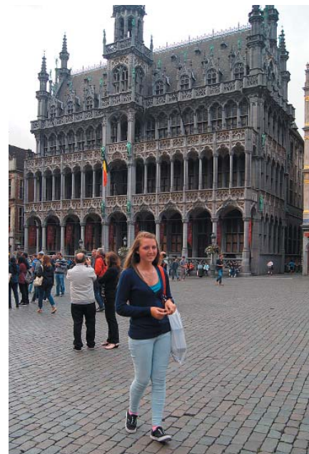
Senlaicīgās un modernās ēkas uz Vendiju atstājušas lielu iespaidu.

dze dejojot ielu koncertā XI Skolu un jaunatnes dziesmu un deju svētku ietvaros, svētku gājiens, ģimenes izbrauciens uz Likteņdārzu un Zoodārzu. Esmu kļuvusi par vēl vienu brālēnu bagātāka, bet, protams, ka visiespaidīgākais šovasar bija ceļojums uz Briseli. Vēl jau gan vasara nav galā!!!