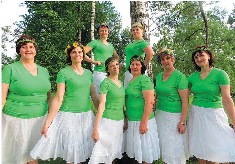
Ināra kopā ar dejotājām.

Kāda šobrīd ir jaunās paaudzes attieksme pret dzīvi laukos?