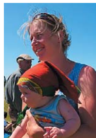
Baiba no Taurenas

Vai iepriekš jau esat bijušas Ošupes pagastā? Vai zinājāt, kur tas atrodas?