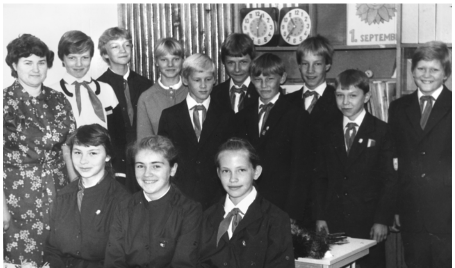
Kopā ar audzināmo klasi.