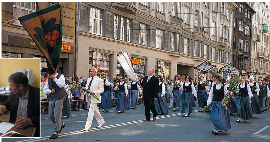
Dziesmu svētku gājienā Rīgā.