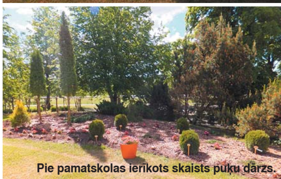
Pie pamatskolas ierīkots skaists puķu dārzs.