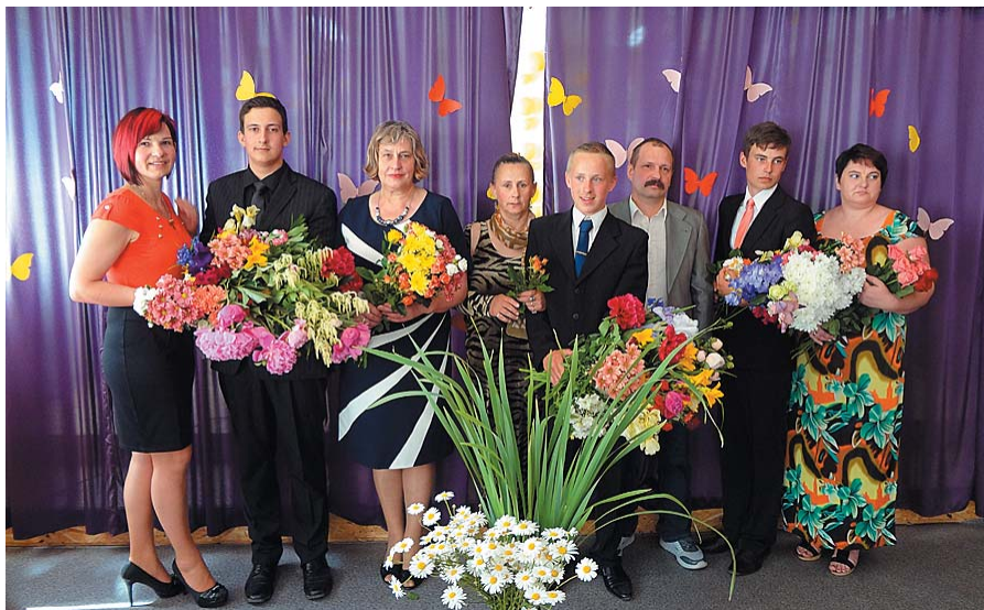
Kopā ar vecākiem.

gribam visu izdarīt pareizi. Bet dzīve mums tikai viena – kurš tad izgudrojis šo „pareizi”. Kā veidot savu dzīvi labāku, – katra paša