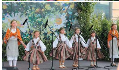
Zāļu tirdziņā Rīgā.