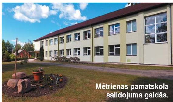
Mētrienas pamatskola salidojuma gaidās.