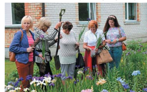
legādājāmajos skaistos īrisus.