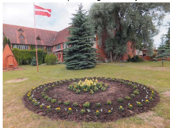
Puķes saziēdēs un būs skaisti.