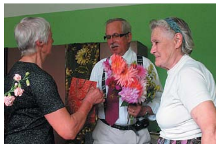
Kopā ar pensionāru padomi.