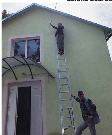
Salabota elektrības padeve uz centra birzīti pie tautas nama.