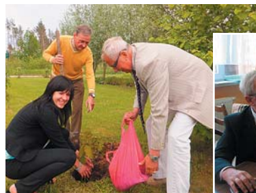
Kociņu stādīšana pagasta parkā.