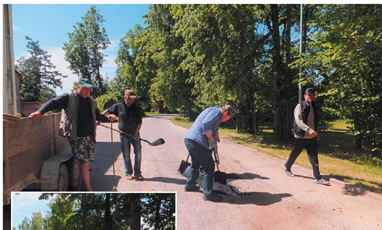
Pagasta centrā tiek aizbērtas asfalta bedres.