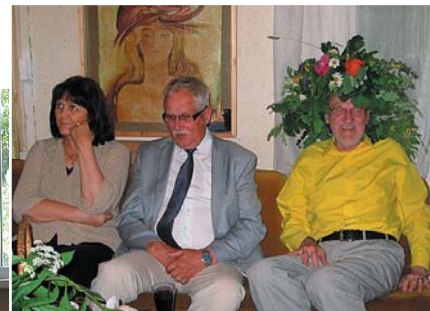
Pie mākslinieka G. Krollja.