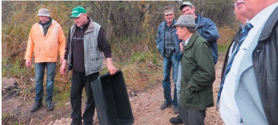
Zivju mazuļu laišana Odzienas ezerā.