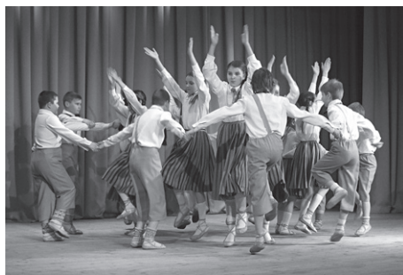
Skolas dejojotāji “Kalnagravās” sadancošanās koncertā.

Samanta: “Jautrību, daudz deju un, protams, siltu laiku.”