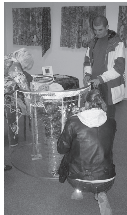
Dzīparus Sidraba šķidrautā ieaūž tālākais viesis, – puisis no Marokas, kas viesu grāmatā kopā ar laba vēlējumiem ierakstīja šādus vārdus:

“Ar Dieva svētību es sāku katru darbu.”