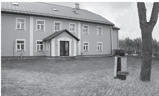
Sarkaņu bibliotēkas apkārtnē šodien....