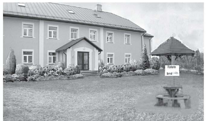
...un realizējot projektu (lapenīte plānota lielāka un savādāka, ja tiks saņemts finansējums).