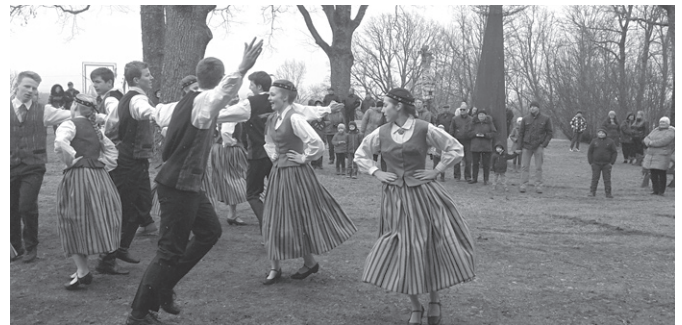
Aukstais laiks netraucē svētku priekam.

5. aprīlī amatiereteātris „Piņģerots” kuplināja Lieldienu pasākumu Dzelzavā.