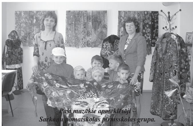
Paši mazākie apmeklētāji – Sarkaņu pamatskolas pirmsskolas grupa.