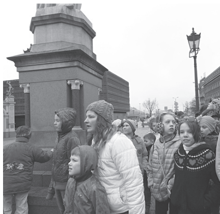
Caur Vecrīgu ceļā uz Saules muzeju.

Saules muzejā mēs krāsojām ģipša saulītes. Kamēr tās izžuva, mēs gājām uz blakus istabu, kur mums stāstīja par Sauli, planētām un zvaigznēm. Viena muzeja istaba bija melna, otra – pelēcīgi sarkana, trešā – balta. Saules muzejā neatļāva neko fotografēt, vadītāja bija barga. Mēs apskatījām meteorīta gabaliņus. Baltā istaba bija pilna ar dažādām saulītēm no visām pasaules daļām. Pie katras sienas bija tāda saulīte, kur var mest ziedojumus. Mums parādīja seno laiku kalendāru ar gadskārtu svētkiem: Jāņiem, Miķeļiem, Ziemassvētkiem, Lieldienām utt. Tad, kad saulītes bija nožuvušas, mēs tās ielikām brūnos maisiņos un skatījāmies tādu video, kur ir planētu un lielu zvaigžņu salīdzinājums, kā arī filmiņu par Mašu un Lāci.