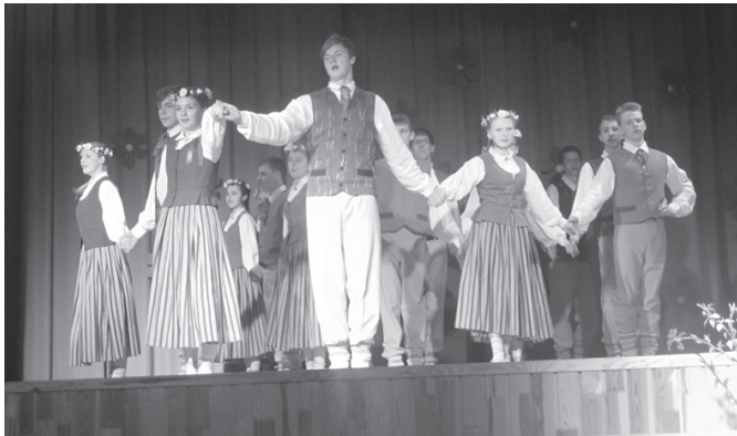
"Resgaļu" studijas dejotāji uz plašās skatuves.

pagasta vidējās paaudzes deju kolektīvs. Dejojā koncertu kuplināja vokālais ansamblis "Rondo"