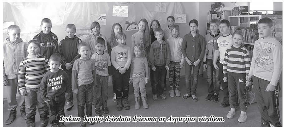
Izskan kopīgi dziedātā dziesma ar Aspazijas vārdiem.