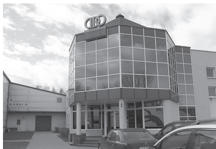
“Cido” ražotnē fotografēt nebija atļauts, bet te mēs bijām.

Manuprāt, šis brauciens bija lielisks. Tikai