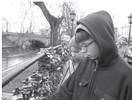
Atslēgu daudzums pie tiltiņa margām Bastejkalnā pārsteidza visus.