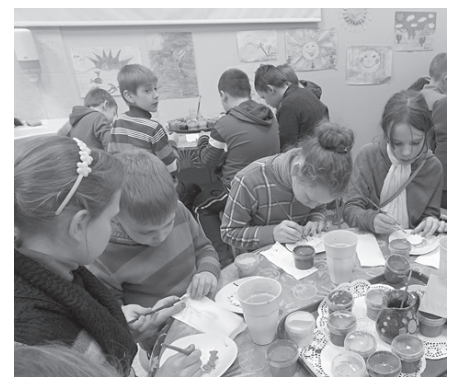
Saules muzeja apmeklējums sākās ar ģipša saulītes izkrāsošanu.