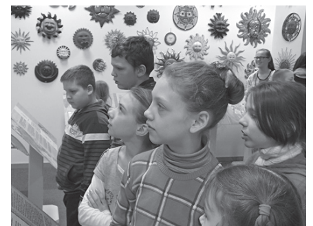
Plaša ir ekspozīcija ar saulītēm no visas pasaules.