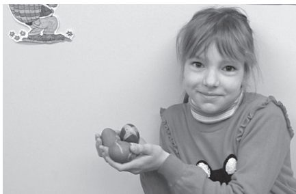
Lauma Lieldienu veikumu varēja parādīt arī klasē.