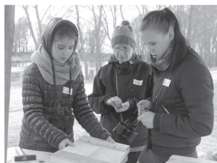
Top gaigalām būrīšs, tādā mēdzot apmesties arī pūce.