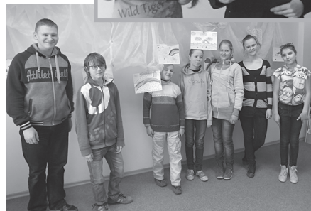
Bibliotēkas aktivitātēs iesaistījās arī 5.-9.klases skolēni.

Aktivitāte "Dzejoļu pulcēšanās" rosināja skolēnus zīmēt ilustrāciju vienam no Aspazijas dzejoļiem. Tajā piedalījās 11 dalībnieki ar 13 ilustrācijām, kas pasākuma dienā (26. martā) bija skatāmas izstādē pie skaisti izveidota "debess juma". Pasākumā izskanēja Aspazijas rakstītie dzejoļi, fragmenti no bērniības tēlojumu grāmatīņas "Zila debess zelta mākoņos". Konkursa dalībnieki un zīmējumu autori saņēma pateicības un balviņas, cienājās ar gardumiem. Dalībnieki visi kopā nodziedāja populāro dziesmu ar Aspazijas vārdiem "Circeņša Ziemassvētki".