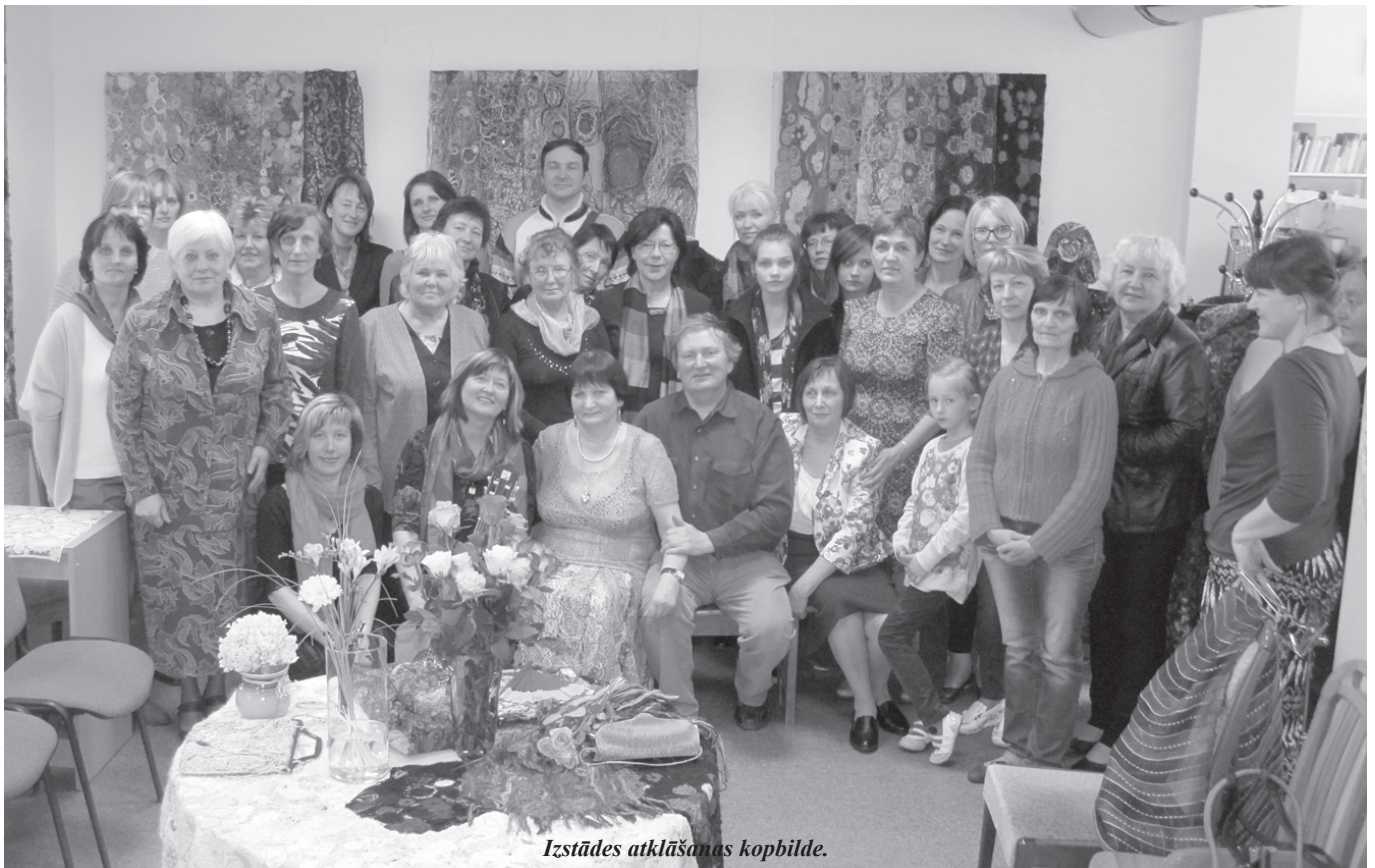
Izstādes atklāšanas kopbilde.