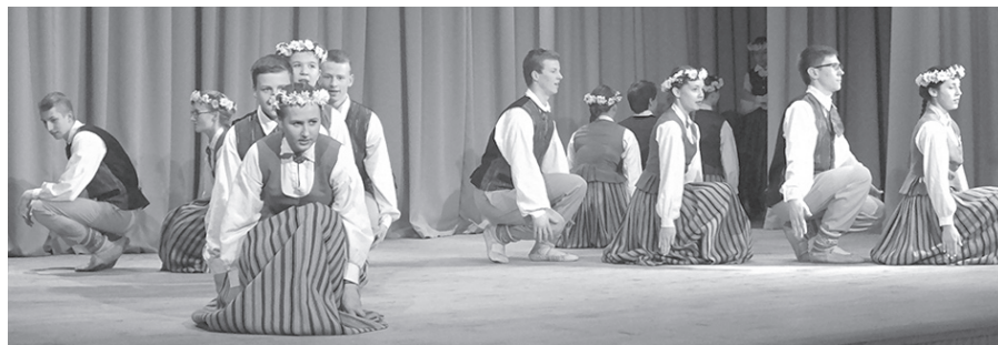
Uz “Kalnagravu” skatuves “Resgaļu” studija sadancošanās koncertā 10.04.