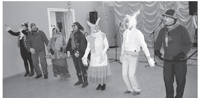
Izrāde "Trīs laimīgi zaķi" Dzelzavā.

5. aprīlī amatiereteātris „Piņģerots” kuplināja Lieldienu pasākumu Dzelzavā.