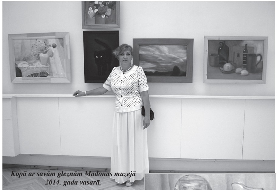
Kopā ar savām gleznām Madonas muzejā 2014. gada vasarā.

un dobēs šādi tādi sīkumi. Pagājušajā gadā savā īpašumā tika uzcelta neliela, omulīga mājiņa. Šogad, tuvākajā laikā, iecerēts uzbūvēt sētu, lai pasargātu to, kas kopts un izlolots, no nelūgtiem četrkājainiem ciemiņiem.