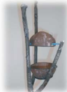
L.Šķēles putniņu barotavas