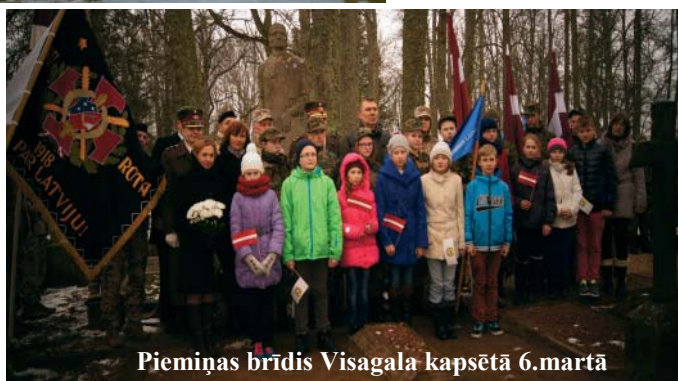
Piemiņas brīdis Visagala kapsētā 6.martā