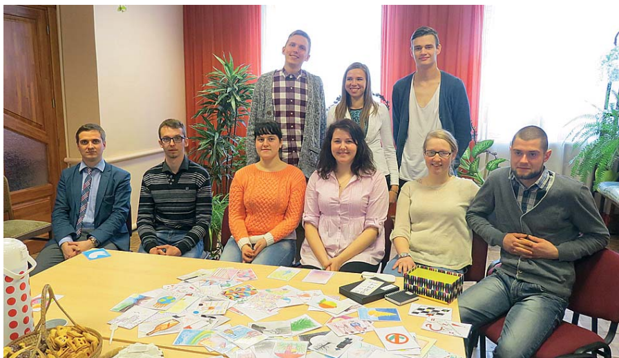
Pirmā jauniešu foruma Degumniekos dalībnieki.

Jaunieši ir enerģiskākā, uzņēmīgākā un zinātkārākā sabiedrības daļa, bet bieži vien pāri tam visam stāv bailes izteikt savas idejas vai ieceres, jo neesam droši par to izdošanos. 21. martā Degumnieku tautas namā notika pirmā tikšanās Ošupes pagasta jauniešiem. Forumā mērķis bija pulcināt jauniešus no visa pagasta un izveidot iniciatīvas grupu, kas dotu iespēju tikties jauniešiem, lai pārrunātu aktuālos jautājumus viņu vidū, diskutētu par idejām, kā kopīgiem spēkiem uzlabot