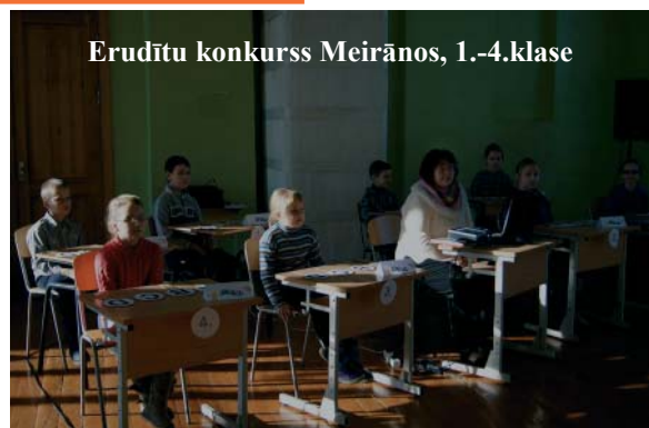
Erudītu konkurss Meirānos, 1.-4.klase