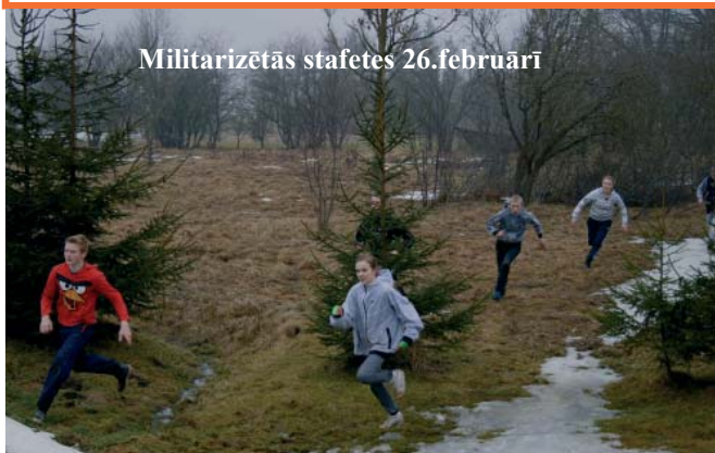
Militarizētās stafetes 26.februārī