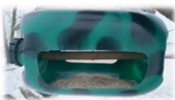
S.Šķēls putnu barotava