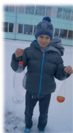
J.T.Bārbala putnu barotavas