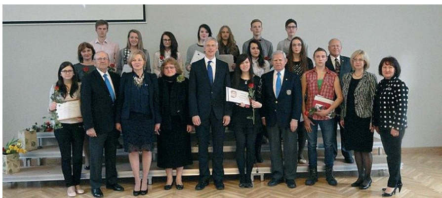
Konkursa uzvarētāji un godalgotās skolas kopā ar konkursa organizatoriem un galvenās balvas sponsoriem.