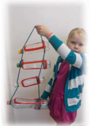
E.A.Ločmeles putnu barotava