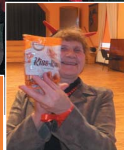
Maruta priecājas par loterijas vinnestu.