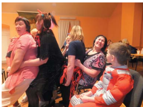
Prieks sita augstu vilni!