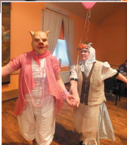
Cūciņa un kaziņa rotaļājas.