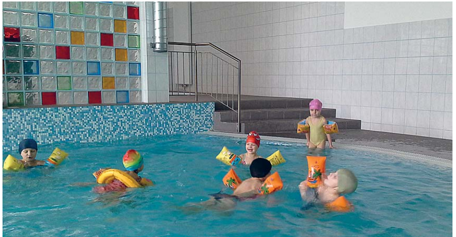
Mazie mētrienieši „Saulītes” baseinā.

Ar februāra mēnesi izmantojam arī iespēju apmeklēt peldbaseina nodarbības PII „Saulīte” Madonā. Bērniem nodarbības ļoti patīk. Tur ir silts, patīkams un ūdens seklākajā vietā ir 40 centimetri, dziļākajā 1 metrs. Nodarbība ilgst 30 minūtes. Tās laikā bērni sporta skolotāja vadībā veic dažādus vingrinājumus, izmantojot arī dažādu inventāru. Pēc nodarbības ūdenī vēl var uzkvēties aktīvajā rotaļu centrā,