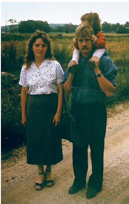
Mūsu ģimenei vienmēr patīcis pastaigāties.