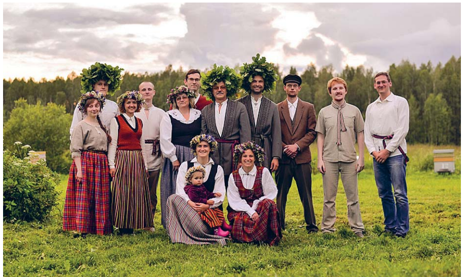
Ar ģimeni Līgo vakarā.

Skolotāja amats uzliek īpašas kvalitātes prasības arī ārpus darba laika. Šī sava veida misijas apziņa mācīt, izglītēt un būt par paraugu tētim turpinās arī tad, kad aktīvas skolotāja darba gaitas beigušās. Mūsu tētis joprojām ir pirmais cilvēks,