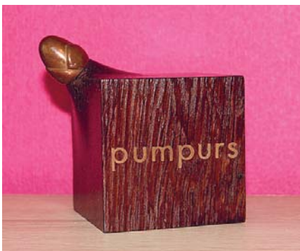
Balva „Lielais Pumpurs”.