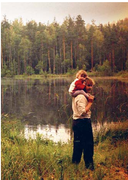
Pie meža ezera. Es tētīm plecos.

Par spīti lielajai darba slodzei, tētis vienmēr ir atradis laiku dažādiem mājas darbiem un saviem hobijiem – fotografēšanai, makšķerēšanai, dārza darbiem un ceļošanai. Jaukas bērnības atmiņas man saistās ar mūsu ģimenes kopīgajiem ceļojumiem. Latviju esam izbraukājuši krustu šķērsu, maz ir tādu vietu Latvijā, kur neesam bijuši. Mēs bieži vien sestdienas rītos pusstundas laikā izdomājam kurp braukt un dodamies ceļā. Tuvākās kaimiņvalstis Lietuva un Igaunija apmeklētas un iepazītas vairākkārt. Esam pabijuši daudzās Eiropas valstīs. Skaistākais bērnības ceļojums man saistās ar Čehiju, senatnīgo un grezno Prāgu, muzikālajām strūklakām,