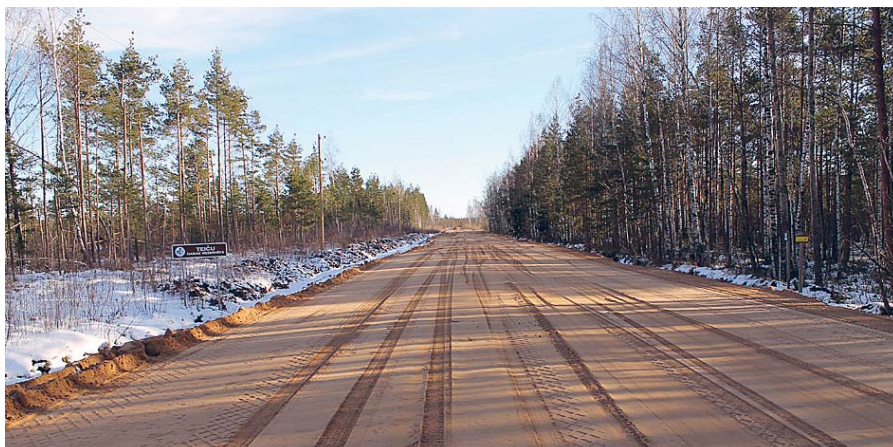
Drīz būs gatavs jaunais ceļš.

Aicinām iedzīvotājus būt aktīviem un diskutēt par aktuāliem jautājumiem, kā arī izteikt viedokļus, idejas un priekšlikumus par pagasta izaugsmes iespējām!