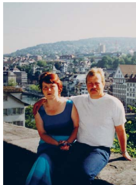
Ceļojuma laikā Šveicē, Cīrihē.