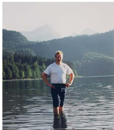
Pie kāda ezera Vācijā.

stalto Karlšteinas pili, stalaktītu alām un minerālūdens avotiem Karlovi Vari. Vēlāk apmeklētas citas valstis – Polija, Slovākija, Slovēnija, Austrija, Ungārija, Horvātija u.c. Horvātija ir īpaši skaista zeme, ne velti to dēvē par „pērlī” Adrijas jūras krastā.