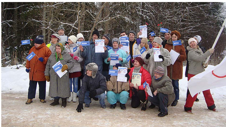
Sniega dienā visiem prieks.

būtu omulīgi, tika kurināts ugunskurs, pie kura varēja sasildīties. Sacensības sākās ar filiāles vadītāja svinīgu uzrunu un olimpiskā karoga pacelšanu. Klienti varēja piedalīties distanču slēpošanā, ragaviņu vilkšanā, atrakcijās bumbiņhokejā un jautrie cipari.