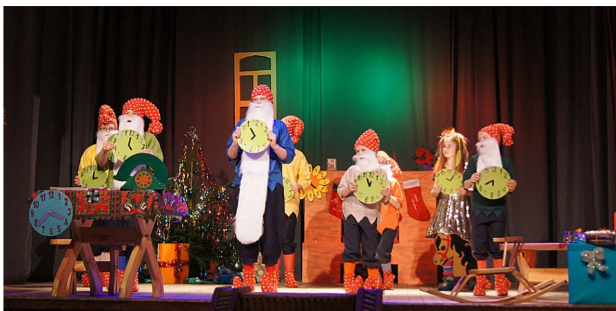
Ziemassvētki rūķu bodē.