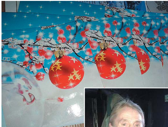
Šādas apsveikuma kartītes saņēma ikviens.

Ziemassvētku labdarības akcijas laikā tika sarūpētas Ziemassvētku dāvanas veciem un vientuļiem cilvēkiem visā Latvijā. Tradicionāli ziemas saulgrieži ir dāvināšanas laiks, tomēr bieži vien ikdienas steigā aizmirstam par būtisku, bet neaizsargātu sabiedrības daļu - veciem vientuļiem cilvēkiem, kuriem pateicoties varam dzīvot