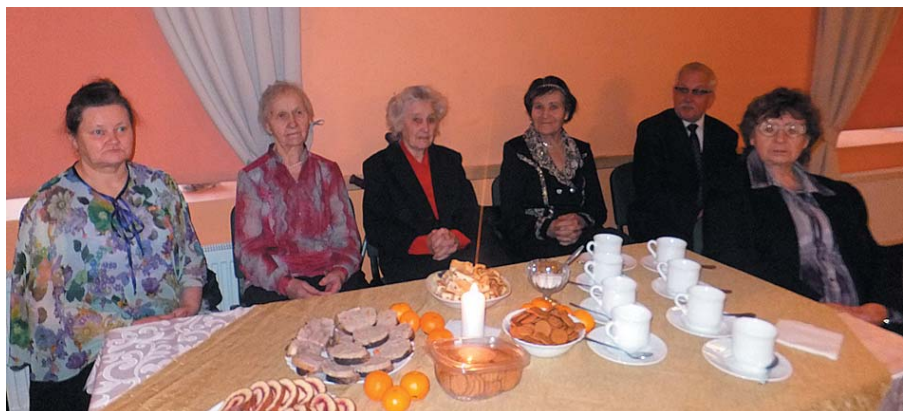
Klausāmie Barkavas meiteņu skaisto dziesmu izpildījumu.