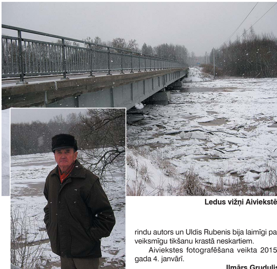
Ledus vižņi Aiviekstē.

Vislielākie plūdi gan bija 1962. gada augustā. Dienas laikā nolija neparasti spēcīgs lietus. No Aiviekstes izplūdušais ūdens sasniedza gandrīz vai Mūrnieku autobusu pieturu. Ļaudonā pārplūdušo grāvju ūdeņi izskaloja ielas bruģi. Pie Grostiņiem tika izšķobīti Aiviekstes dzelzceļa tilta balsti. Atmiņās notikums arī tāpēc, ka Mētrienā tajā dienā atklāja pīļu medību sezonu. Runcu ezerā vēl ūdens spogulis tad bija diezgan plašs. Iebraucām ar laivu. Taču tūlīt izbraucām atpakaļ. Lietus gāze bija neredzēta, pērkons ļoti bargs, zibeņoja nepārtraukti. Laivas airētāji – šo