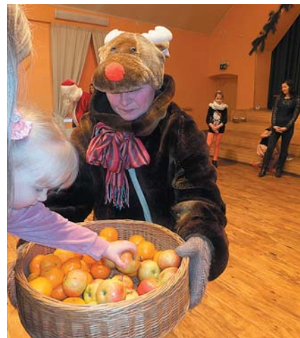
Briedis neskopojās ar āboliem un mandarīniem.