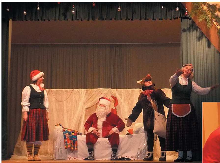
Bērniem tika dāvāta teātra izrāde.

Savukārt mazajiem mētrieniešiem dāvanā bija sarūpēta teātra izrāde „Rūķis gražojas”. Neparastāk gan bija redzēt, kā „bērnu” izrādes lomās iejutās Mētrienas tautas nama amatieteātra kolektīva dalībnieki. Skaisti! Bērniņi tika cienāti ar mandarīniem, āboliem un piparkūkām. Visi dejoja, gāja rotaļās un, iesēdušies paša Ziemassvētku vecīša klēpī, skaitīja iemācītos dzejoļiņus, dažs pirmo reizi savā mazajā mūžiņā.