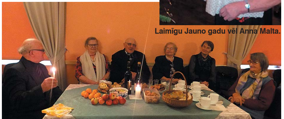
Kopā pie svētku galda.