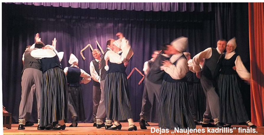
Dejas „Naujenes kadrillis” fināls.