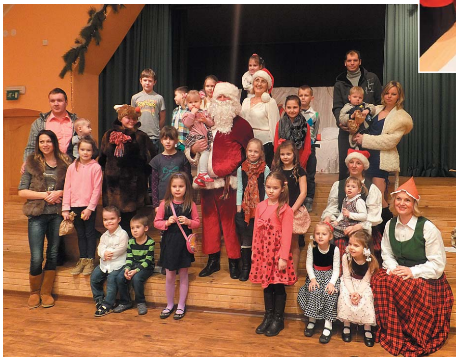
Kopbilde ar Ziemassvētku vecīti.