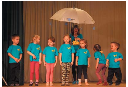
Sveiciens no mazajiem.