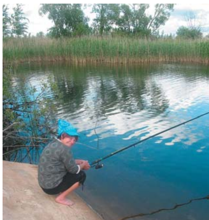
Pie Lubāna ezera diķiem.