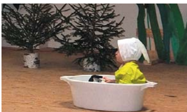
Mazie zaķēni gaida savu priekšnesumu.