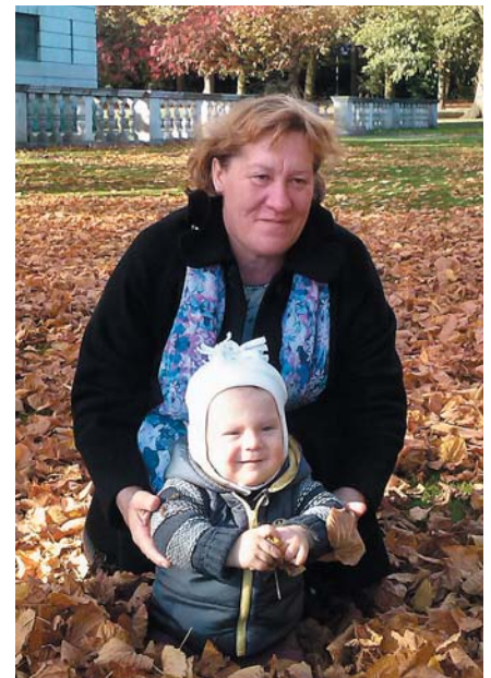
Kopā ar mazdēliņu pastaigā.

varu griezties, ja ir slikti un grūti. Draugi un ģimene ir mūsu lielākās vērtības tālumā. Kā arī vienmēr varu atgriezties mājās, kur mani gaidīja un gaida mana mīļā mammiņa! Mammiņa! Daudz laimes Tev dzimšanas dienā! Vēlam Tev veselību un sūtām miljonus buču!