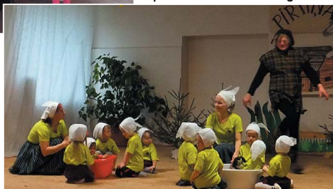
Bērni un audzinātājas izspēlēja Zaķīšu pirtiņu.