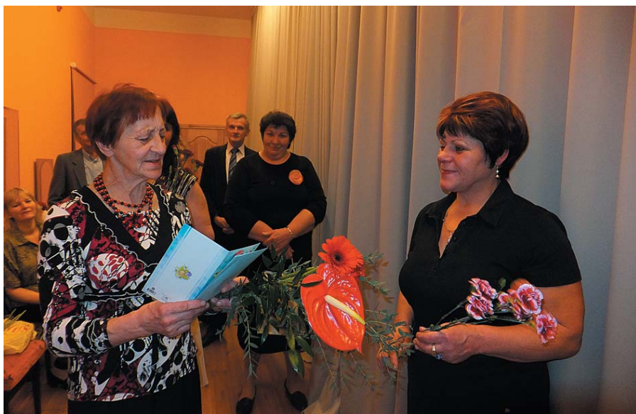
Ļenu jubilejā sveic deju kolektīvi.