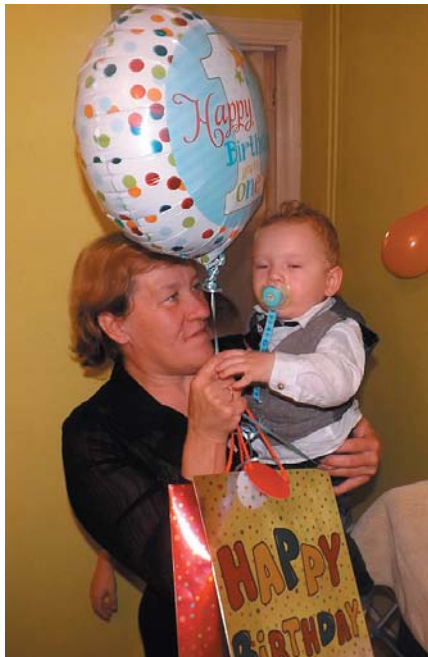
Hip – hip – urrā!

Viņa bija tāda pati kā tagad, nemaz nav mainījusies, tik pāris vecuma pazīmes nākušas klāt. Manā bērnībā mamma bija tā, kas ļāva izbaudīt ar visu sirdi. Dažreiz gan tika pateikts kas stingrāks arī. Atceros vasarā mamma gribēja likt man ravēt dārzu kopā ar viņu un vecmammu, kamēr pārējie bērni vai nu skraida, vai vēl guļ. Bet vec-