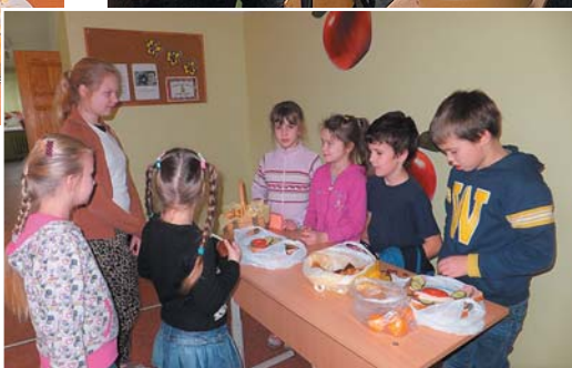
Andelēšanās rit pilnā sparā.