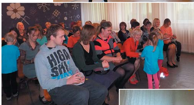
Cieņiem dāvājām dzērveņu ievārījumu.