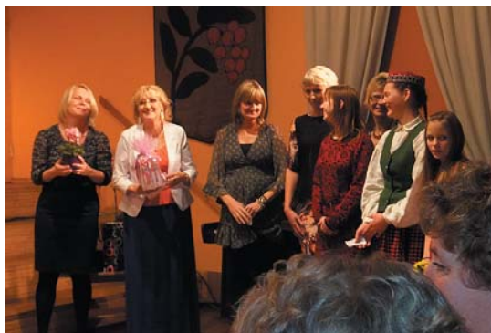
Sieviešu koris „Jūsma” dejojām dāvāja kāju krēmus.