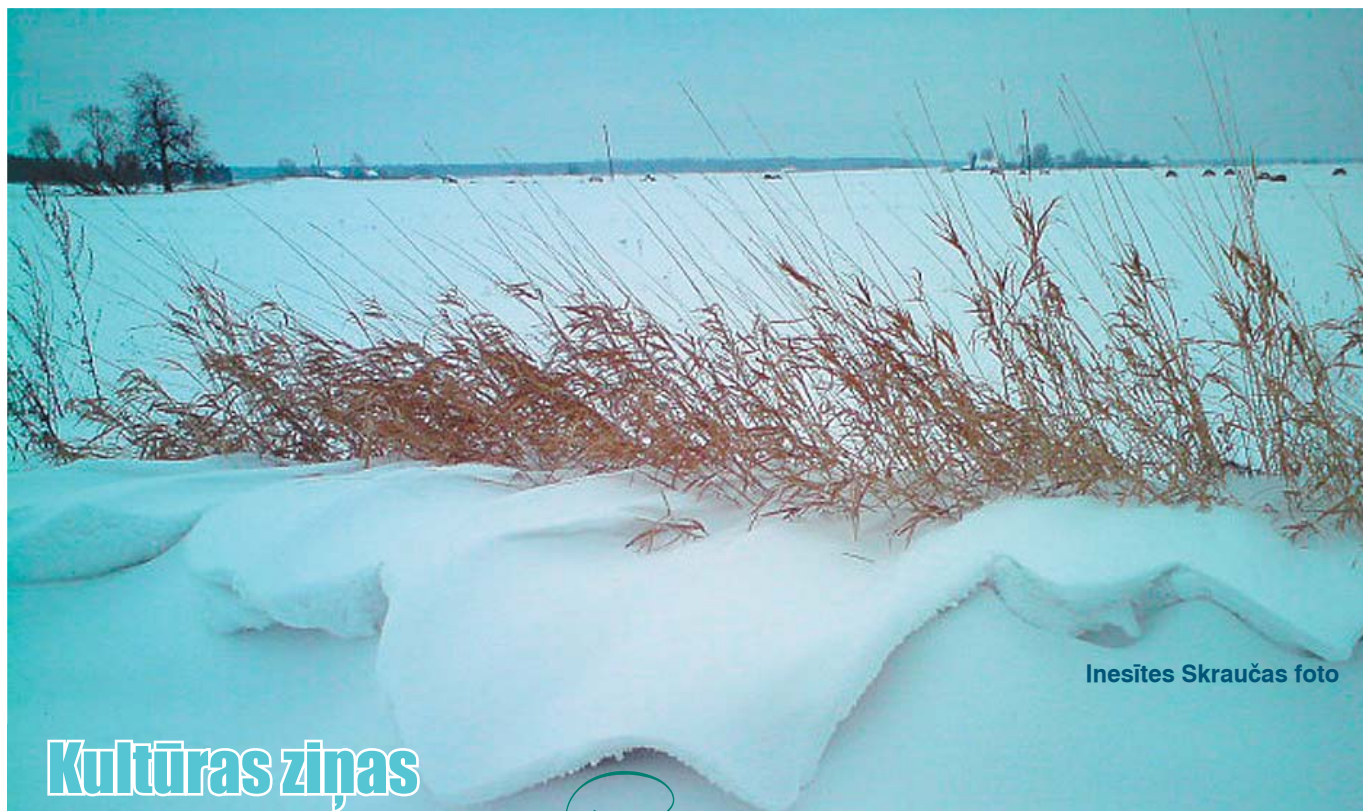
Inesītes Skraučas foto