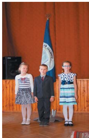
2.kl.godasardze pie skolas karoga