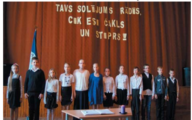
5.un 6.kl.nodod solījumu