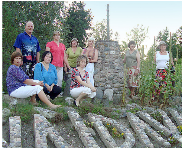
Kursu dalībnieki akmeņu parkā „Vaidavas” Lubānas novadā.