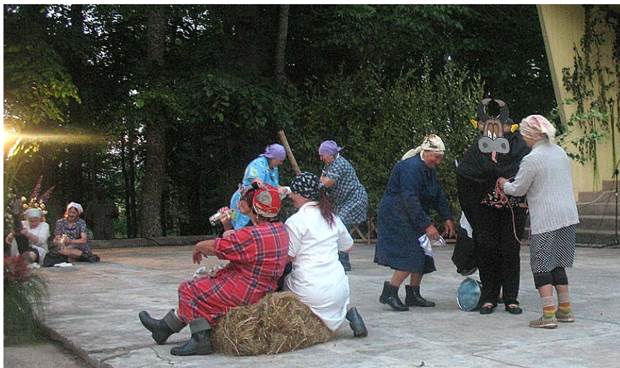
Čī, čā, gotiņa!