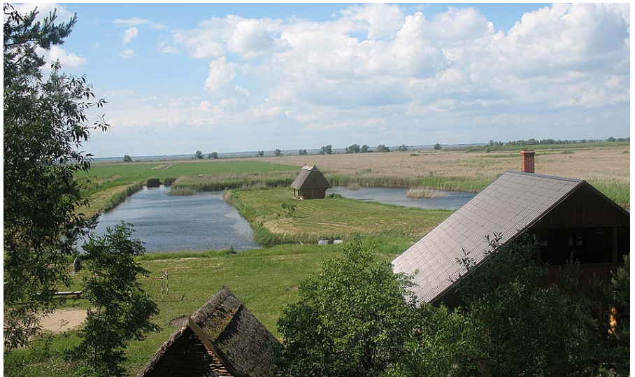
Skats uz bijušo jūru.