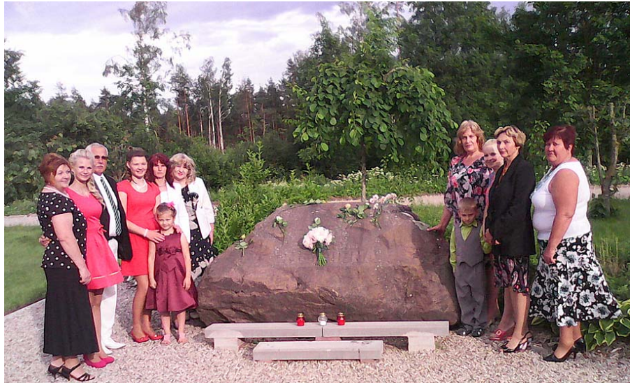
Pie piemiņas akmens visiem, kas dzīvojuši Mētrienā.