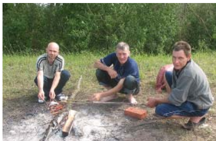
Būs garda maltīte.

Latgales sādžās jeb ciemos, bet cieši gar ezera seno krastu. Zvejnieku ciema iespaidu pastiprina vēju sanestie smiltāji un kāpu priedes, kā arī dažām mājām sastopamie pašu saimnieku darinātie niedru jumti. Nagļu pagasta tūrisma informācijas centra vadītāja un viesmīlīgā Zvejnieku māju saim-