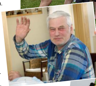
Optimisms – kvalitatīvas dzīves pamats.