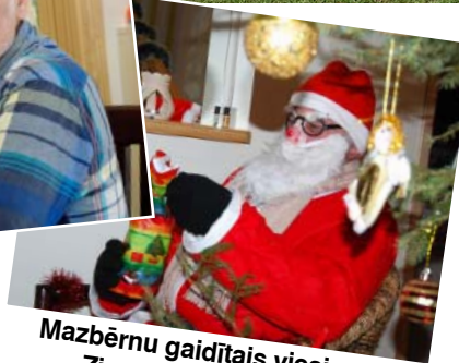
Mazbērnu gaidītais viesis – Ziemassvētku vecītis.

brīžos uzspēlēt bumbu ar bērniem un mazbērniem.