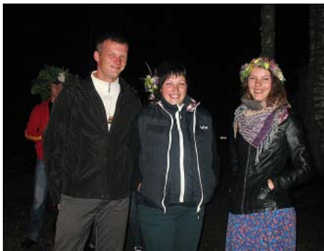
Līgo nakts burvība.

iecerē, ka varētu birzīti iežogot, lai to varētu izmantot arī Mētrienas pamatskolas pirmsskolas grupas audzēkņi. Paldies visiem, kas kopā ar mums svinēja vasaras saulgriežus Mētrienā”.