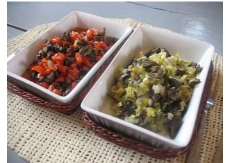
Našķi no gliemežiem.