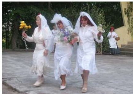
Ak, Jāni, precē mani!