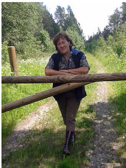
Esmu vēl bērņības pusē.

Pirmais gājiens bija uz kapiem, noliku puķes saviem mīļajiem, jo krievu kapsētās nav kapusvētku, bet Vasarsvētkos iet uz kapiem. Diemžēl mēs bijām vienīgās, un nelieloties – manas dzimtas kapi bija vai vie-