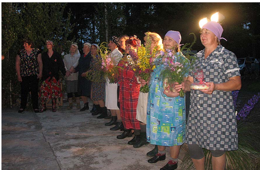
Saulgriezes fināla deļā!