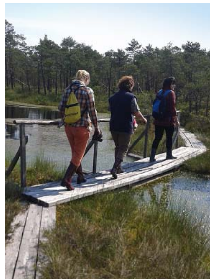
Baudām purva dabu.

Eugēnija Jermacāne Foto no personīgā arhīva