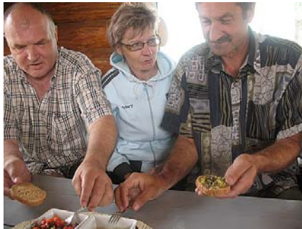
Un ēdiena baudīšana var sākties.

Nogriežamies no zemes ceļa pa vēl mazāku, bet labi iebrauktu ceļu, un braucam uz Īdeņas ciemu, kas atrodas Lubāna ezera dienvidaustrumu krasta augstienē. Ciems daudzus gadsimtus bijis no apkārtnes nošķirts, no vienas puses – Lubāns, no citām – zemas pļavas, purvi un meži. Nosaukums Īdeņa ir latgaliskā vārda iudini (ūdeņi) pagalam neveiksmīgs latviskojums, taču īdeņieši (iudiniši) par to nesumst. Īdeņa ir unikāla ar to, ka tas ir vienīgais Latgales zvejnieku ciems un zvejniecība ir īdeņiešu pamatnodarbošanās jau kopš aizvēsturiskiem laikiem. Arī ciema sētas ir īpatnēji izvietotas, ne gar ceļu – kā parasti