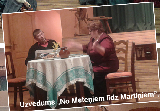
Uzvedums „No Metenjiem līdz Mārtiniem”.