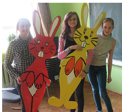
7. klases meiteņu krāsotie zaķi.