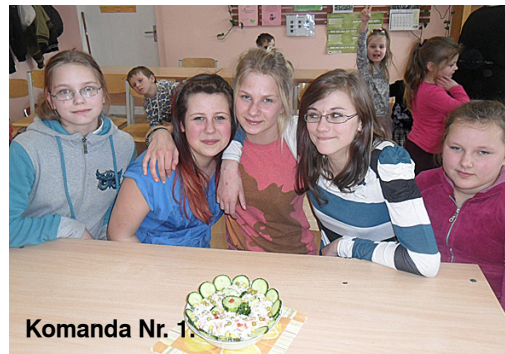
Komanda Nr. 1.