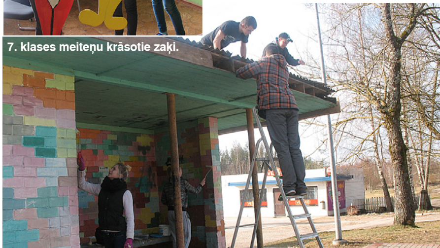
Zēni pielabo jumtu, meitenes krāso.