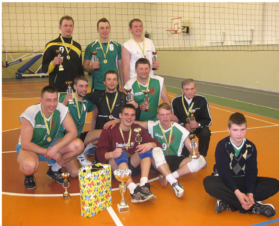
Mūsu „Zelta Komanda”!