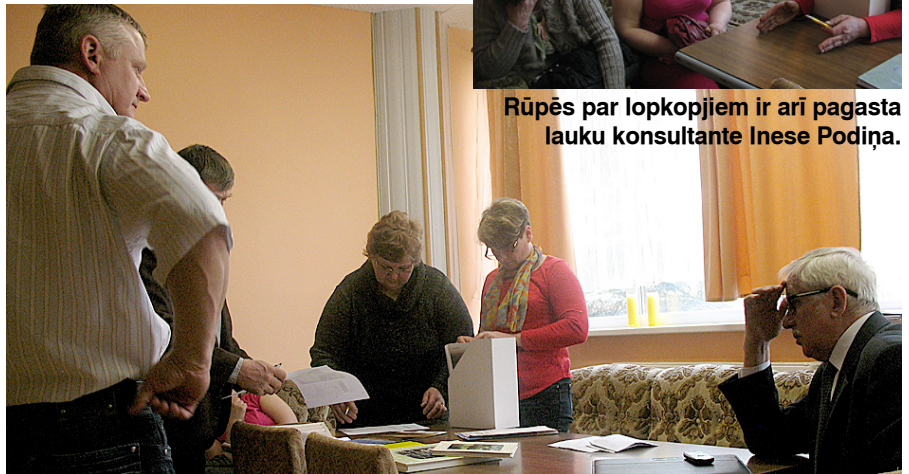
Jautājumu un neziņas daudz.