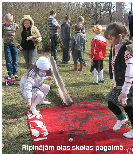
Ripinājām olas skolas pagalmā.

Atskatīsimies, kā svinējām Liendienas Mētrienas pamatskolā un Mētrienas tautas namā, kur tika rādīts muzikāls uzvedums „No Metenjiem līdz Liediem”. Uzvedumā piedalījās visi tautas nama pašdarbības kolektīvi un Mētrienas pamatskolas pirmsskolas grupas audzēkņi.