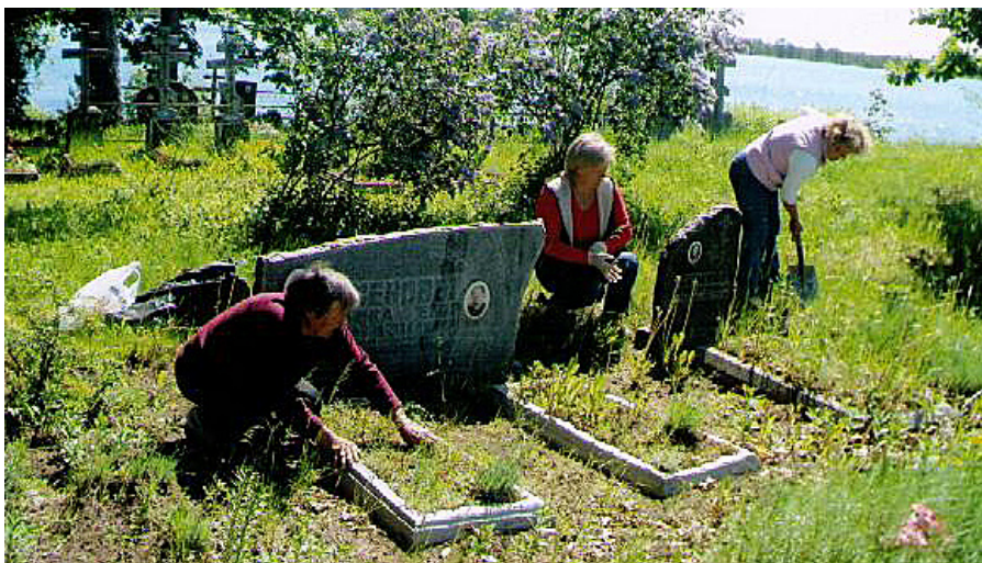
Apkopjot kapiņus Siksalā.