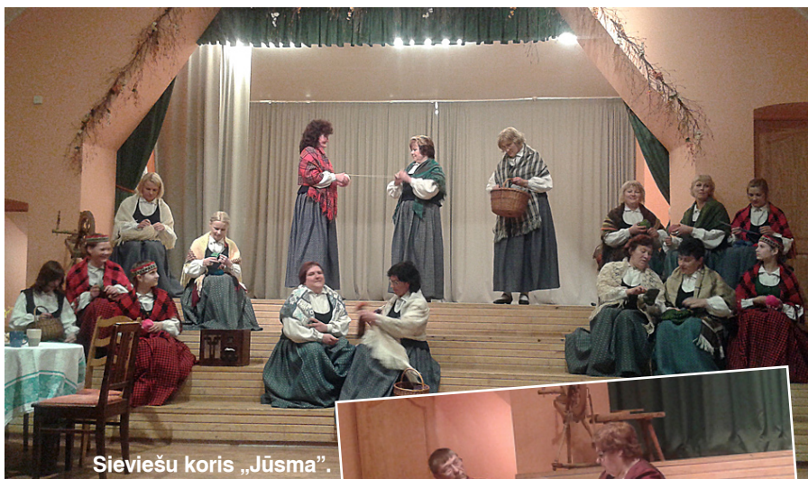
Sieviešu koris „Jūsma”.