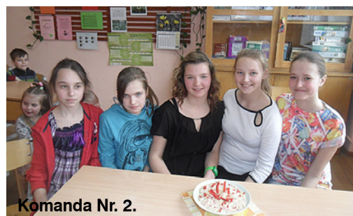
Komanda Nr. 2.