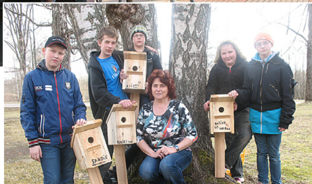
5. klases gatavotie putnu būrīši.