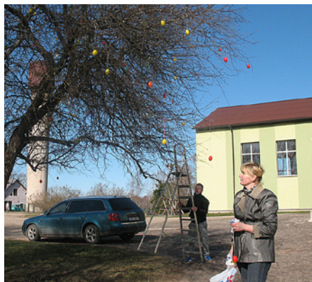
7. klases skolēnu vecāki un brāļi rotā Lieldienu koku.