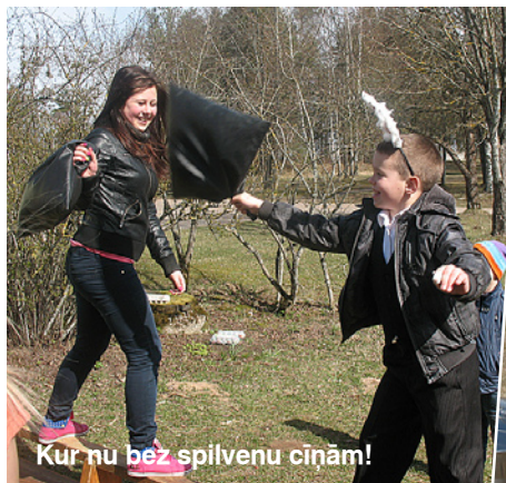
Kur nu bez spilvenu cīņām!