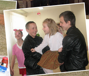
Skolas vecāko klašu zēni izšūpo maziņās meitenītes.