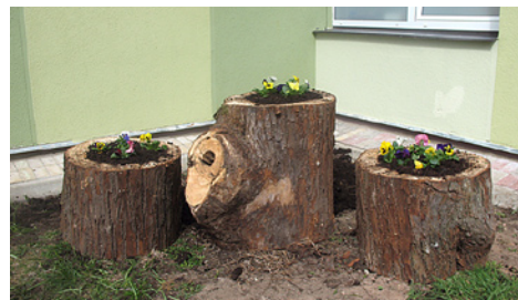
6. klase stādīja atraitnītes.