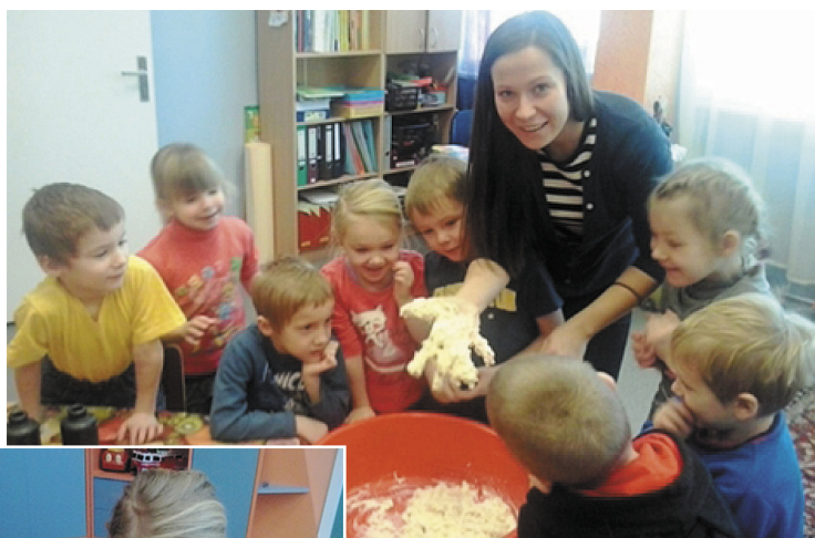
Re, kāds cimds no sāls mīklas...

Ir atgriezušies gājputni un modušie no ziemas miega visi kukaiņi un dzīvnieki. Bet tas nenotiek tāpat vien. Lai aizbaidītu zimu un nāktu pavasaris, ir jāsauc talkā Metenis. Visi kopā gan „Saulsazākēni”, gan „Cālēni” devāmies uz skolas sporta zāli. Rībinādami, brīkšķinādami modinā-