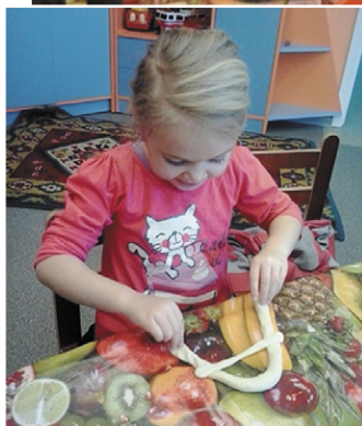
Keita veido burtiņus.