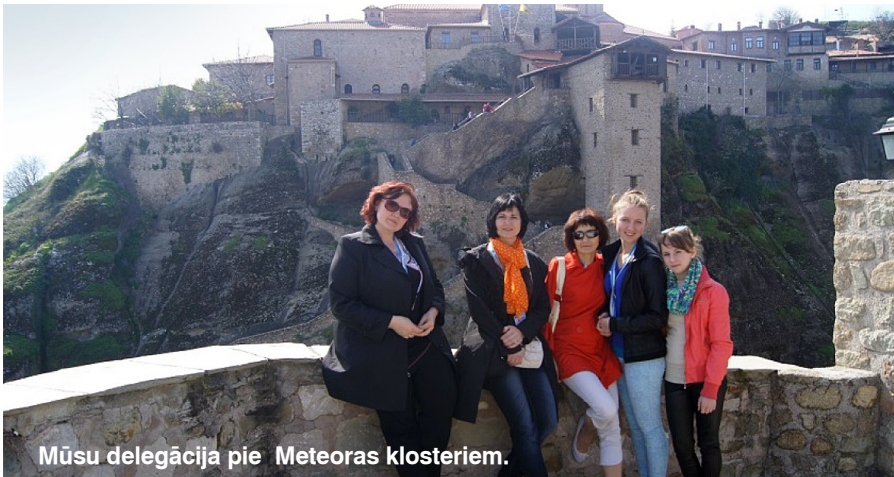
Mūsu delegācija pie Meteoras klosteriem.