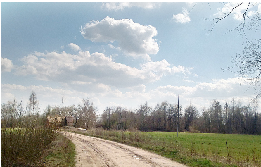
Ceļš uz mājām.

Informāciju sagatavoja kultūras darba organizatore Ilze Melngaile