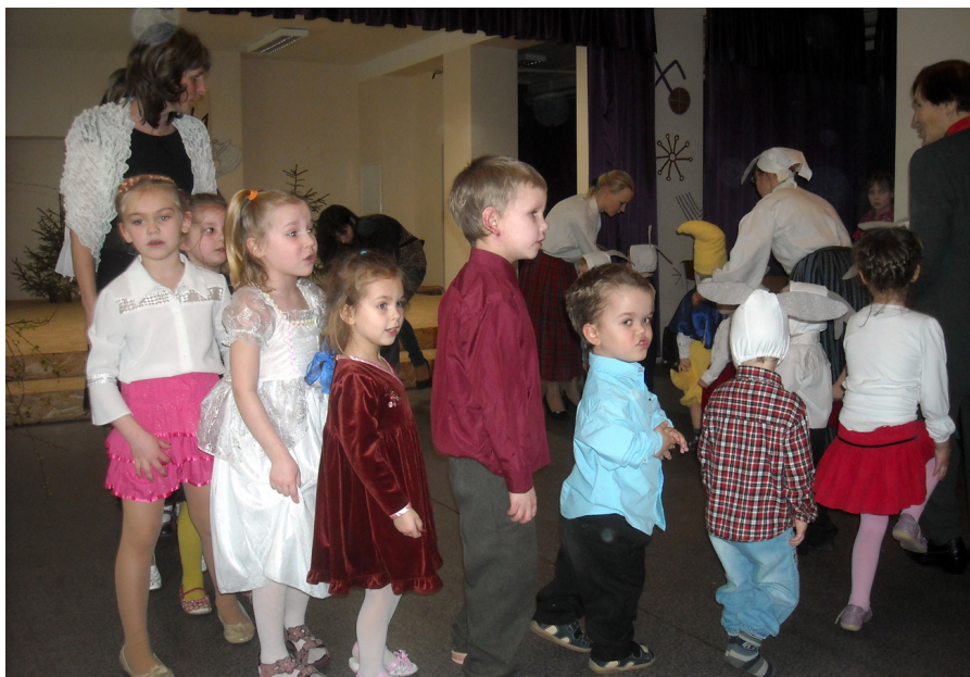
Ejam jautrā rotaļā.