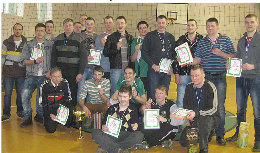
Mētrienas kausa volejbolā dalībnieku komandas.

Kā parasti, februāra pēdējā sestdienā notiek Mētrienas kausa sacensības vīriešu volejbola komandām. Tās notiek kopš 1972. gada. Šogad 22. februārī uz turnīru Mētrienas pamatskolas sporta zālē pulcējās četras komandas. Piektā aicinātā – Ošupes pagasta komanda – neieradās sakarā ar spēlēm tajā pašā dienā novada čempionātā. Visas četras turnīra komandas bija spēkos ļoti līdzīgas un parādīja skaistu, skatītājiem tikamu spēli. Situācija izrādījās labvēlīgāka Mētrienas komandai, kurai Ramatas spēlētāji nodeva ceļojošo kausu. Otrajā vietā Atašienes komanda, bet trešie palika spēcīgi Mazsalacas novada Ramatas pagasta spēlētāji. Lai gan Jēkabpils komanda ieņēma ceturto vietu, spēles prasmes un tehniskajā izpildījumā tā neatšķīrās no pārējām vienībām. Vienkārs nepalaimējās. Sacensības noritēja korektā gaisotnē. Galvenā tiesnese Līga