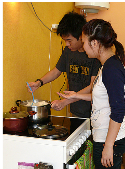
Bank un Irada vāra rīsus.