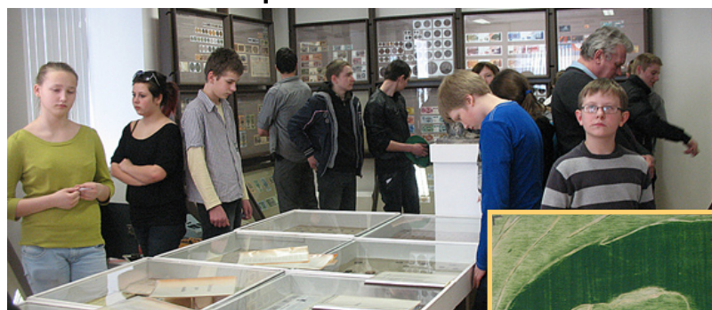
Skolēni apskata izstādi.

No 17. līdz 31. martam Madonas Novadpētniecības un mākslas muzejā varēja skatīt Madonas, Cesvaines, Ērgļu, Lubānas un Varakļānu novadu skolēnu lietišķās mākslas neklātienes konkursa „Pavasaris” darbu izstādi.