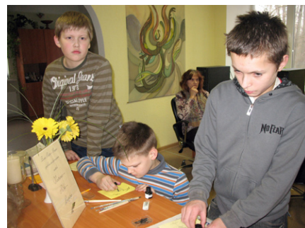
Arī zēni nebija vienaldzīgi.