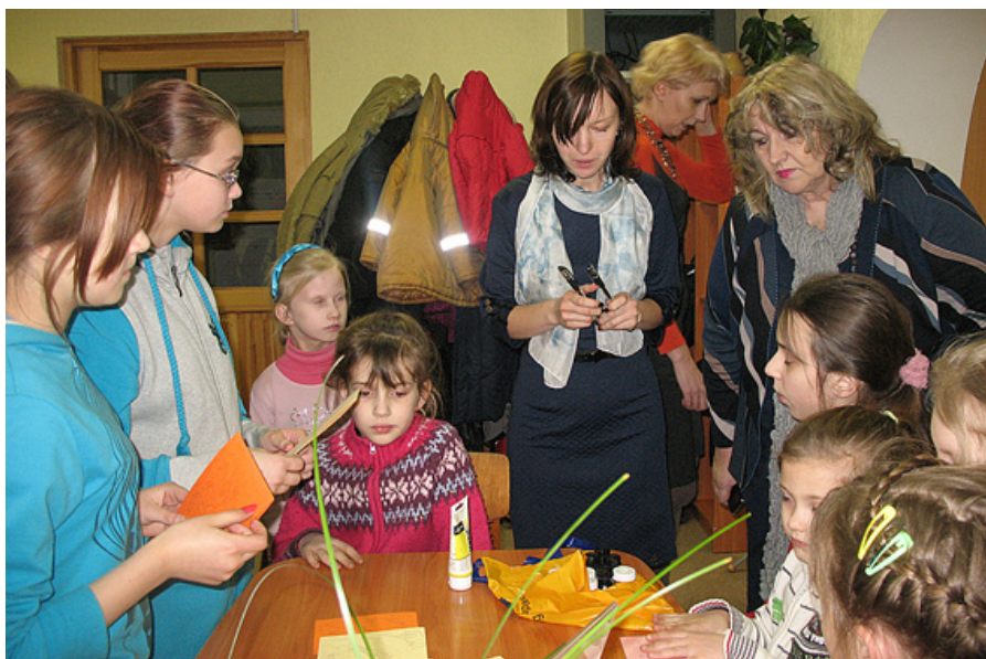
Darbs tiek ierādīts sākumskolas skolēniem.