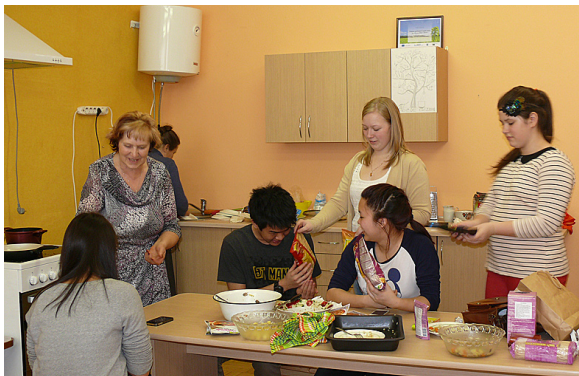
Nelielas dāvanīņas mūsu ciemiņiem.

Pa šiem septiņiem mēnešiem visi apmaiņas studenti ir piedzīvojuši daudz. Daudzi ceļo pa Latviju un iepazīst to, kā arī vairāki skolnieki brauc arī uz ārzemēm, jo izdevība ir jāizmanto.