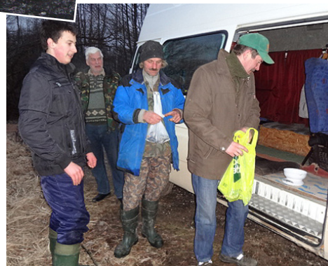
Notiek lomu svērsana.