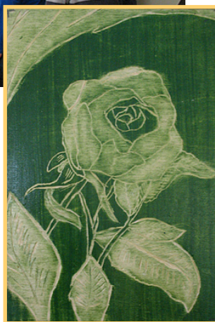
5. klases skolnieka Ričarda Strogova darbs „Pavasaris aiz loga”.