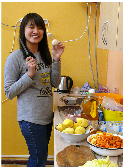
Moji sagatavo dārzeņus.