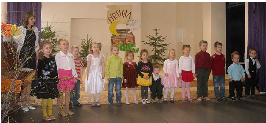
Dziedam savām vecmāmiņām.