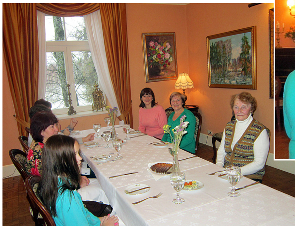
Muižas mājīgajās telpās.