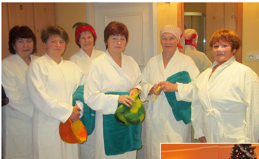
Gatavas doties uz SPA.