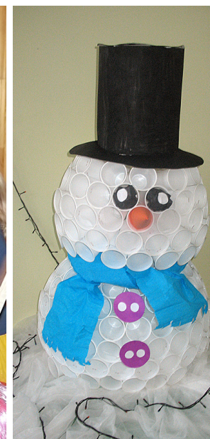
Pirmsskolas audzēkņus ik rītu sagaida balts un tīrs sniegavīrs