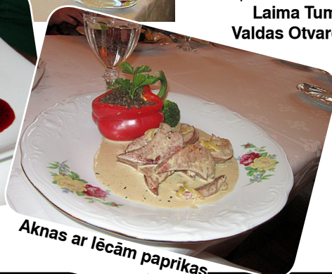
Aknas ar lēcām paprikas podiņā.