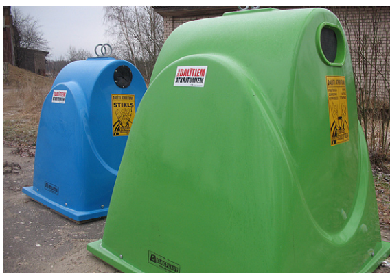
Atkritumu konteineri Mētrienā.