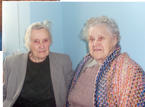
Pie Birutas Seržānes.

Vēlam, lai pansionātu darbiniekiem pietiktu spēka un izturības rūpēties par veciem cilvēkiem. Gai-