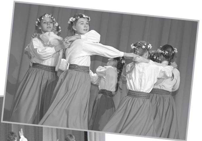
„Resgaļu” jaunā maiņa. Nākamajā koncertā meitenēm pievienosies arī puīši.