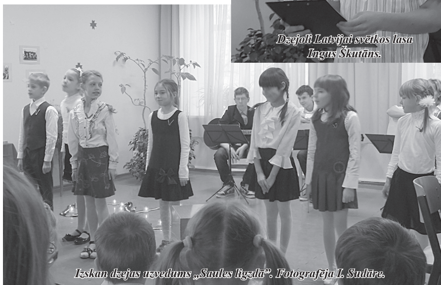
Izskan dzejas uzvedums „Sauls līdzdā”.