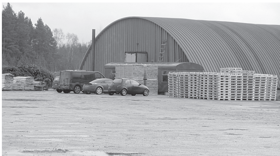
Saražotā produkcija uz laukuma ilgi neaizkavējas.

Vaicāti par sadzīvi pagasta centrā Biksērē, abi brāļi atzīst, ka vieta ir laba, skaista, izdevīgs ģeogrāfiskais stāvoklis. Bez darba un mājām visnepieciešamākā lieta noteikti būtu sporta zāle, kur lai-