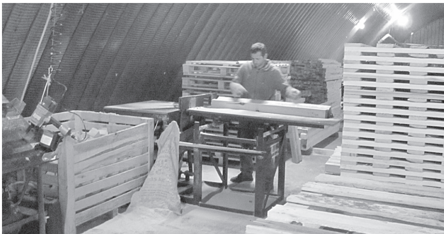
Uzņēmumā strādā prasmīgi darbinieki.