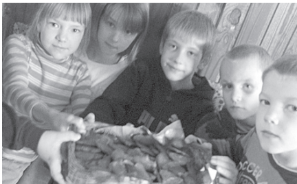
Pirmssvētku nedēļā 1. un 2. klases bērni izcepuši ekoloģiskas un garšīgas piparkūkas.