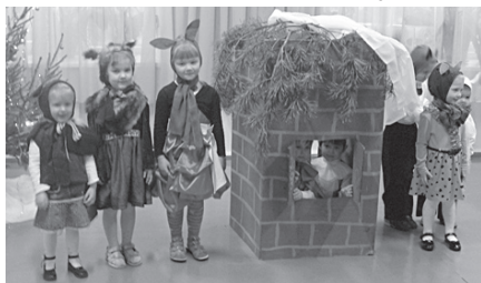
18. decembrī eglīte mazākajiem – pirmsskolas grupiņai.