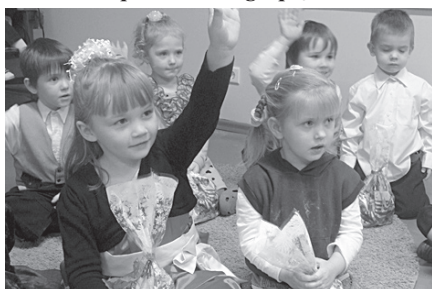
Kaut saldumu tūtas jau saņemtas, tāpat vēl visa uzmanība Ziemassvētku vecītim.