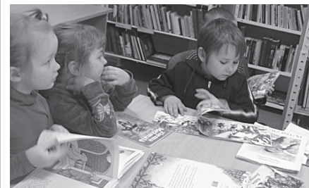
Nākamie lasītāji skatās grāmatas par Ziemassvētkiem.