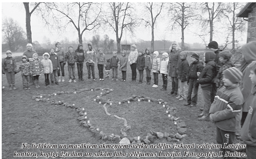
No lielākiem un mazākiem akmeņiem svētku nedēļas izskaņā veidojam Latvijas kontūru, kopīgi dziedam un sakām labā vēlējumus Latvijai.