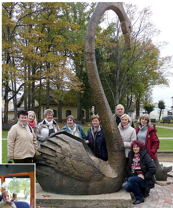
Pie Gulbenes gulbiša.

svēcītes par ģimeni, labklājību, veselību, aizsardzību un par mūsu aizgājušo tuvinieku dvēselēm... Baznīcai bija ļoti patīkama aura, arī atrašanās vieta jauka – skaista