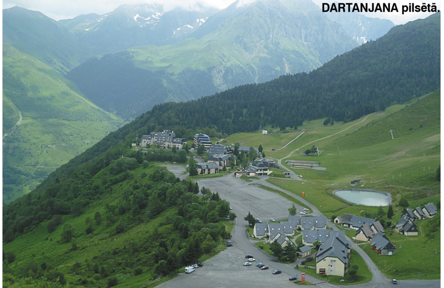
Skats uz Pyrenees kalnu apdzīvoto ieleju.

gām cenām. Domāju, ka tā ir laba ideja, lai radītu tāda veida organizāciju arī mūsu pagastā. Tagad runāju ar „Emmaus” pārstāvjiem Francijā un ļoti ceru uz sadarbību.