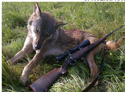
Roziša nomedītā vilcens.