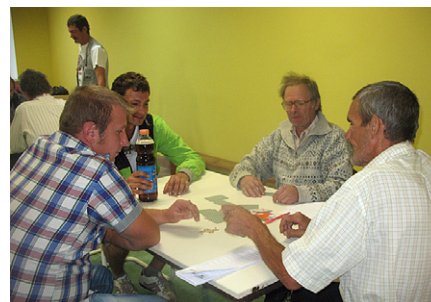
Mirkļis no spēles.