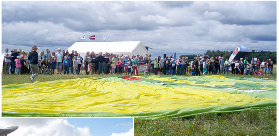
Sapnis redzēt gaisa balonu tā arī palika tikai sapnis.

Īpaši tika gaidīti panorāmas lidojumi. Pirmajiem tas prieks tika jaunajam pārim