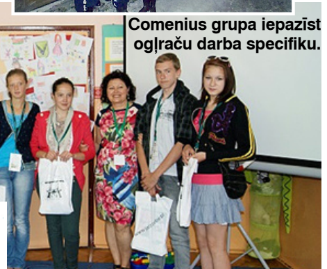
Skolēnu delegācija Polijā.