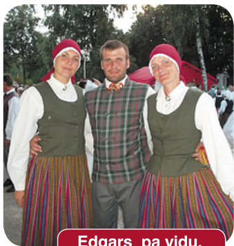
Edgars pa vidu.