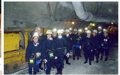
Comenius grupa iepazīst ogļraču darba specifiku.