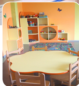
Pirmsskolas izglītības iestādes telpas.