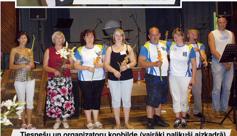
Tiesnešu un organizatoru kopbilde (vairāki palikuši aizkadrā).