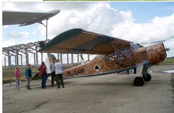
Taču šim lidaparātam vējs netraucēja pacelties gaisā un vizināt visus, kam vēlēšanās.

no Priekuļiem, kas 19. jūlijā teica viens otram „jāvārdu”, kā nākamie savu dzimto vietu no putna lidojuma, varēja vērot Degumnieku un Dzelzavas pamatskolu audzēkņi, kas mācību darbu pagājušajā