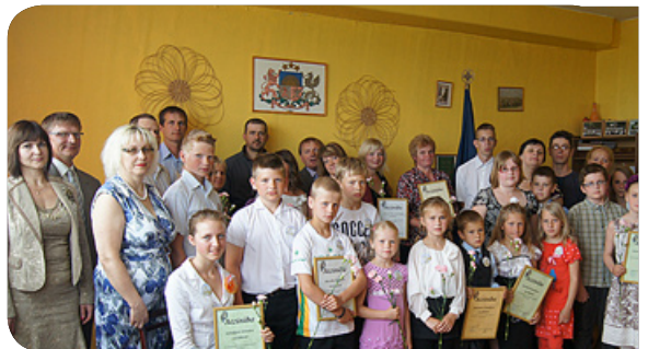
Skolas labinieku un viņu vecāku godināšanas pasākums pie skolas vadības 2012./2013. m.g.