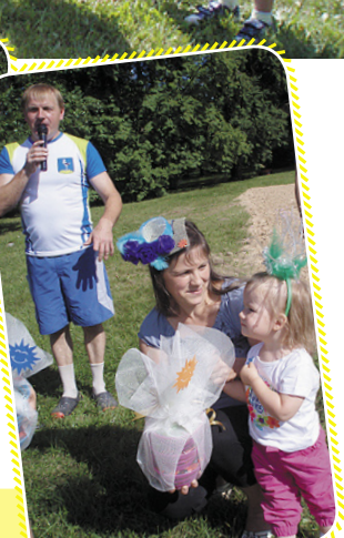
Pašdarināto, neparasto galvassegu parāde.