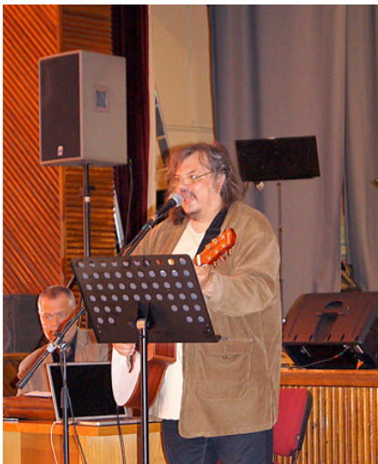
Apbalvošanas pauzes aizpildīja mākslinieki no Rīgas.