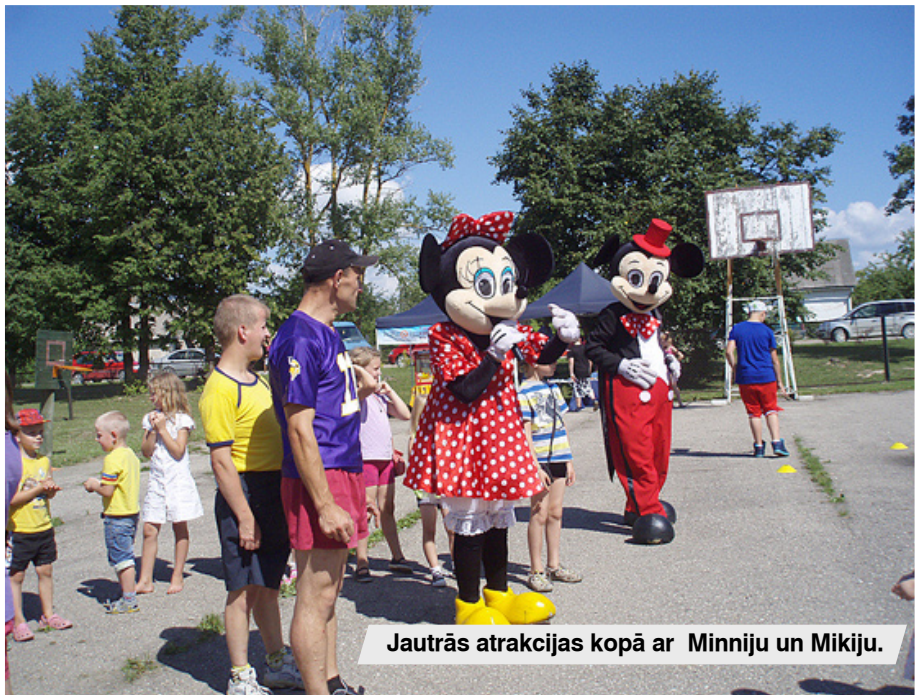
Jautrās atrakcijas kopā ar Minniju un Mikiju.