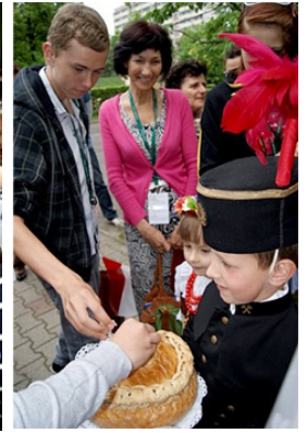
Tiekam viesmīlīgi sagaidīti pirmsskolas izglītības iestādē Polijā.