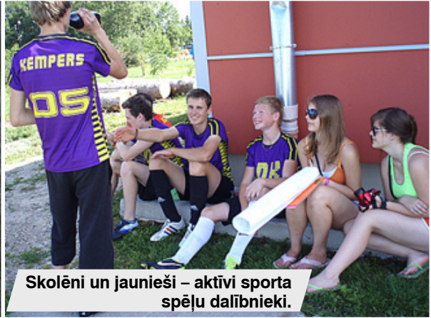
Skolēni un jaunieši – aktīvi sporta spēļu dalībnieki.