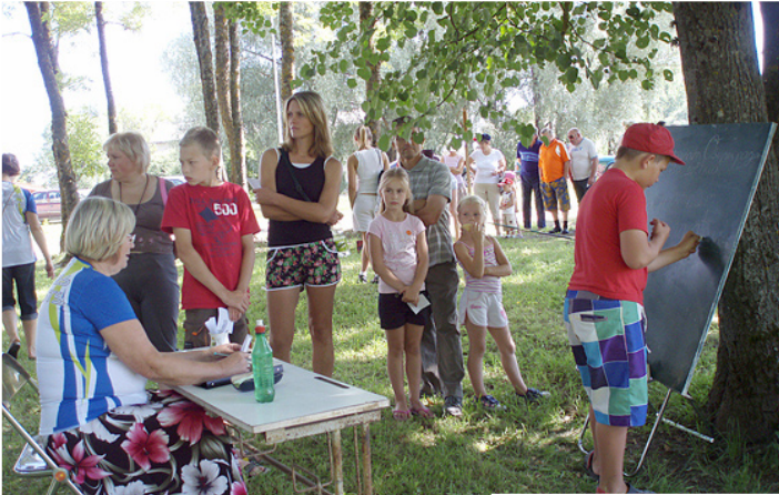
Individuālajā disciplīnā „Abrocis” jāprot raksīt ar abām rokām.