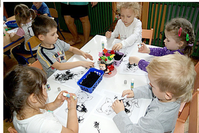
Vērojam izglītības procesu.