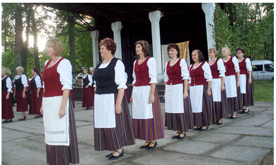
Deju grupa „Orhidejas” kopā ar Lubānas un Cēsaines deju kolektīviem deju „Sievu deju”.

Svētku koncertā uzstājās vieskolektīvi: Priekuļu dāmu deju grupa „Mežrozīte”, Lejasciema jauktais vokālais ansamblis, Degumnieku kultūras nama dāmu deju grupa „Orhidejas”, Cēsaines senioru deju grupa „Kamenes” un Lubānas novada senioru amatiermākslas kolektīvi.