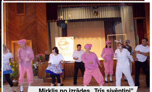
Mirkļis no izrādes „Trīs sivēntiņi”.