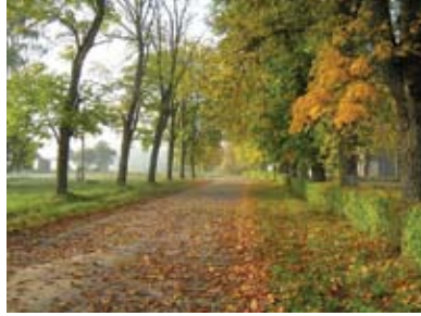
Skolas ošu - liepu gatvē absolventu pēdas meklējamas tuvākā un tālākā laikā.