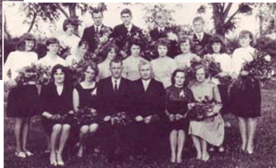
1967. gadā skolu beidz 10 skolēni.