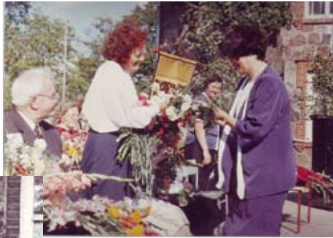
1953. gada absolvente, tagad Latvijas skatuves un kino leģenda Olga Dreģe sveic savu skolotāju Annu Lūsi.