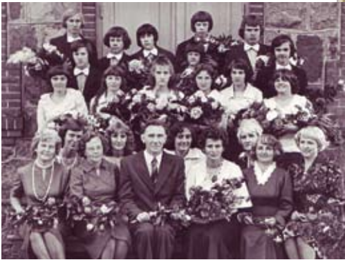
Skolas 1979. gada izlaiduma klase kopā ar skolotājiem.