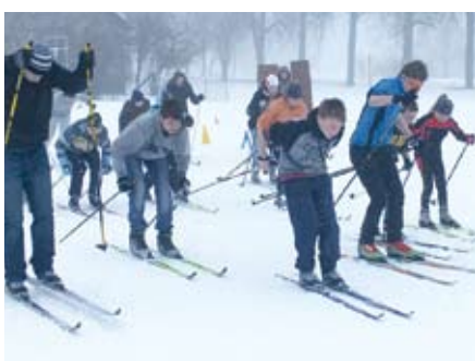
Kopīgais starts 2013. gada februārī.