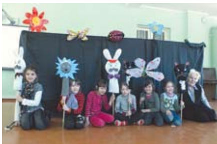
Par teātra spēlēšanas vērtībām un ieguvumiem skolotāja G. Apele teic, ka bērniem šī darbošanās veido gan stāju, gan prasmi uzstāties publikai, gan vingrina izteiksmīgu runu un pareizu dīkciju. Gatavojot izrādes un spēlējot tās skatītājiem, mazie aktieri attīstās kā fiziski, tā emocionāli un intelektuāli. Kopīgā darbošanās mēģinājumos un izrādēs ir saskarsmes apgūšanas un komandā strādāšanas skola.

Speciālizlaidumu "Sarkaņu skolai 110" sagatavoja Inese Sudāre