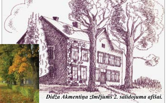
Didža Akmentiņa zīmējums 2. salidojuma afišai.

Lūk, vecākiem ir šodien as'ras sejā, Jo pieaudzis tiem liekas viņu bērns, Kā putnēni tie dodas dzīves ceļā Un pirmo skolu sirdī aiznes līdz.