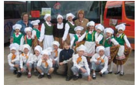
Skolas dejotāji novadu deju svētkos Gulbenē 2012. gada pavasarī.