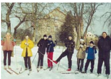
9. klase sporta stundā 2001. gada martā.