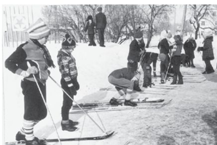
Slēpotāji gatavojas skolas meistarsacīkstēm 1982. gada februārī.