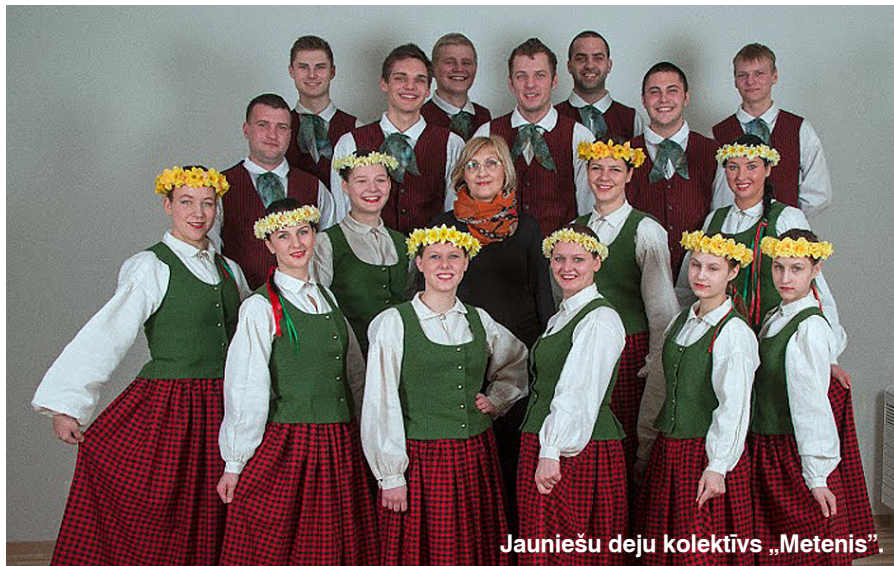
Jauniešu deju kolektīvs „Meteņi”.