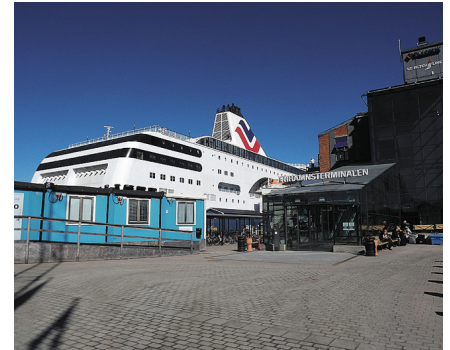
Pasažieru osta Frihamnen.