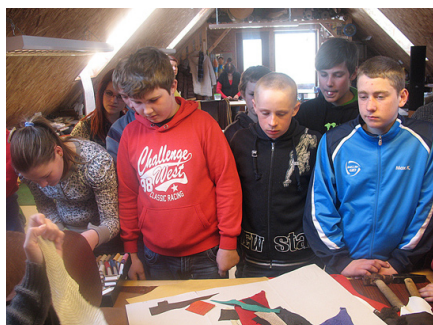
Ādas izstrādājumu darbnīcā.