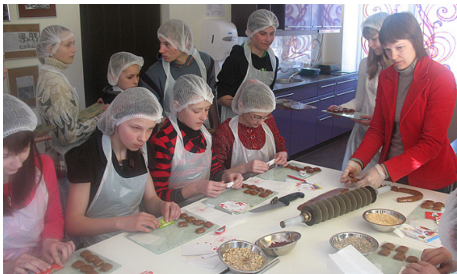
Gatavojam konfektes „Gotiņa”.

patiešām ietin ar rokām. Pašu gatavotās konfektes drīkstējām vest uz mājām.