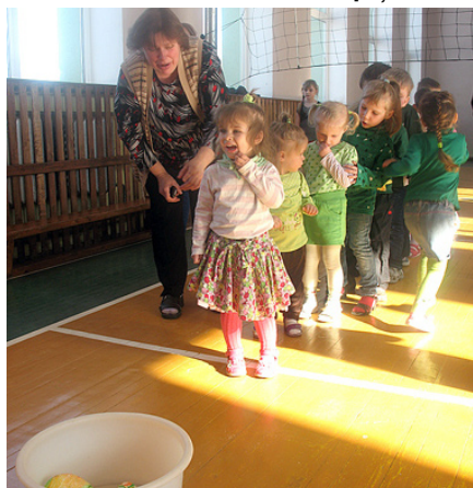
Pirmsskolas grupiņas audzēkņi rindā uz oliņu mešanu.