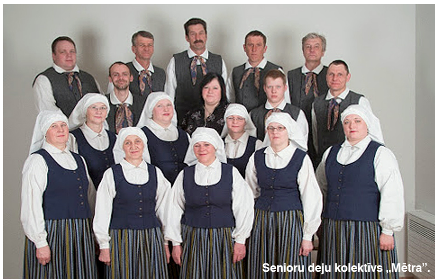
Senioru deju kolektīvs „Mētra”.