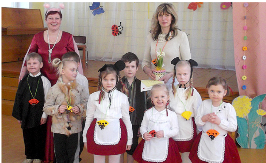
Pēc teātra spēles Mārcienā.

Pēc Lieldienām, 5. aprīlī, viesus ciemos aicinājām mēs. Šoreiz ļoti gaidītas bija mūsu vecmāmiņas. „Vecmāmiņu dienas” pasākumā centāmies iepriecināt visus ar savām dziesmām, dejām, dzejoļiem, teātra spēli. Īpaši aizkustināti bērni jutās, kad rotaļās iesaistījās arī vecmāmiņas. Priecājāmies redzēt katru vecmāmiņu, kura atrada laiku un spēku, lai apciemotu mūs šajā dienā. Laimīgs katrs bērniņš, kuram bija sava vecmāmiņa, jo ne jau katram