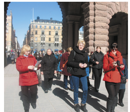
Pastaiga pa vecpilsētu.