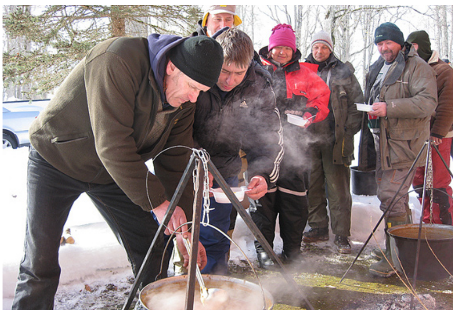
Zupai bija ļoti liela piekrišana.