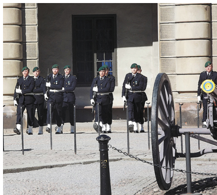
Sardzes maiņa pie Karalpis.