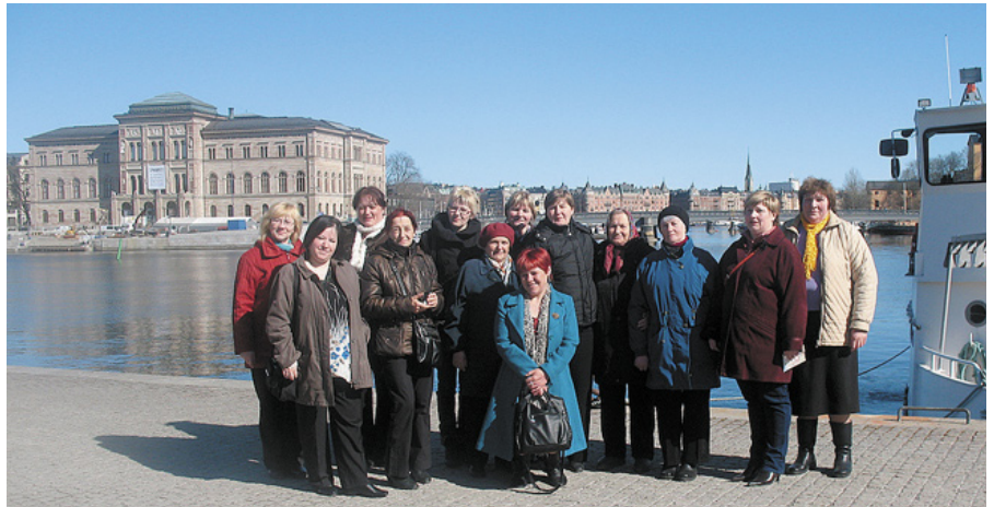
Viena ko kopbildēm.