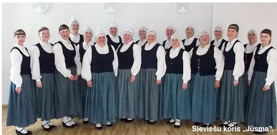
Sieviešu koris „Jūsma”.