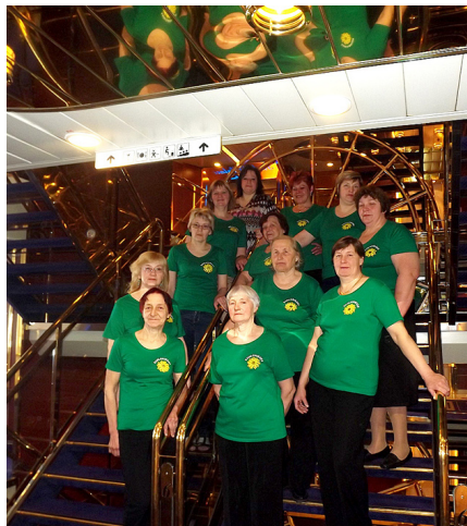
„Saulgriezes” uz prāmja Romantika.