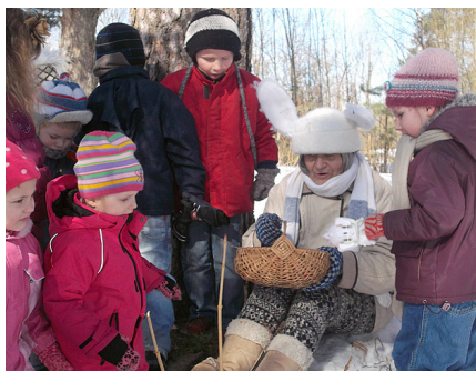
Tikšanās ar Lieldienu zaķi.

Dieviņš tā lēmis. Jāpiekrīt šai dienā Megijas skaitītājam rindām –