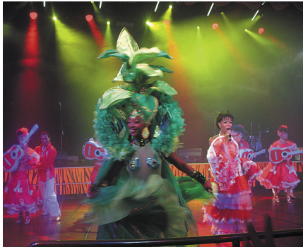
Kubas deļotāju šovs.