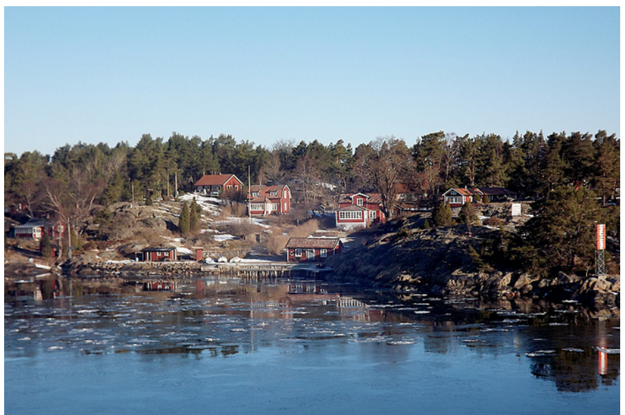
Skaistās Zviedrijas ainavas.