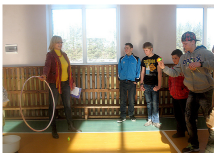
Ola jātrāpa caur riņķi bļodā.