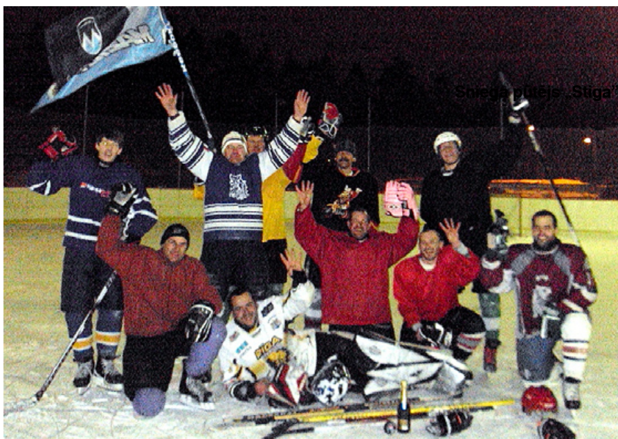
Gandarītie mētrēnieši pēc Madonas novada kausa mača.

Pirms katras spēles pretiniekiem dāvinājām piemiņas vimpeli no „Mazajiem Milžiem”. Bijām vispamanāmākā komanda ar savu karogu un līdzjutējiem.