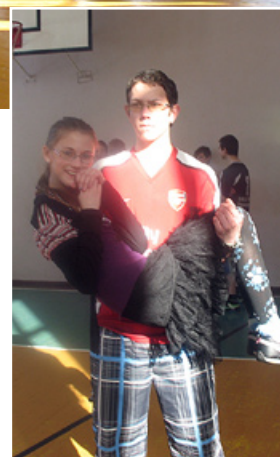
Kurš ilgāk noturēs meiteni klēpī.