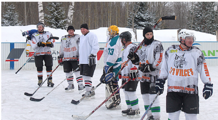
Hokeja komanda „Vilces” no Lubānas klāniem.

Mūsu projekta iesniegums Nr. 12-05-LL15-L413202-000003 „Hokeja laukuma – slidotavas infrastruktūras attīstības projekts Mētrienā” tika atzīnīgi novērtēts un 2012. gada novembrī īstenots ar ES atbalsta intensitāti 90%,