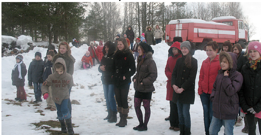
Skatītāju interese bija liela.