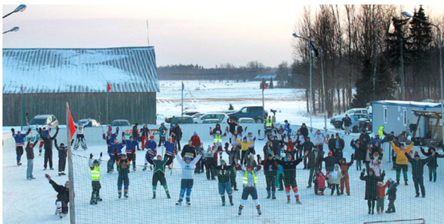
Pasākuma laikā tapa spēlētāju un līdzjutēju kopbilde.