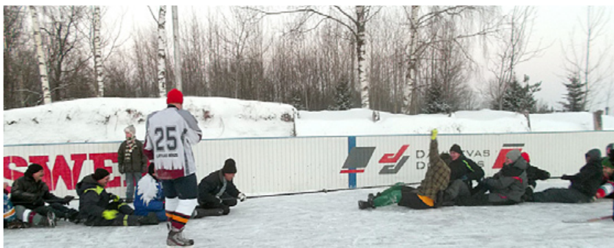
Hokejisti sacenšas virves vilkšanā.