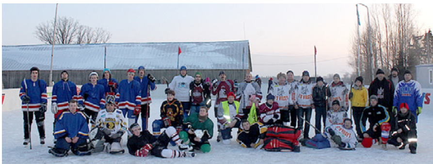
Sezonas pirmo sacensību dalībnieki.