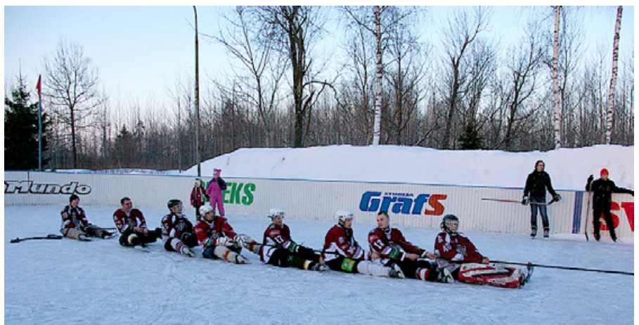
Rīdziniekiem ir ko turēt – Mētrienas vīri ir spēcīgi pretinieki.