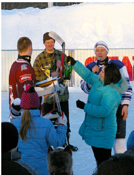
Balvu saņem rīdzinieki.

17. februāris. Pašiem neticot, gaidām Rīgas „Dinamo” Fanu kluba hokejistus uz mūsu laukuma „Akmentājos”. Sabraukuši ļoti daudz līdzjutēju. Mēs, „Mazo Milžu” hokejisti, ar ļoti lielu atbildības sajūtu, bet ne bez nervu spriedzes, vērojam ceļu uz Mētrienas centru. Ar nelielu kavēšanos, ilgi gaidītie ciemiņi ir klāt. Hokejisti tiek aicināti mūsu mājīgajā vagoniņā, lai varētu sagatavoties spēlei. Kā jau oficiālās spēlēs, viesi mazliet tika iepazīstināti ar mūsu pagastu, uzdevām dažus intelektuālus jautājumus par iedzīvotāju skaitu un Mētrienas ģerboņi. Vēl tikai vimpeliņu apmaiņa, tiesnešu svilpe un spēle sākas.