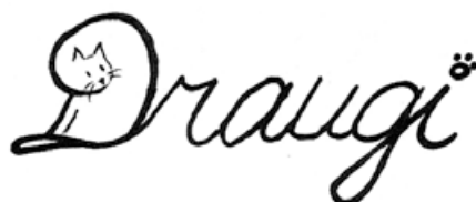
Renārs Ivāns, 4. klase.