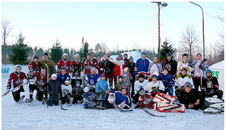
Spēles noslēgumā draudzības bilde.

„Mazie Milži” visi gribēja spēlēt, tāpēc veidojām divas komandas. Līdz ar to, varbūt bijām vājāki, kā gribētos, toties ieguvēji bijām visi. Tas nekas, ka abas komandas piekāpās viesiem.