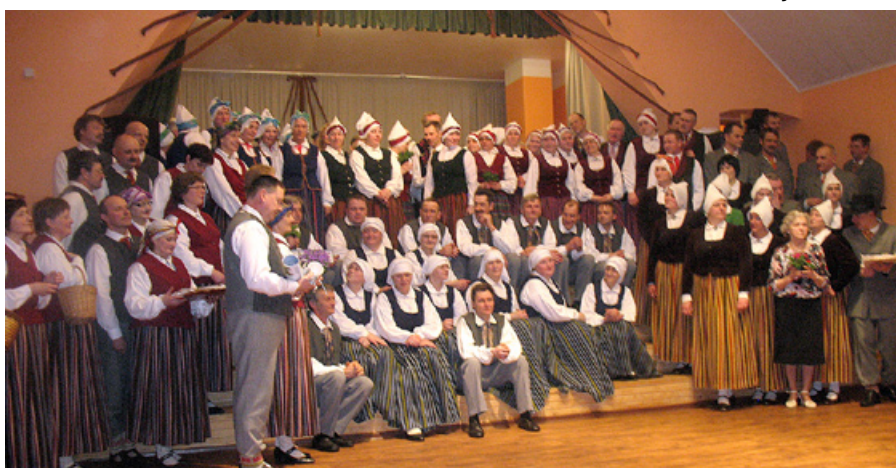
Deju kolektīvu kopbilde.

deju kolektīvs „Varavīksne” un Mētrienas tautas nama senioru deju kolektīvs, kuram šis vakars bija īpašs, jo pirmo reizi dejoja ar savu vārdu „Mētra”.