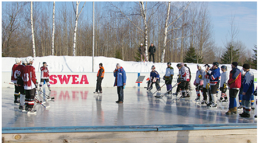
...un spēle starp hokeja cienītājiem var sākties!