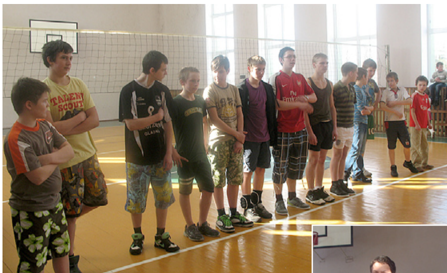
Zēni sacensībām gatavi.